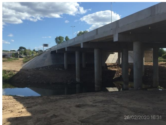
Ilustración 5 – Puente sobre A° Cuñapirú, Acceso Norte