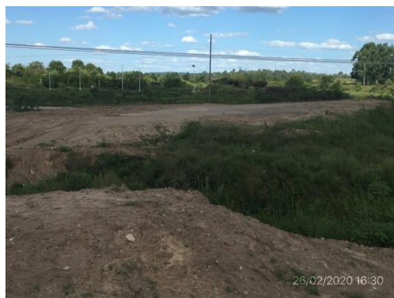
Ilustración 7 – Obrador desmontado, con tareas detalladas en el PRA realizadas y nota de aceptación de parte del propietario, Macromercado Mayorista S.A.