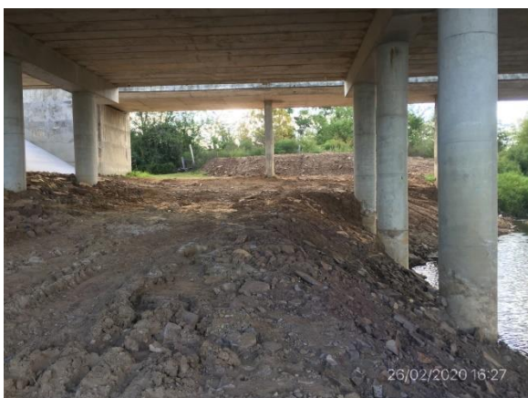
Ilustración 6 – Cimientos del puente en acceso norte en buenas condiciones de limpieza con recuperación realizada, sin escombros u otros rastros