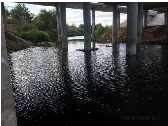
Ilustración 4 – Puente sobre A° Cuñapirú, Acceso Norte