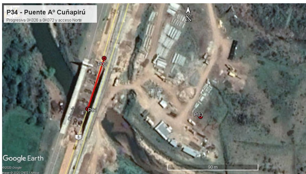
Ilustración 3 –Puntos destacados del contrato