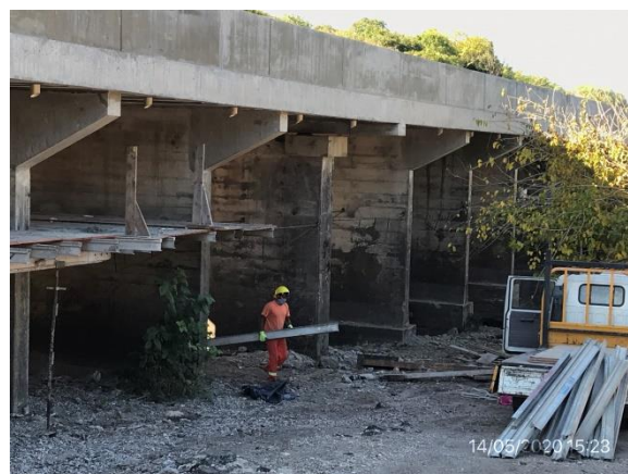
Ilustración 7 – P02. Tareas de refuerzo estructural en puente sobre A° Araujo.