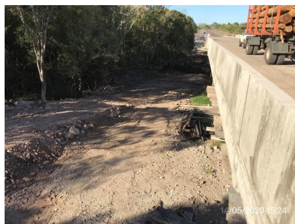
Ilustración 9 – P02. cauce del A° Araujo bajo el puente con tareas de limpieza realizadas