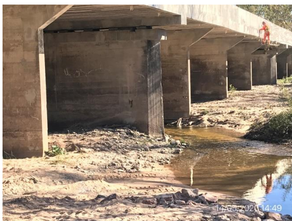
Ilustración 6 – P01, cauce del A° Soto bajo el puente con tareas de limpieza realizadas