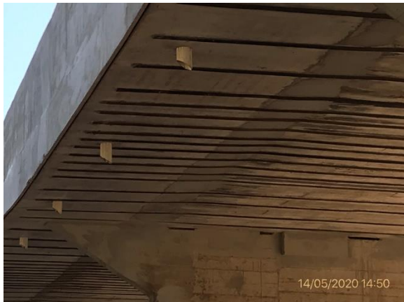
Ilustración 4 – P01, tareas terminadas de refuerzo estructura en puente sobre A° Soto