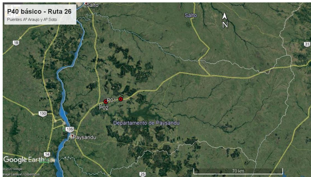
Ilustración 2 - Ubicación del contrato a nivel departamental.