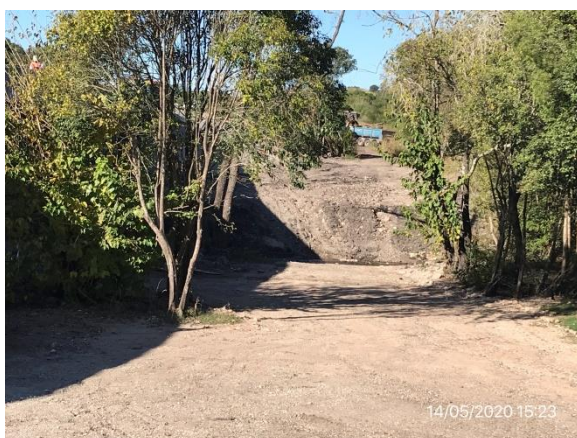
Ilustración 8 – P02. Planicie de inundación del A° Araujo con tareas de limpieza realizadas.