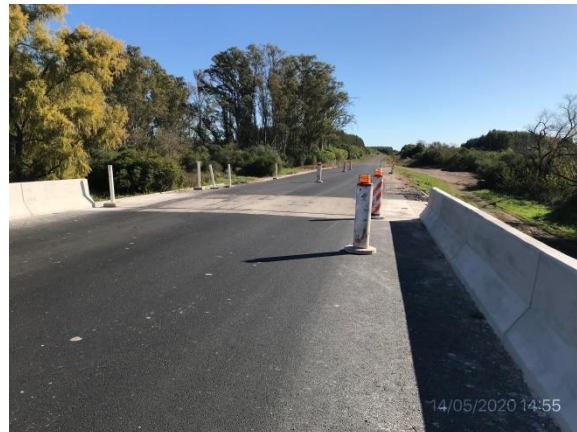
Ilustración 5 – P01, tareas terminadas de carpeta asfáltica sobre puente en A° Soto