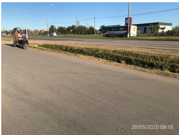
Ilustración 6 – Obras obligatorias en dársenas de Ruta 8