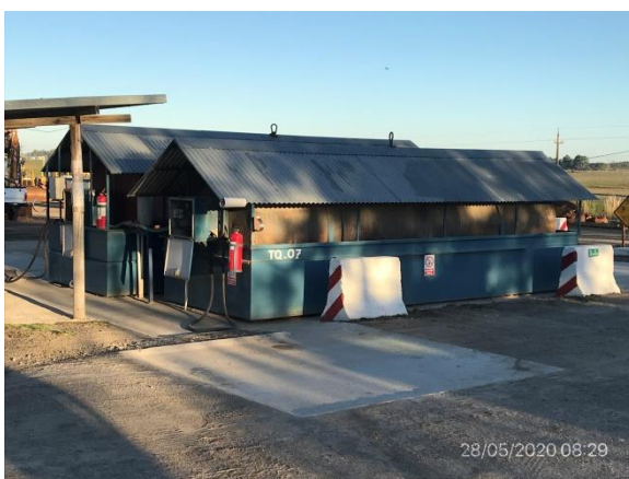
Ilustración 8 – P05. Obrador. Depósitos de combustible con envallado y techo.