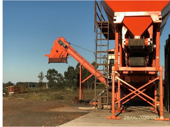
Ilustración 17 – P05. Obrador, planta asfáltica con filtro de mangas