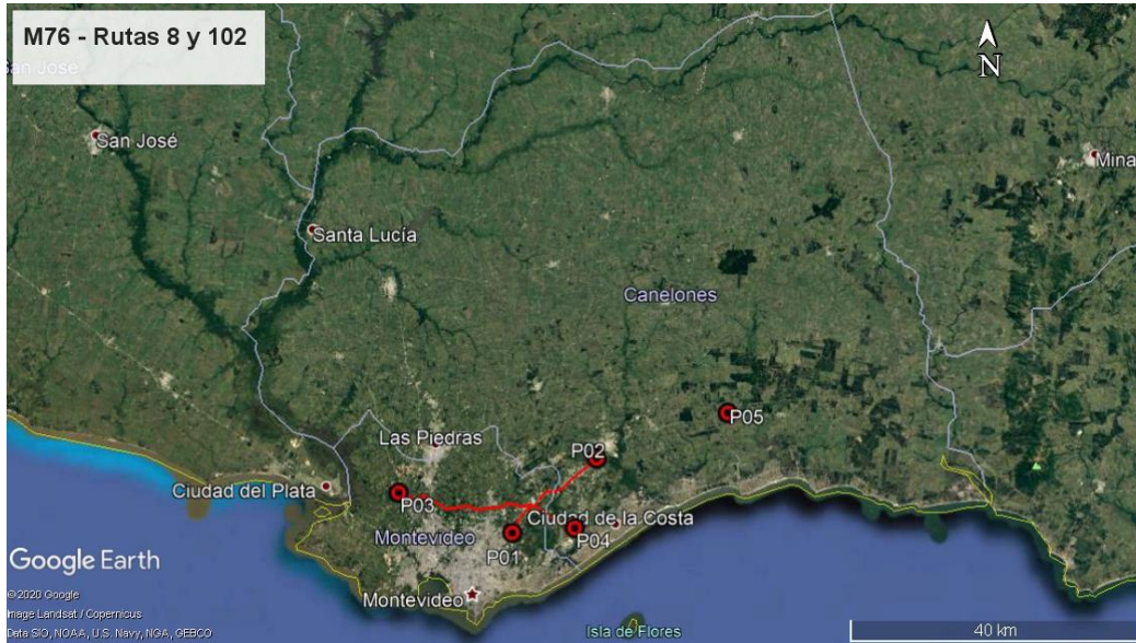
Ilustración 2 - Ubicación del contrato a nivel departamental.