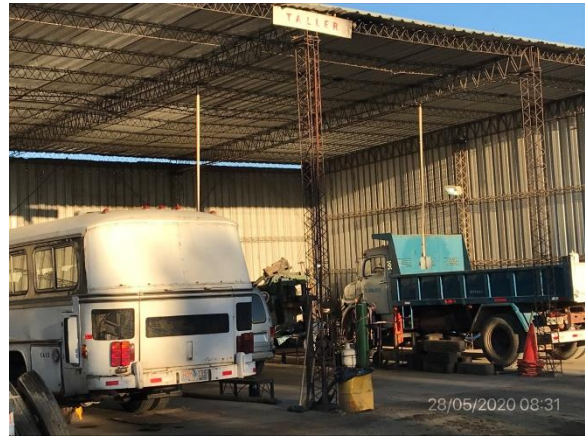
Ilustración 11 – P05. Taller techado con pavimento en hormigón.