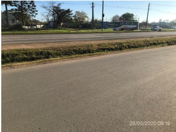
Ilustración 4 – Obras obligatorias en calles laterales de Ruta 8