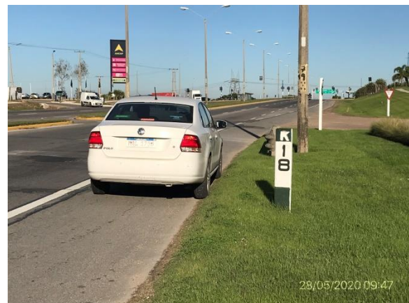
Ilustración 7 – P01 - Fin de tramo en Ruta 8