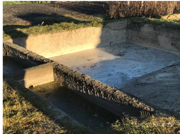
Ilustración 13 – P05. Obrador Sector para lavado de camiones míxer