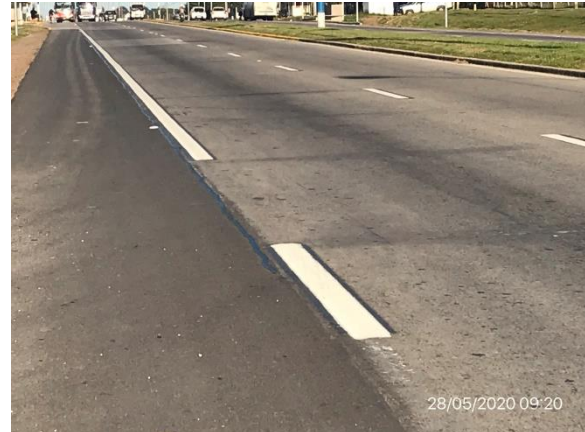
Ilustración 5 – Obras obligatorias en banquetas de Ruta 8