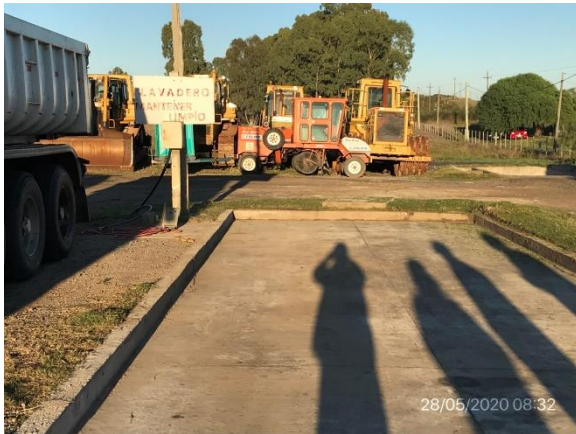
Ilustración 12 – P05. Obrador. Sector para lavado de camiones con pendientes hacia sistema de decantación.