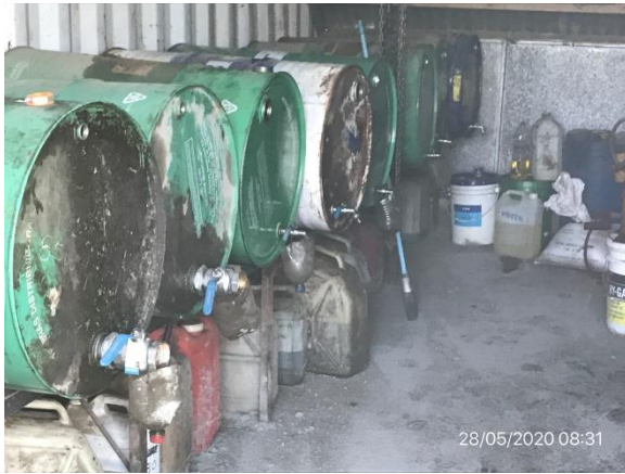
Ilustración 10 – P05. Obrador, sector techado y evallado para trasiego de lubricantes