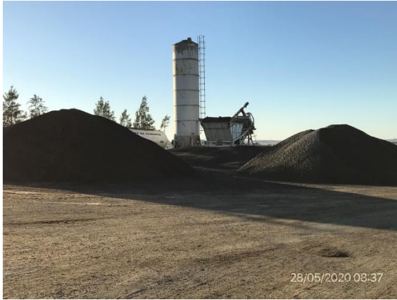
Ilustración 16 – P05. Obrador, sector de acopio de áridos