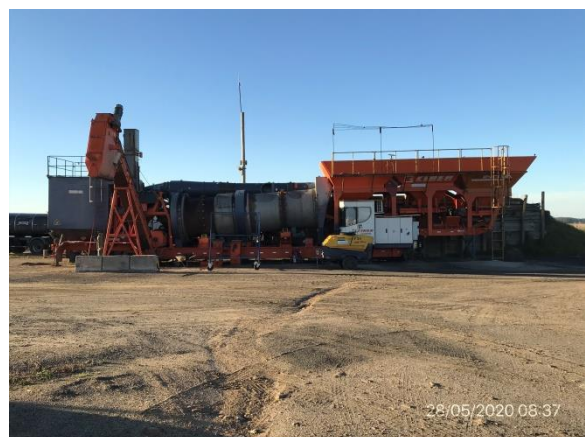
Ilustración 15 – P05. Obrador, planta asfáltica fuera de operación, en tareas de mantenimiento.