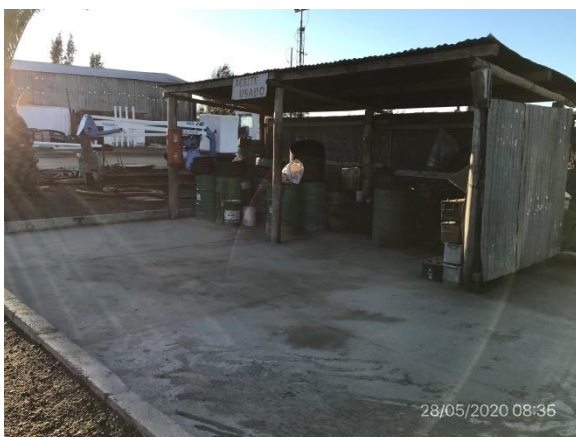
Ilustración 14 – P05. Obrador, acopio envallado de lubricantes usados