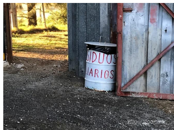
Ilustración 9 – P05. Obrador, acopio de residuos asimilables a domésticos