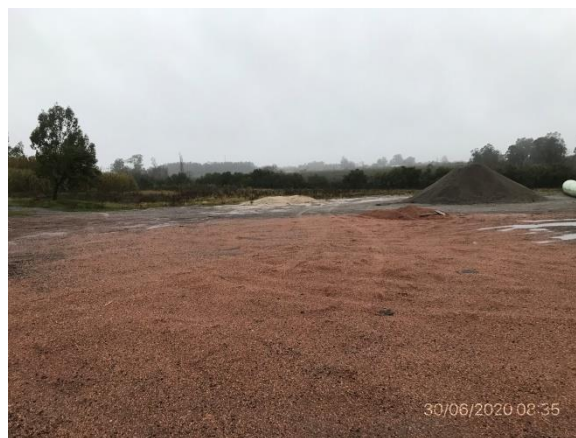
Ilustración 11 – P03 – Padrón Rural N° 15393, 15ª S.C. Canelones, zona recuperada tras desmantelamiento planta asfáltica.