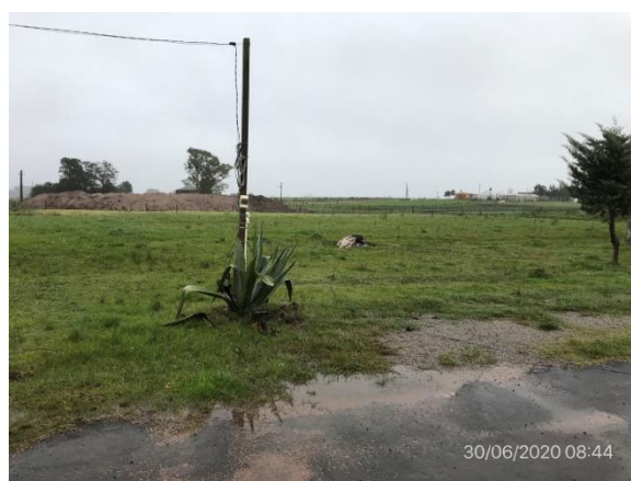
Ilustración 15 – Obrador y depósito de maquinaria desmontada, Ruta 81 progresiva 22K000, Padrón Rural N° 10723, 15ª S.C. Canelones.