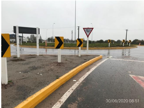
Ilustración 4 – P01, inicio de tramo. Ruta 81, progresiva 23K170, Paso de la Cadena