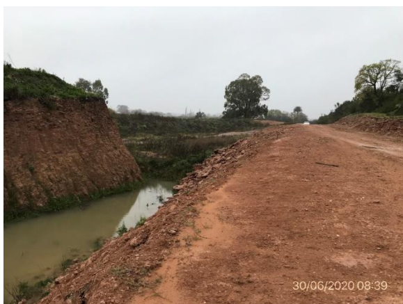
Ilustración 12 – P03 – Padrón Rural N° 15393, 15ª S.C. Canelones, Canchales de limo cerrados.