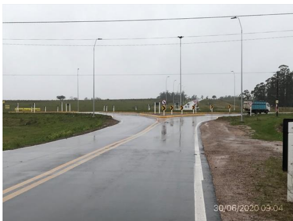
Ilustración 8 – P02 – Fin del contrato. Ruta 81, progresiva 33K000.