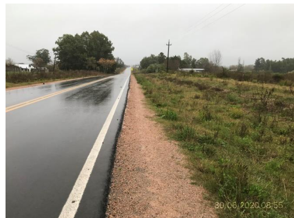
Ilustración 7 – Trabajos de recuperación de faja pública terminados, Ruta 81