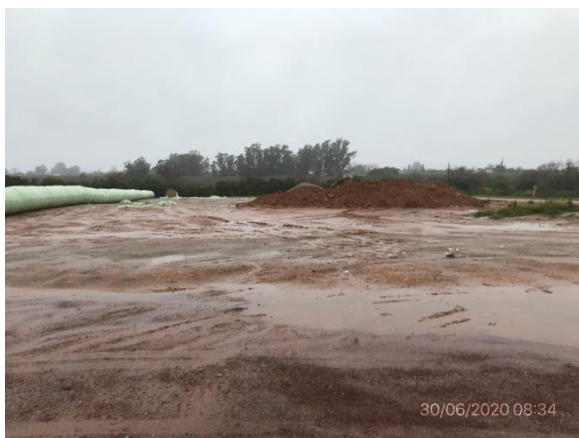
Ilustración 10 – P03 – Padrón Rural N° 15393, 15ª S.C. Canelones, zona recuperada tras desmantelamiento planta asfáltica