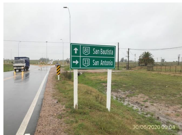
Ilustración 9 – P02 – Fin del contrato. Ruta 81, progresiva 33K000.