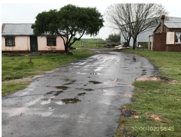
Ilustración 14 – Obrador y depósito de maquinaria desmontada, Ruta 81 progresiva 22K000, Padrón Rural N° 10723, 15ª S.C. Canelones.