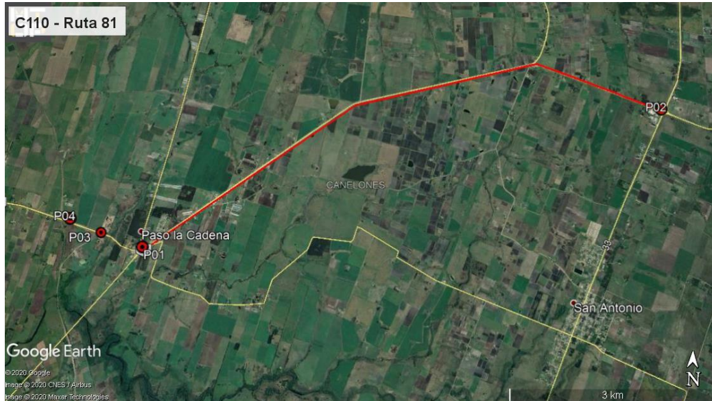
Ilustración 3 –Puntos destacados del contrato