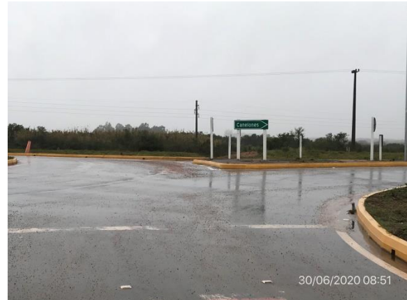
Ilustración 5 – P01, inicio de tramo. Ruta 81, progresiva 23K170, Paso de la Cadena