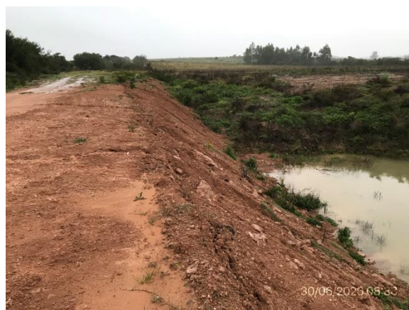
Ilustración 13 – P03 – Padrón Rural N° 15393, 15ª S.C. Canelones, Canchales de limo cerrados.