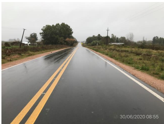
Ilustración 6 – Trabajos terminados, Ruta 81