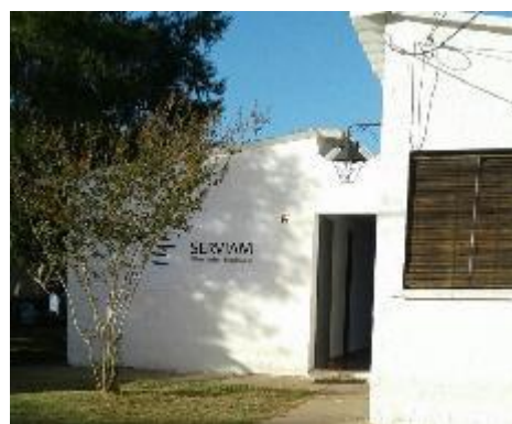
vista exterior de la sede de Vergara