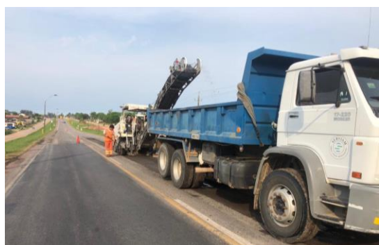
bacheo en calzada