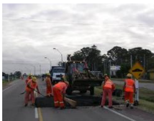
personal trabajando en tareas de pintura y bacheo con sus respectivos uniformes y elementos de seguridad

Dirección: Treinta y Tres 413 – San José, Uruguay Teléfono: (00598) (434) 29371 – (00598) (434) 29003 Fax: (00598) (434) 29763 Email: administracion@serviam.com.uy