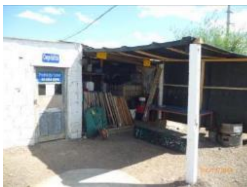
vista exterior de la sede de Mariscal

La empresa se encuentra instalada en las localidades de Mariscal y Vergara, donde se cuenta con * una sencilla oficina administrativa encargada de los pedidos de insumos al depósito central de la empresa, la gestión de los partes de equipos, elementos de seguridad del personal, tareas y otros documentos del SGI, así como de * un pequeño depósito de herramientas, señalización de obra, repuestos, insumos, etc.. En dichas instalaciones no se fabrican materiales de construcción, ni se tiene un taller mecánico, por lo cual no tiene el carácter de obrador. Desde estos puntos salen diariamente las cuadrillas de mantenimiento. En lo que respecta a las sedes, en éste último trimestre no registraron eventos ambientales significativos.