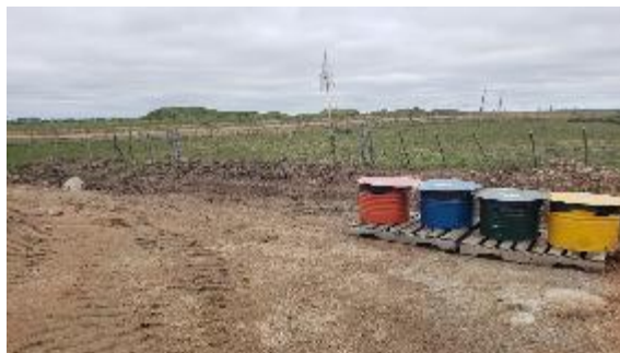
almacenamiento de residuos en obrador

Con los residuos se siguen las medidas contempladas en el SIG de la empresa y el PGAS del contrato. Los residuos se concentran, clasifican y almacenan temporalmente en recipientes debidamente tapados y rotulados, en el depósito de Mariscal y Vergara, y en el obrador. Los residuos del tipo domésticos son trasladados a los vertederos municipales de Mariscal y Vergara, para lo cual se gestionó autorización (no se dispone de registros por la falta de personal en el mencionado predio). Los residuos especiales son trasladados al depósito central de la