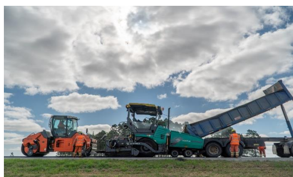
colocación de mezcla