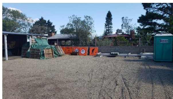
galponcito con señalización y herramientas de mano