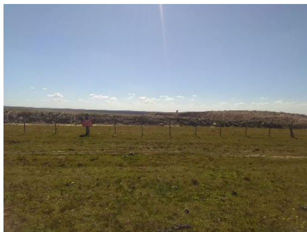
vista general de la cantera clausurada