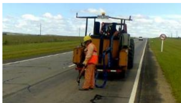
selladora de grietas