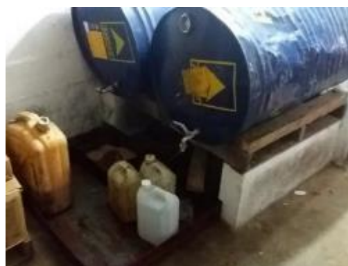
sistema de bandejas con arena para evitar derrames