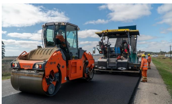
Compactación de mezcla