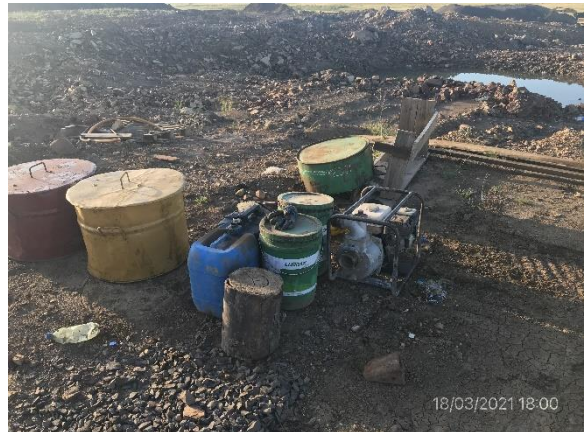
Ilustración 19 – P04, Cantera de basalto. Acopio de lubricantes usados sin contenciones impermeables.