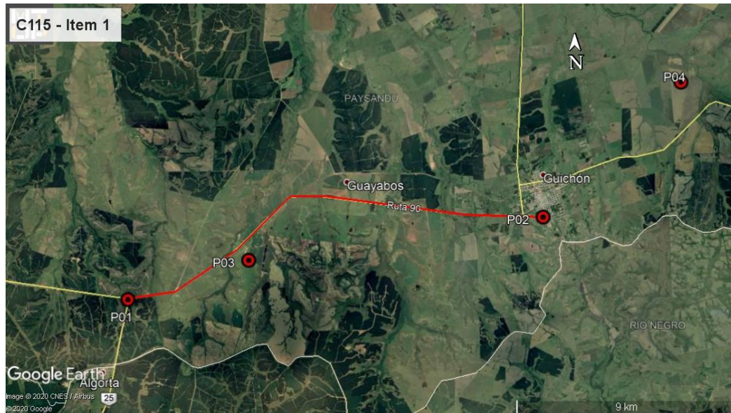
Ilustración 3 – Puntos destacados del contrato

En la siguiente tabla se presenta la localización y detalle de los puntos destacados de la obra auditada.