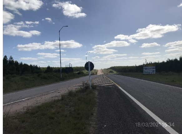
Ilustración 5 – P01, inicio de tramo de obras en Ruta 90. Empalme de Ruta 90 y Ruta 25.