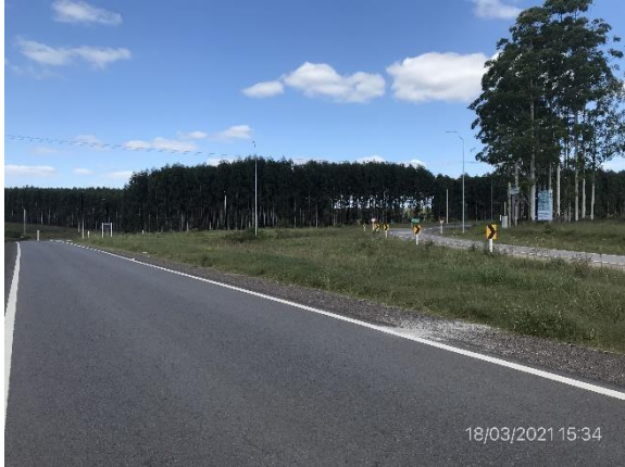
Ilustración 4 – P01, inicio de tramo de obras en Ruta 90. Empalme de Ruta 90 y Ruta 25.