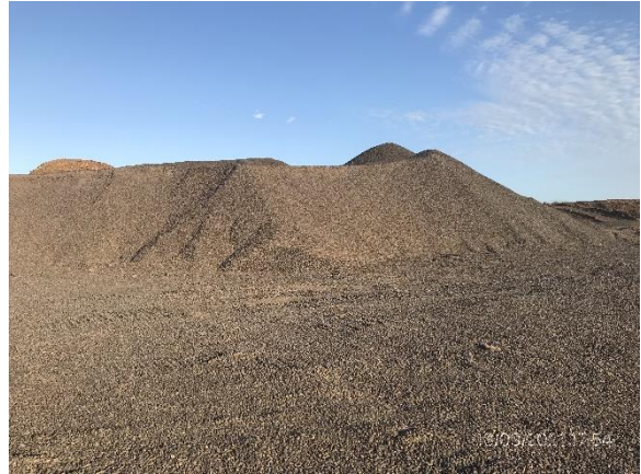
Ilustración 17 – P04, Cantera de basalto. Acopios triturados con trituradora desmantelada y trasladada.