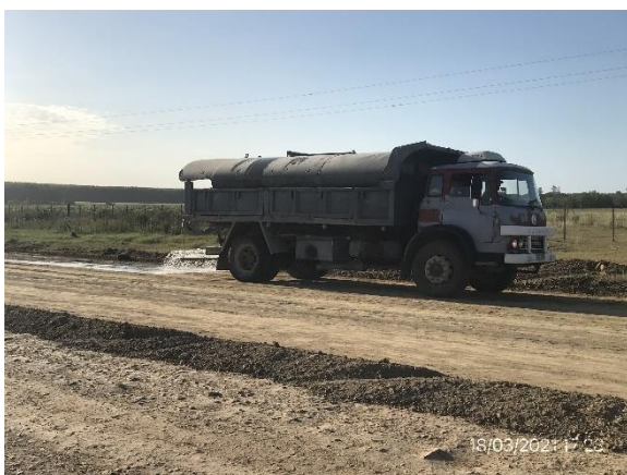
Ilustración 8 – Frente de obra. Ruta 90, trabajos de recargo y ensanche de sub-base y base granular.