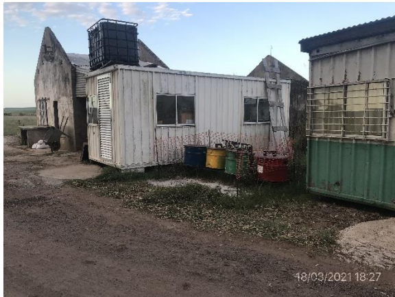
Ilustración 10 – P03, Obrador. Estación de residuos segregados por canal.