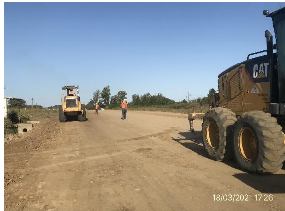
Ilustración 7 – Frente de obra. Ruta 90, trabajos de recargo y ensanche de sub-base y base granular.