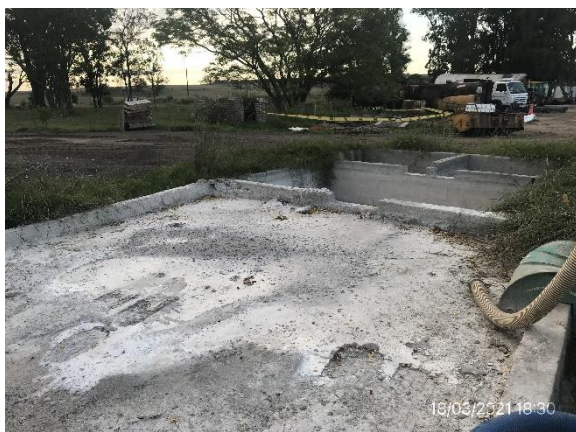
Ilustración 14 – P03, Obrador. Lavadero de camiones mixer con sistema de decantación de agua.