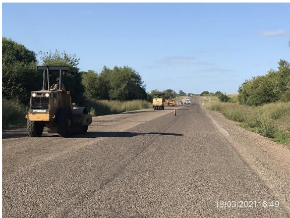
Ilustración 6 – Frente de obra. Ruta 90, trabajos de ejecución de tratamiento bituminoso doble.