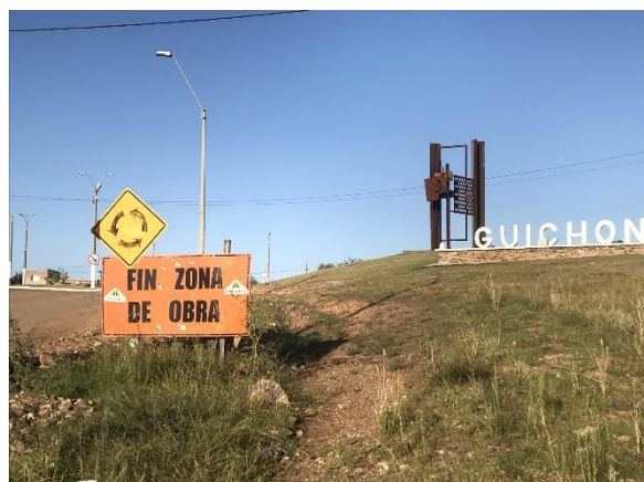
Ilustración 9 – P02, Fin de tramo de obras. Ruta 90 progresiva 89K200, Guichón.