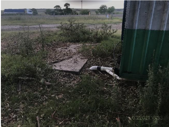
Ilustración 16 – P03, Obrador. Depósito impermeable en zona de baños.