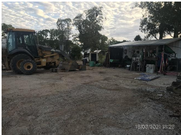
Ilustración 12 – P03, Obrador. Taller mecánico con pavimento impermeable.