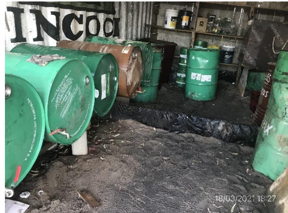
Ilustración 11 – P03, Obrador. Acopio de lubricantes usados techado y envallado con pavimento impermeable.