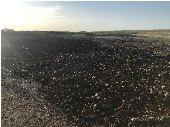
Ilustración 18 – P04, Cantera de basalto. Tendido de taludes y relleno de zona explotada en ejecución.