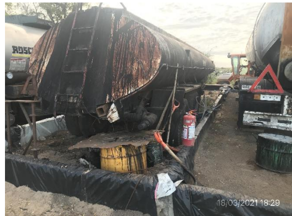
Ilustración 13 – P03, Obrador. Acopio de emulsiones asfálticas con envallados impermeables.