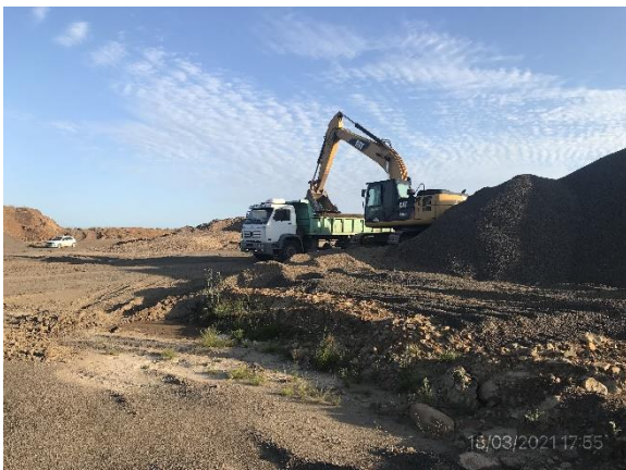
Ilustración 20 – P04, Cantera de basalto. No cuenta con servicios higiénicos.