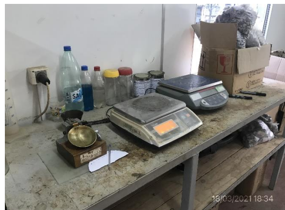
Ilustración 15 – P03, Obrador. Laboratorio de suelos.