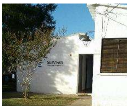
vista exterior de la sede de Vergara