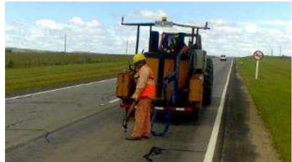
selladora de grietas