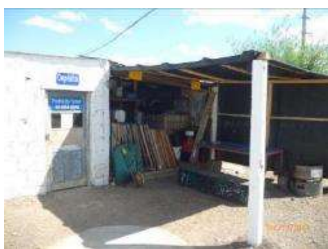
vista exterior de la sede de Mariscal

La empresa se encuentra instalada en las localidades de Mariscal y Vergara, donde se cuenta con * una sencilla oficina administrativa encargada de los pedidos de insumos al depósito central de la empresa, la gestión de los partes de equipos, elementos de seguridad del personal, tareas y otros documentos del SGI, así como de * un pequeño depósito de herramientas, señalización de obra, repuestos, insumos, etc.. En dichas instalaciones no se fabrican materiales de construcción, ni se tiene un taller mecánico, por lo cual no tiene el carácter de obrador. Desde estos puntos salen diariamente las cuadrillas de mantenimiento. En lo que respecta a las sedes, en éste último trimestre no registraron eventos ambientales significativos.