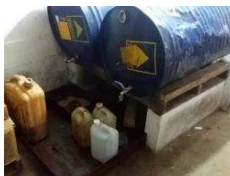
sistema de bandejas con arena para evitar derrames