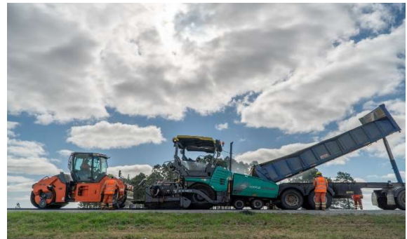
colocación de mezcla