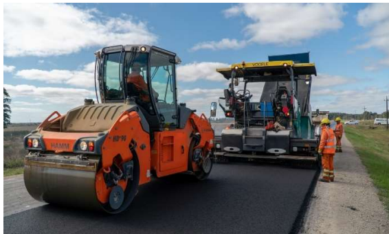
Compactación de mezcla