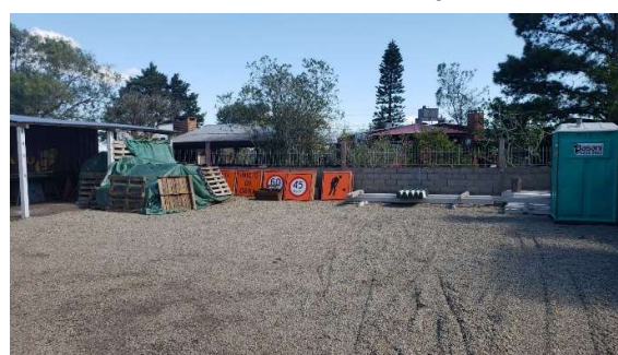
galponcito con señalización y herramientas de mano