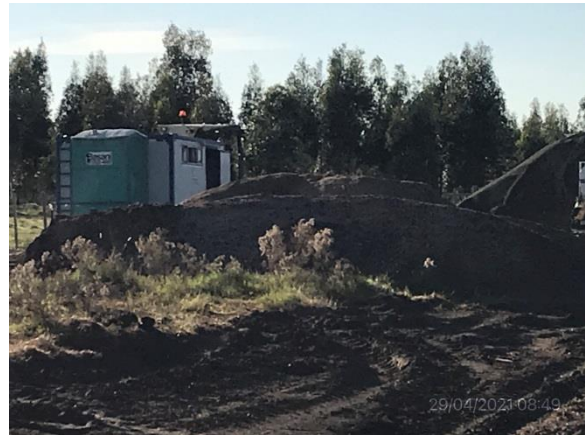
Ilustración 11 – P03, Obrador. Acopio de áridos.