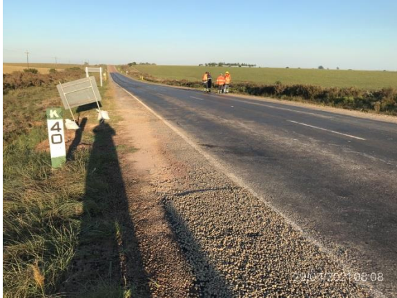
Ilustración 4 – P01, Inicio de tramo. Ruta 56 progresiva 40K000.