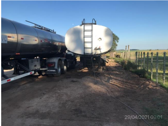
Ilustración 16 – P03, Obrador. Cisterna de emulsiones asfálticas. No cuenta con estructura perimetral para retención de derrames