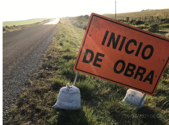
Ilustración 5 – P01, Inicio de tramo. Ruta 56 progresiva 40K000.