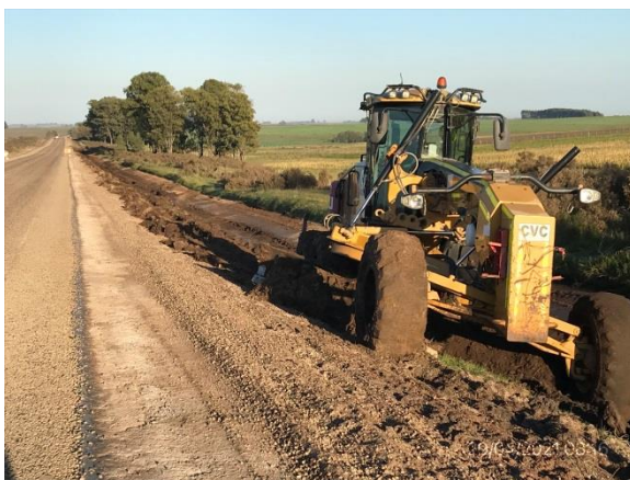
Ilustración 8 – P05, Frente de obras. Ruta 56 progresiva 53K100.