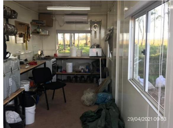
Ilustración 17 – P03, Obrador. Laboratorio de suelos.