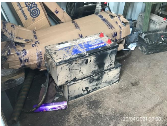
Ilustración 14 – P03, Obrador. Sector de acopio de baterías usadas bajo techo.