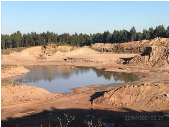
Ilustración 10 – P04, Cantera de MTOP / DNV.