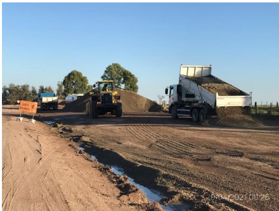
Ilustración 6 – P05, Frente de obras. Ruta 56 progresiva 53K100.