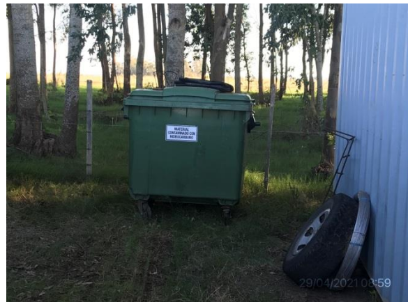
Ilustración 13 – P03, Obrador. Sector de acopio de residuos contaminados con hidrocarburos.