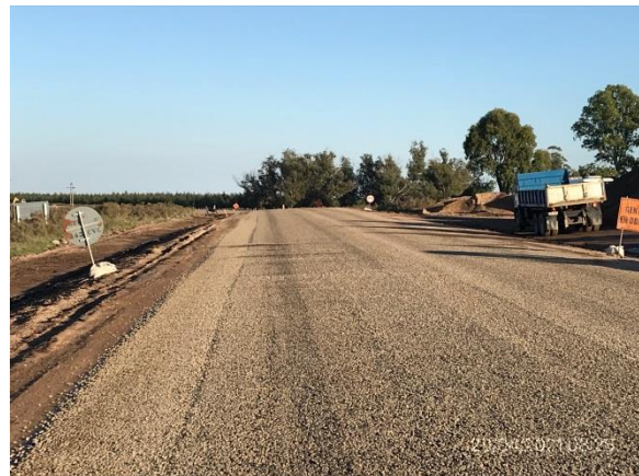
Ilustración 7 – P05, Frente de obras. Ruta 56 progresiva 53K100.