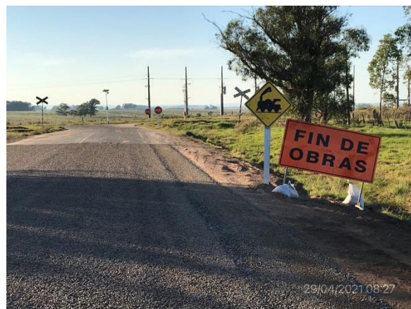
Ilustración 9 – P02, Fin de tramo, 56 progresiva 56K000, empalme con Ruta 7.