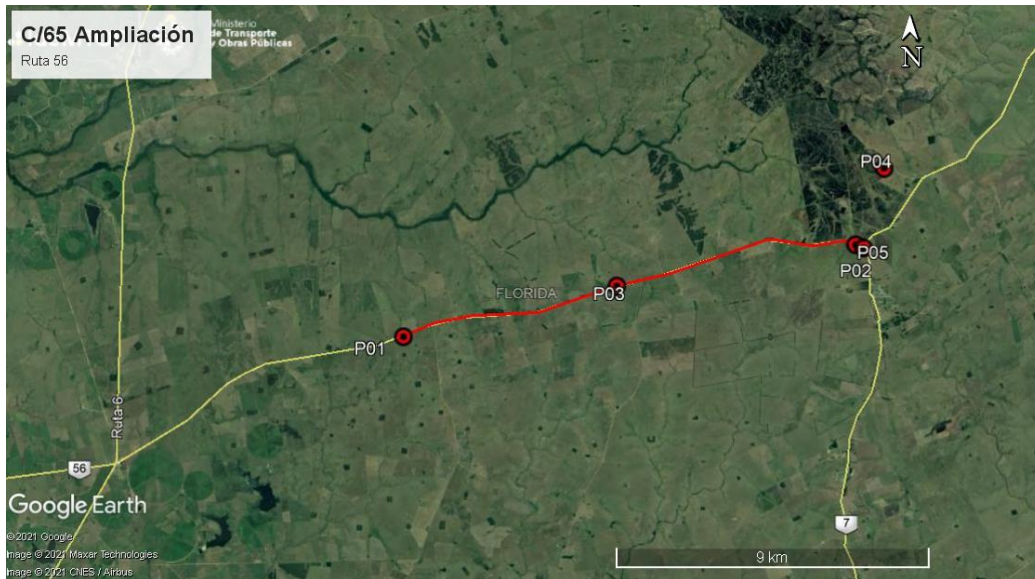
Ilustración 3 – Puntos destacados del contrato.