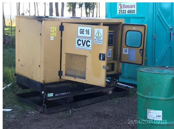
Ilustración 15 – P03, Obrador. Generador eléctrico con contenedor metálico inferior para retención de derrames.