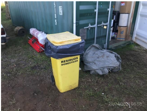
Ilustración 12 – P03, Obrador. Sector de acopio de residuos asimilables a domésticos.