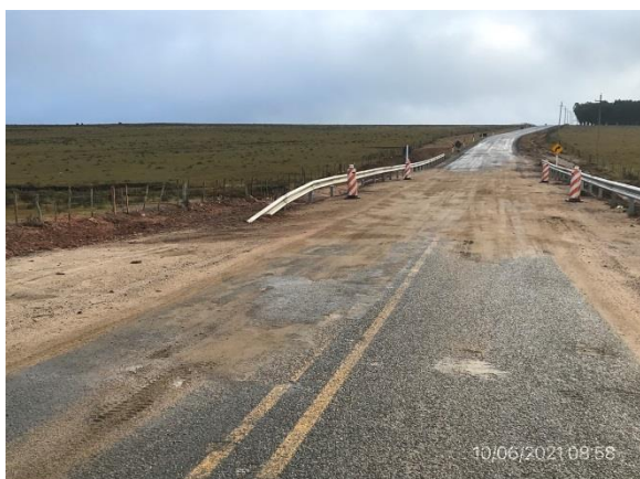
Ilustración 8 – P01, Nueva alcantarilla H en Ruta 6, progresiva 229K850. Capa de rodadura sin ejecutar hasta finalización de veda MTOP – DNV.