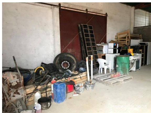
Ilustración 9 – P02, Obrador principal con escasa actividad. Pañol techado.