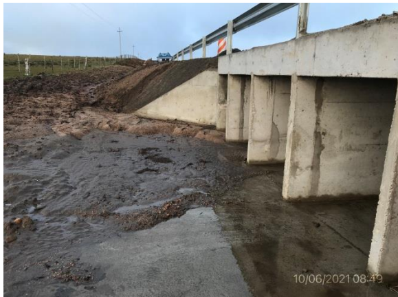
Ilustración 4 – P01, Nueva alcantarilla H en Ruta 6, progresiva 229K850. Cauce sin restos de obra