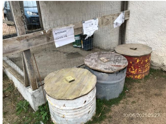
Ilustración 11 – P02, Obrador principal. Sector de acopio de residuos segregados por corriente de generación.