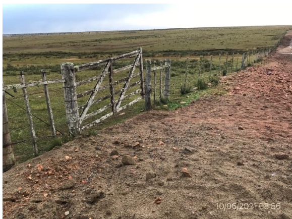
Ilustración 6 – P01, Zona de campamento provisorio desmontado y descompactado.