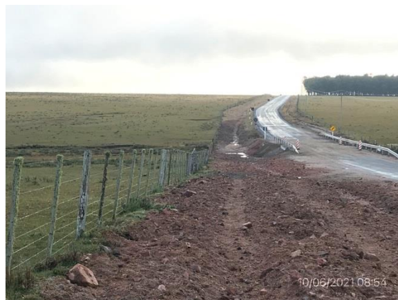
Ilustración 7 – P01, Zona de campamento provisorio desmontado y descompactado.