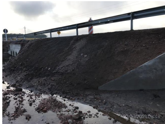
Ilustración 5 – P01, Nueva alcantarilla H en Ruta 6, progresiva 229K850. Taludes con cubierta de tierra vegetal