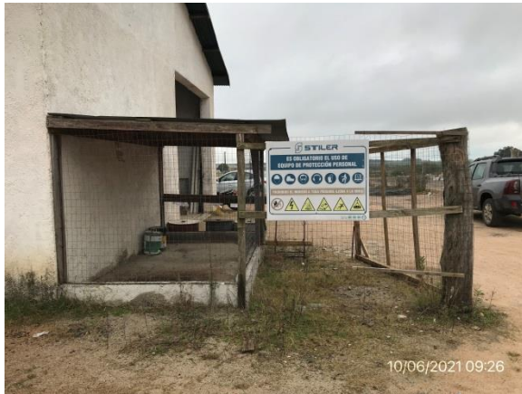
Ilustración 10 – P02, Obrador principal. Sector de acopio de lubricantes.