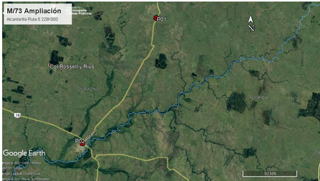
Ilustración 3 –Puntos destacados del contrato