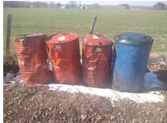
Ilustración 13 – Campamento provisional actualmente desmontado en progresiva 408K100 a (+), Ruta 3. Estructura provisional para retención de derrames.