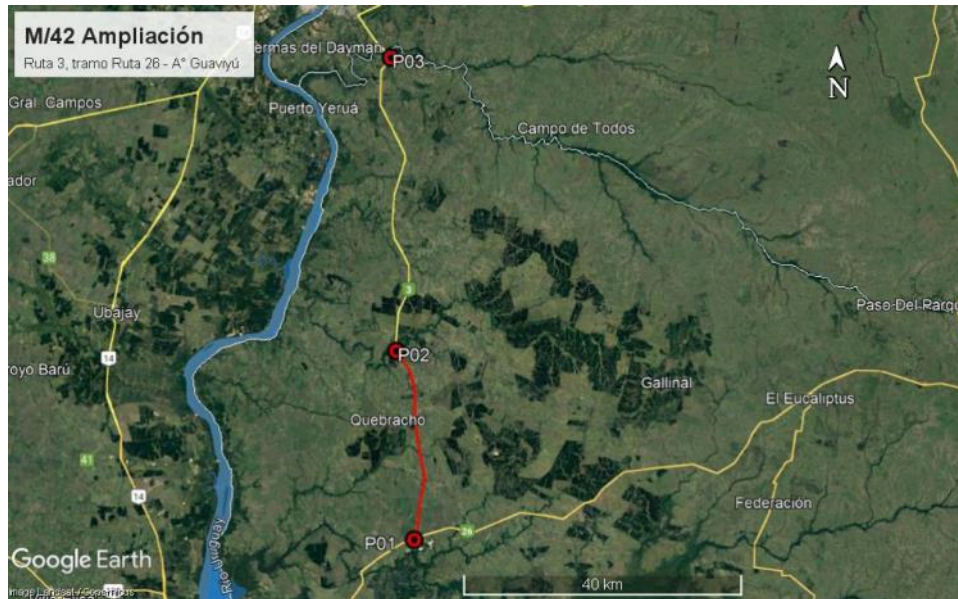
Ilustración 3 – Puntos destacados del contrato