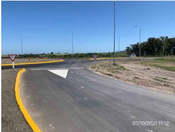
Ilustración 4 – P01, Inicio de tramo. Ruta 3 progresiva 403K950.