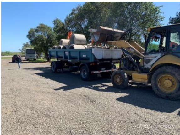
Ilustración 6 – P01, Rotonda de Rutas 3 y 26. Campamento provisional y estacionamiento de maquinaria.