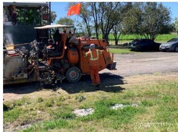
Ilustración 7 – P01, Rotonda de Rutas 3 y 26. Frente de obras, trabajos de señalización horizontal en ejecución