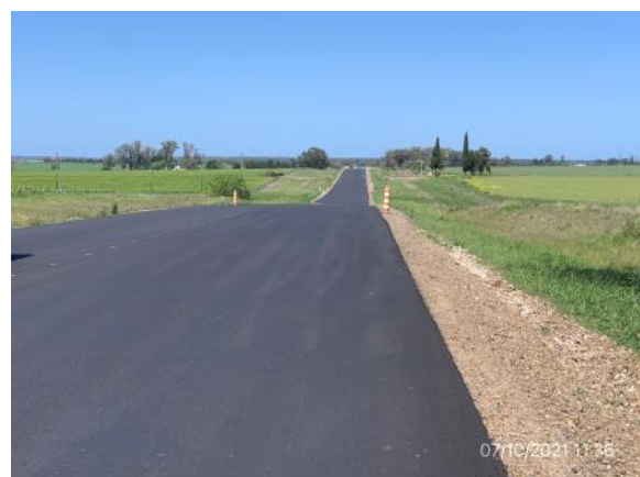
Ilustración 9 – Ruta 3, tramo de obras con refuerzo estructural y recapado terminados y con recuperación ambiental de la faja pública realizada: empastado y drenajes adecuados.