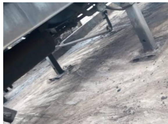
Ilustración 15 – P03, Obrador principal. Envallado bajo planta asfáltica con limpieza realizada de acuerdo al PGA de la obra.