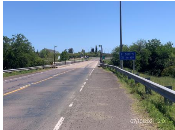
Ilustración 11 – P02, Fin de tramo. Ruta 3 progresiva 431K700, A° Guaviyú