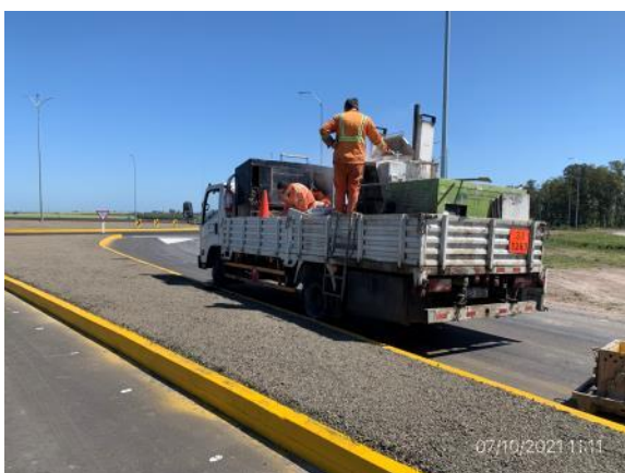
Ilustración 8 – P01, Rotonda de Rutas 3 y 26. Frente de obras, trabajos de señalización horizontal en ejecución.