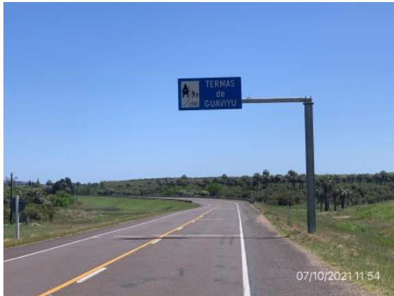
Ilustración 10 – P02, Fin de tramo. Ruta 3 progresiva 431K700, A° Guaviyú.