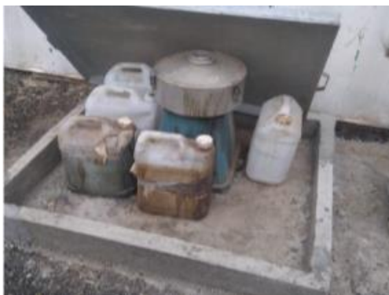
Ilustración 14 – P03, Obrador principal. Envallado perimetral bajo acopio de percloroetileno usado.