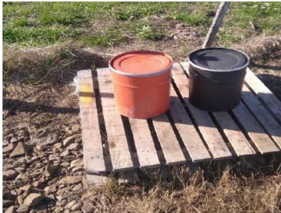
Ilustración 12 – Campamento provisional actualmente desmontado en progresiva 408K100 a (+), Ruta 3. Estructura provisional para retención de derrames.