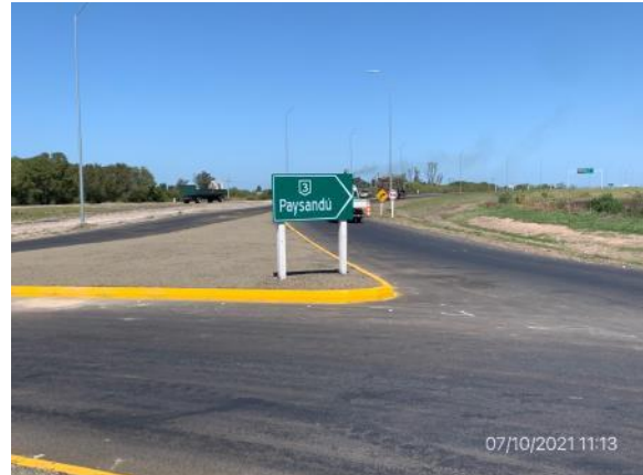
Ilustración 5 – P01, Inicio de tramo. Ruta 3 progresiva 403K950.