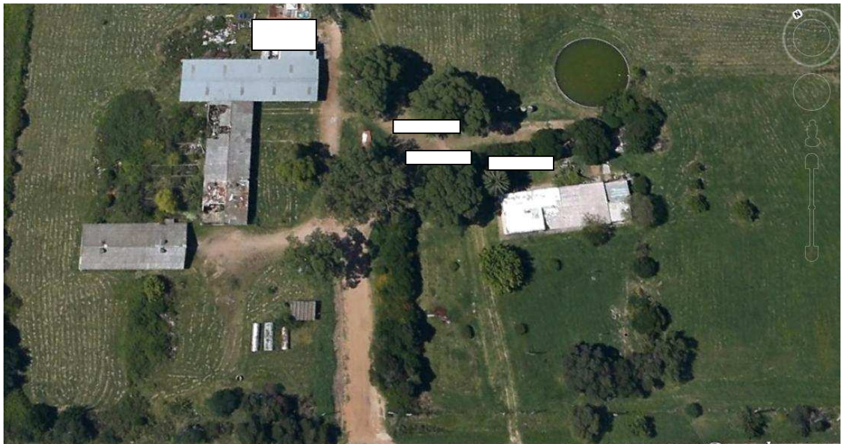
Detalle de ubicación de contenedores de oficina y depósitos