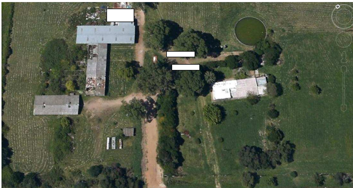
Detalle de ubicación de contenedores de oficina y depósitos