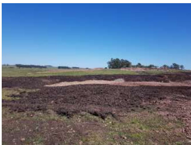
Vista de la restauración de la cantera

Se encuentran en ejecución las tareas de restauración de la cantera en cuanto a acondicionamiento de frentes de ejecución y cubierta con el suelo orgánico de destape.