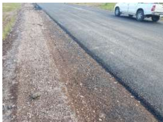
Escombros hallados en la progresiva 45.500 y disposición final en talud finalizada.