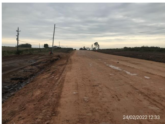
Ilustración 14 – P04, Frente de obras. Ruta 81, progresiva 45K700. Tareas de perfilado de cuentas y corrección de drenajes en curso.