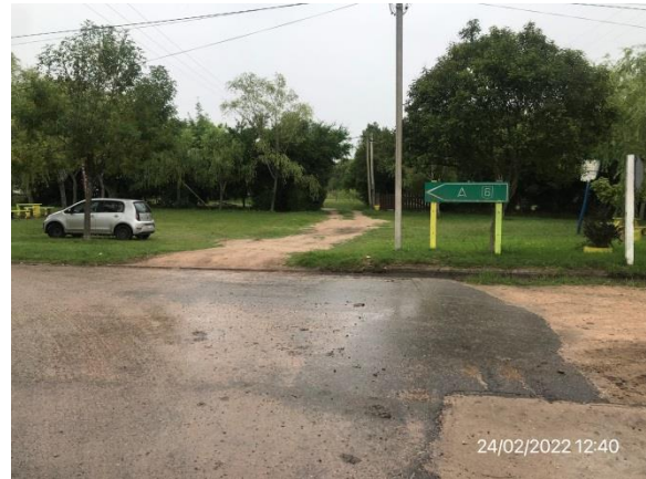
Ilustración 17 – P01, Inicio de tramo. Ruta 81, progresiva 42K300. Próximo al empalme con Ruta 6, zonas a expropiar.