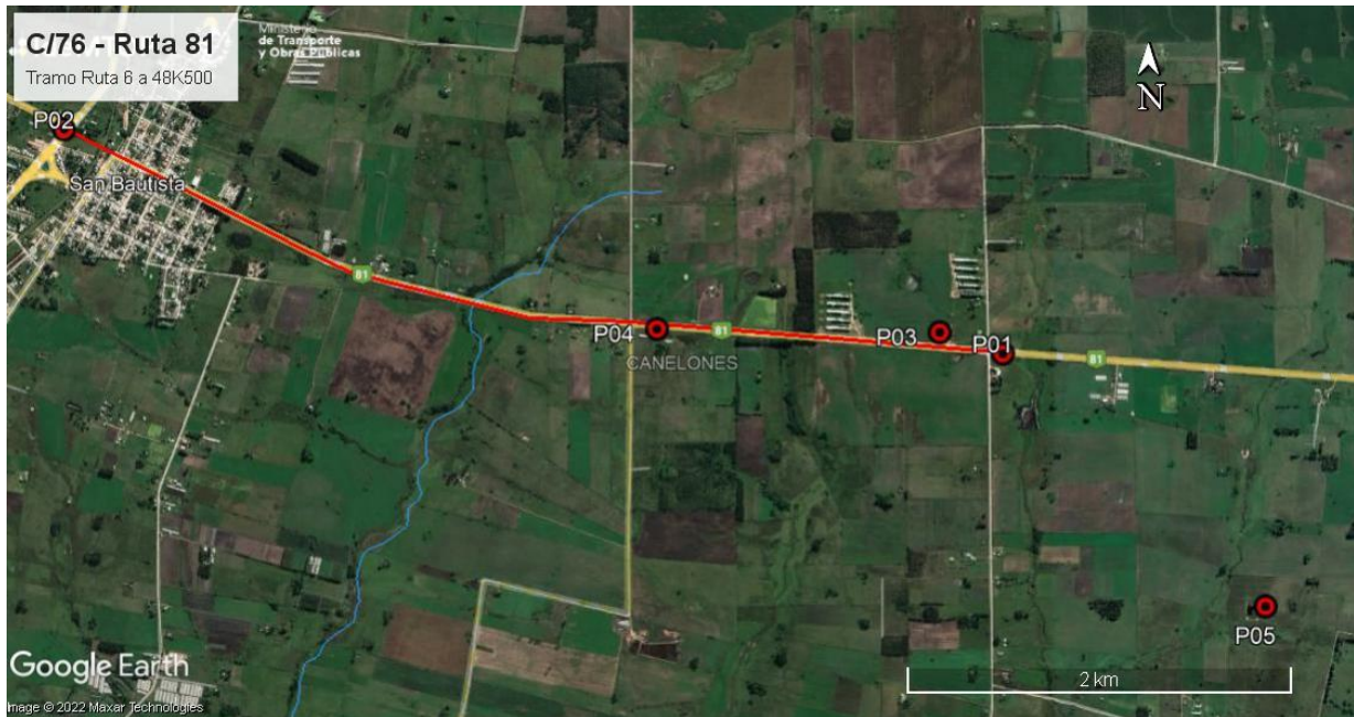
Ilustración 3 – Puntos destacados del contrato