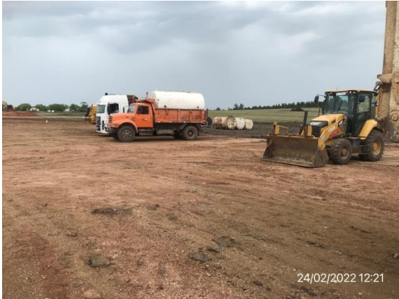
Ilustración 4 – P03, Obrador. Infraestructura incompleta para gestión de residuos.