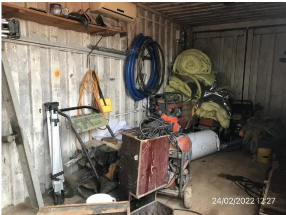
Ilustración 6 – P03, Obrador. Pañol.