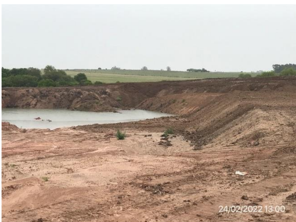
Ilustración 8 – P05, Cantera de limo. Ruta 81, progresiva 49K800 a (+). Pileta de decantación operativa.