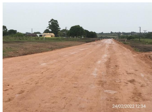
Ilustración 15 – Tramo en obra, Ruta 81. Tareas de recargo y ensanche de plataforma culminadas.