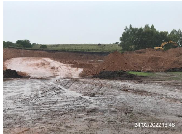
Ilustración 11 – P06, Cantera de tosca. Ruta 81, progresiva 22K600 a (-). Acopios de tosca.