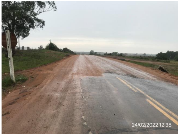
Ilustración 16 – P01, Inicio de tramo. Ruta 81, progresiva 42K300, empalme con Ruta 6.