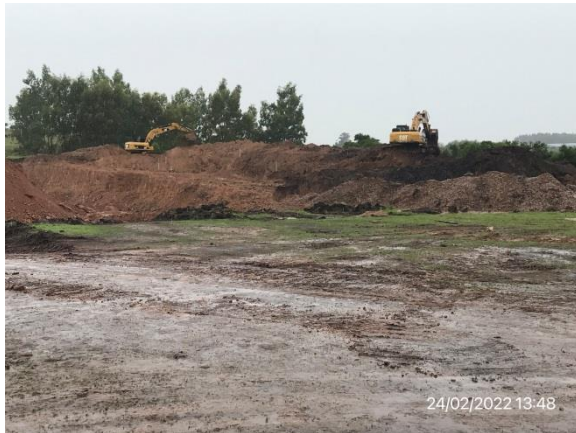
Ilustración 10 – P06, Cantera de tosca. Ruta 81, progresiva 22K600 a (-). Maquinaria en operación. No hay servicios de confort para operarios ni infraestructura para gestión de residuos y atención de contingencias.