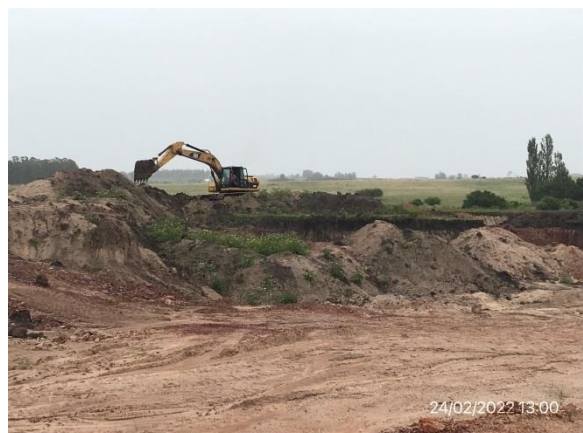
Ilustración 9 – P05, Cantera de limo. Ruta 81, progresiva 49K800 a (+). Maquinaria en operación. No hay servicios de confort para operarios ni infraestructura para gestión de residuos y atención de contingencias.