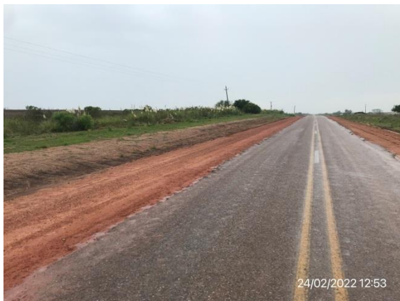
Ilustración 12 – P02, Fin de tramo. Ruta 81, progresiva 48K500. Interfase entre contratos C/76 ampliación y C/72 ampliación.