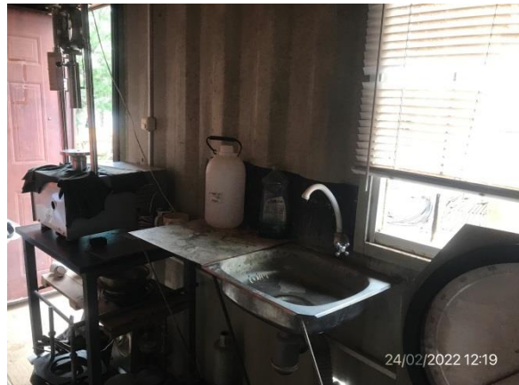
Ilustración 7 – P03, Obrador. Laboratorio de suelos.