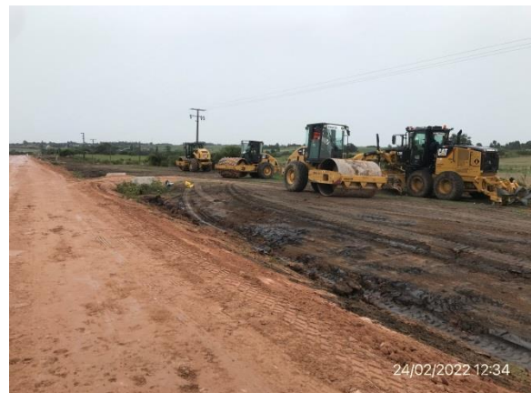
Ilustración 13 – P04, Frente de obras. Ruta 81, progresiva 45K700. Tareas de ensanche de plataforma en curso.