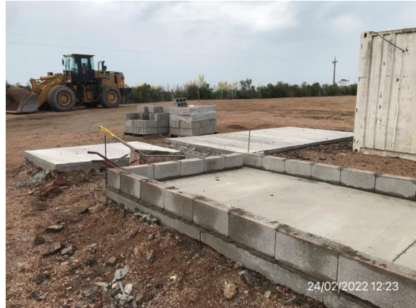
Ilustración 5 – P03, Obrador. Infraestructura en construcción para decantación de efluentes.