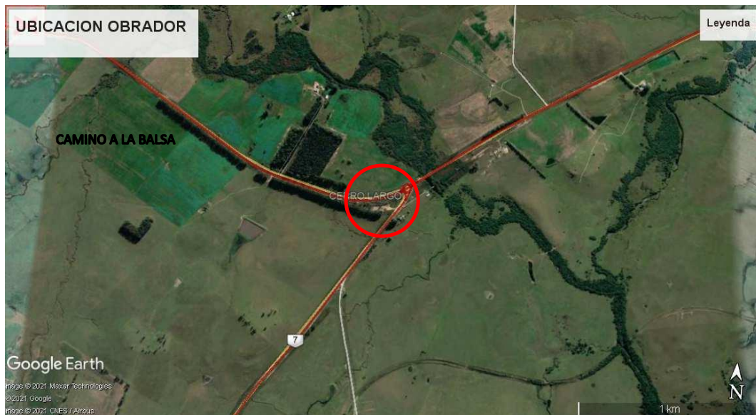
Fig. 1 Ubicación Obrador

El obrador central se ubicará en el predio de la regional 3 ubicado en la intersección de ruta 26 y ruta 7, aproximadamente a la altura del km 417 de ruta 26.