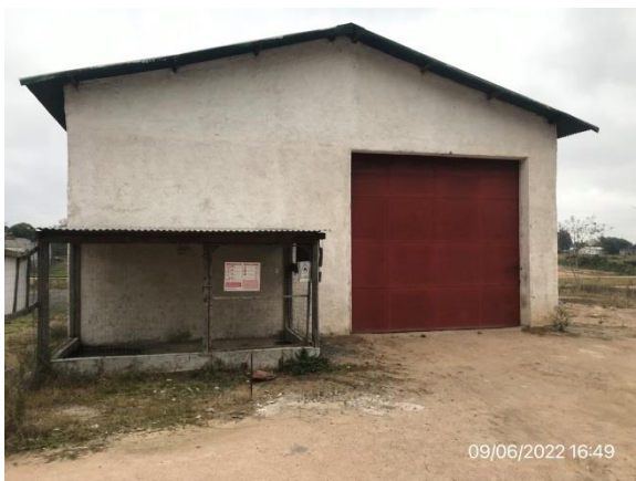
Ilustración 8 – P03, Obrador principal desmontado, Sarandí del Yí. Se retiraron los restos de lubricantes y