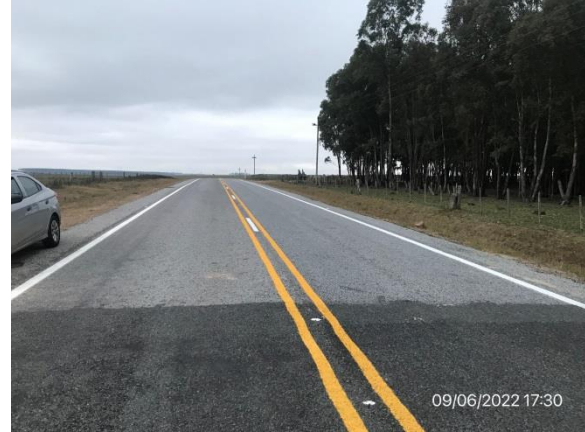
Ilustración 5 – Tramo de ruta 6 con obras terminadas, base recargada, tratamiento bituminoso y señalización ejecutados.