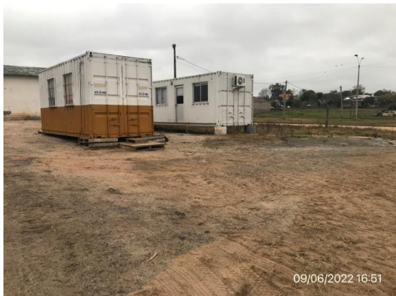
Ilustración 10 – P03, Obrador subcontratista Tafarol SA. Quedan en el predio por medio de acuerdo privado entre ésta y el propietario.