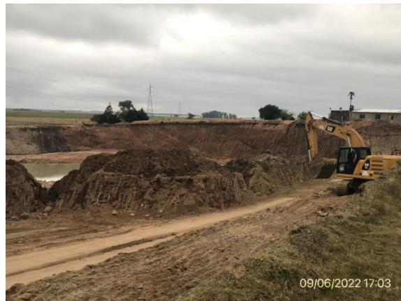
Ilustración 11 – P04, Cantera de tosca. Ruta 6, progresiva 208K200 a (-). Maquinaria trabajando tras ampliación de destino para otro contrato.