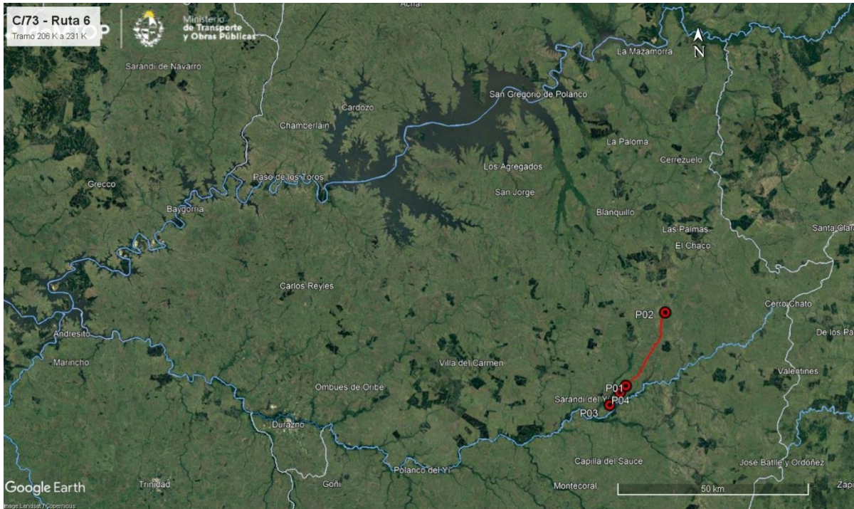
Ilustración 2 - Ubicación del contrato a nivel departamental.