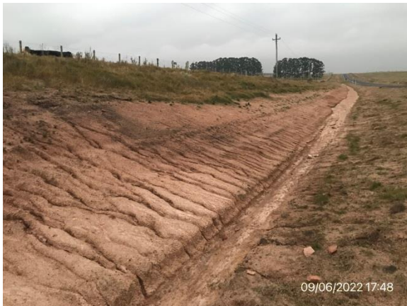
Ilustración 6 – Faja pública de Ruta 6 con taludes erosionados por arrastre pluvial combinado con falta de recubrimiento vegetal.