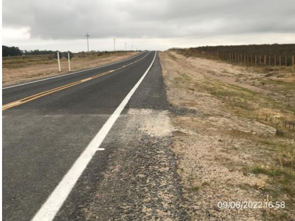
Ilustración 4 – P01, Inicio de obras. Ruta 6, progresiva 206K000. Ingreso a localidad de Sarandí del Yí.