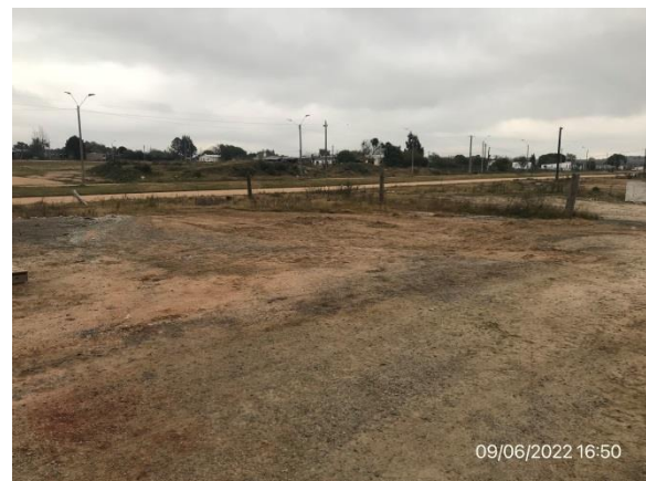
Ilustración 9 – P03, Obrador principal. Sarandí del Yí. Explanada de acopios limpia, queda como mejora a