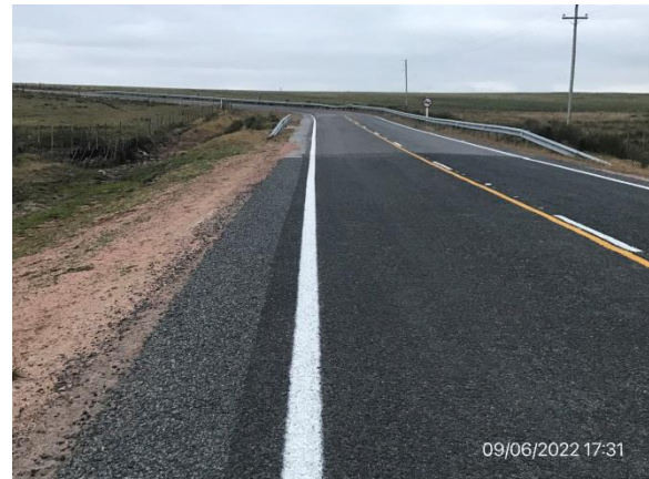
Ilustración 7 – P02, Fin de tramo. Ruta 6, progresiva 231K000.