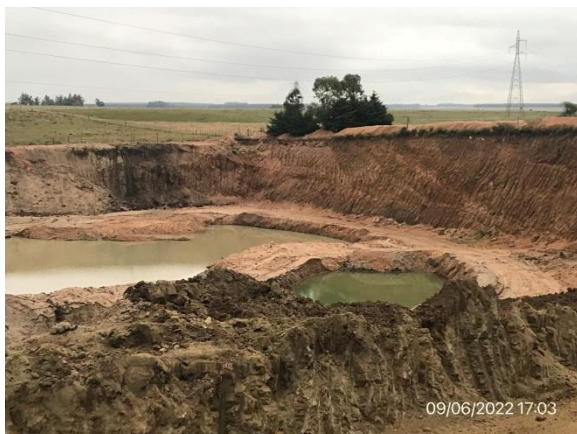
Ilustración 12 – P04, Cantera de tosca. Yacimiento en explotación. Aún no se realizaron tareas de remediación ambiental.