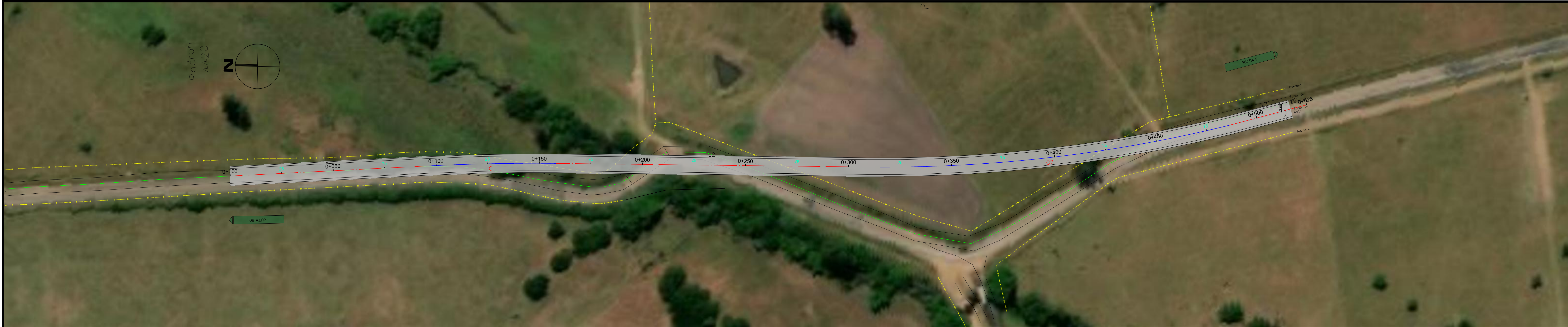
Perfil Longitudinal VARIANTE 3 Tramo 0+000.00 – 0+516.97