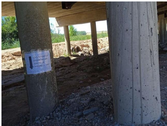
Ilustración 18 – P02, Puente sobre A° Abrojal. Delimitación de máxima creciente.