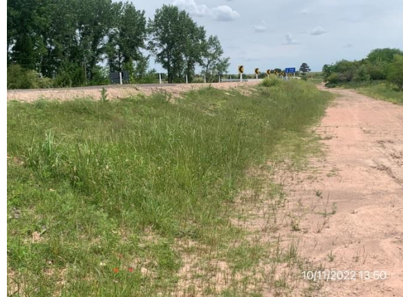
Ilustración 5 – P02, Puente sobre A° Abrojal. Faja pública en accesos con empastado en crecimiento.