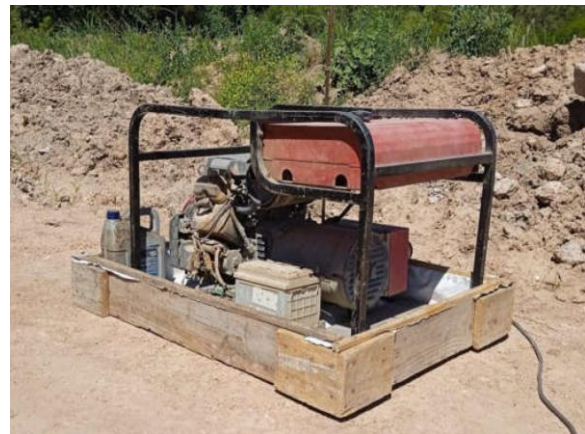
Ilustración 19 – P02, puente sobre A° Abrojal. Grupo electrógeno con bandeja estructura de contención de derrames de combustible.