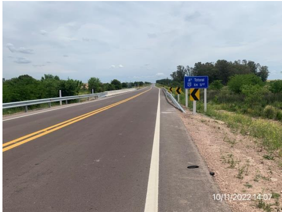
Ilustración 10 – P01, Puente sobre A° Totoral. Obra terminada y abierta al tránsito.