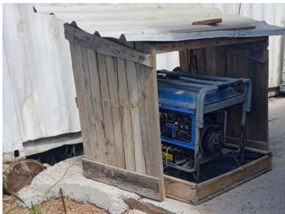
Ilustración 20 – P02, Obrador provisorio en puente sobre A° Abrojal. Grupo electrógeno con bandeja estructura de contención de derrames de combustible.