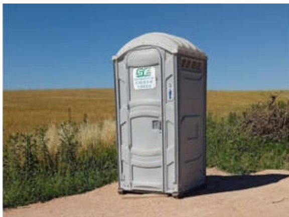
Ilustración 14 – P01, Puente sobre A° Totoral. Baño químico instalado.