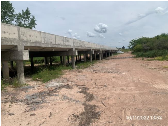
Ilustración 6 – P02, Puente sobre A° Abrojal. Tareas terminadas de recredido de tablero y vigas dintel y construcción de nuevos pilares.