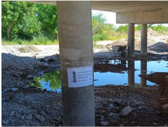
Ilustración 16 – P01, Puente sobre A° Totoral. Delimitación de máxima creciente.