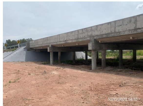
Ilustración 13 – P01, Puente sobre A° Totoral. Zona de campamento provisorio restaurada.