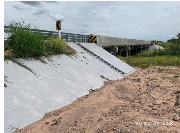
Ilustración 11 – P01, Puente sobre A° Totoral. Planicie de inundación restaurada y libre de ROCs u otros residuos.