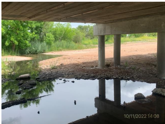
Ilustración 12 – P01, Puente sobre A° Totoral. Curso de agua limpio y sin rastros de obra civil o ataguías.