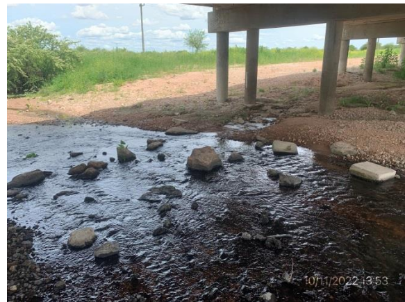
Ilustración 7 – P02, Puente sobre A° Abrojal. Curso de agua limpio y sin rastros de obra civil o ataguías.