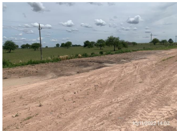
Ilustración 9 – P02, Puente sobre A° Abrojal. Zona restituida de préstamo para ataguía.