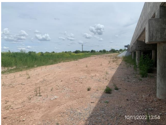
Ilustración 8 – P02, Puente sobre A° Abrojal. Zona de campamento desmontado limpia y libre de infraestructuras provisionarias.