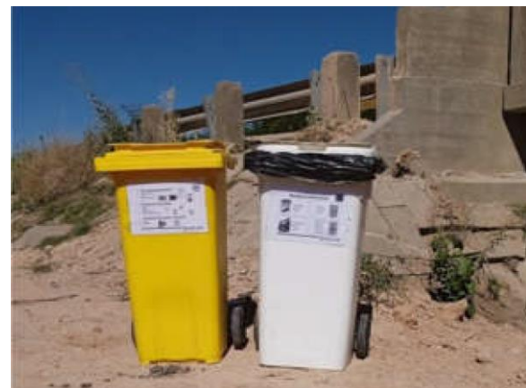
Ilustración 15 – P01, Puente sobre A° Totoral. Estación para acopio de residuos según corriente de generación.