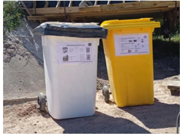
Ilustración 17 – P02, Puente sobre A° Abrojal. Estación para acopio de residuos según corriente de generación.