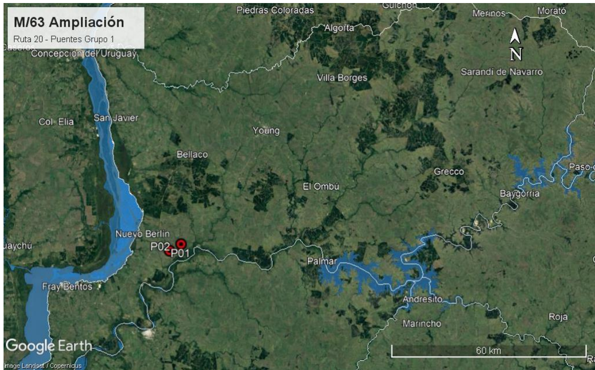
Ilustración 2 - Ubicación del contrato a nivel departamental