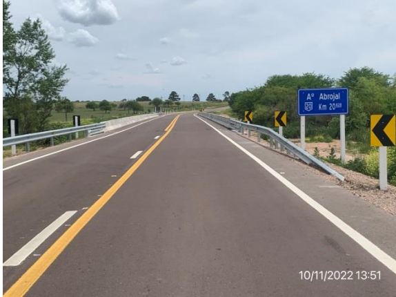
Ilustración 4 – P02, Puente sobre A° Abrojal. Obra terminada y abierta al tránsito.