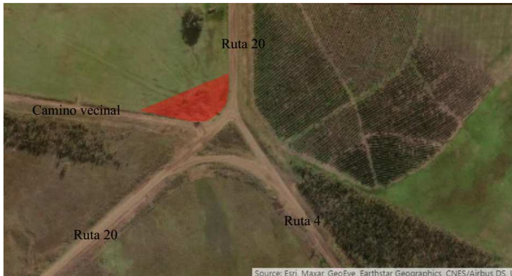
Figura 3 Ubicación de la Planta Asfáltica

En la figura 3 se muestra la ubicación de la misma la que fuera aprobada por la dirección de obra.