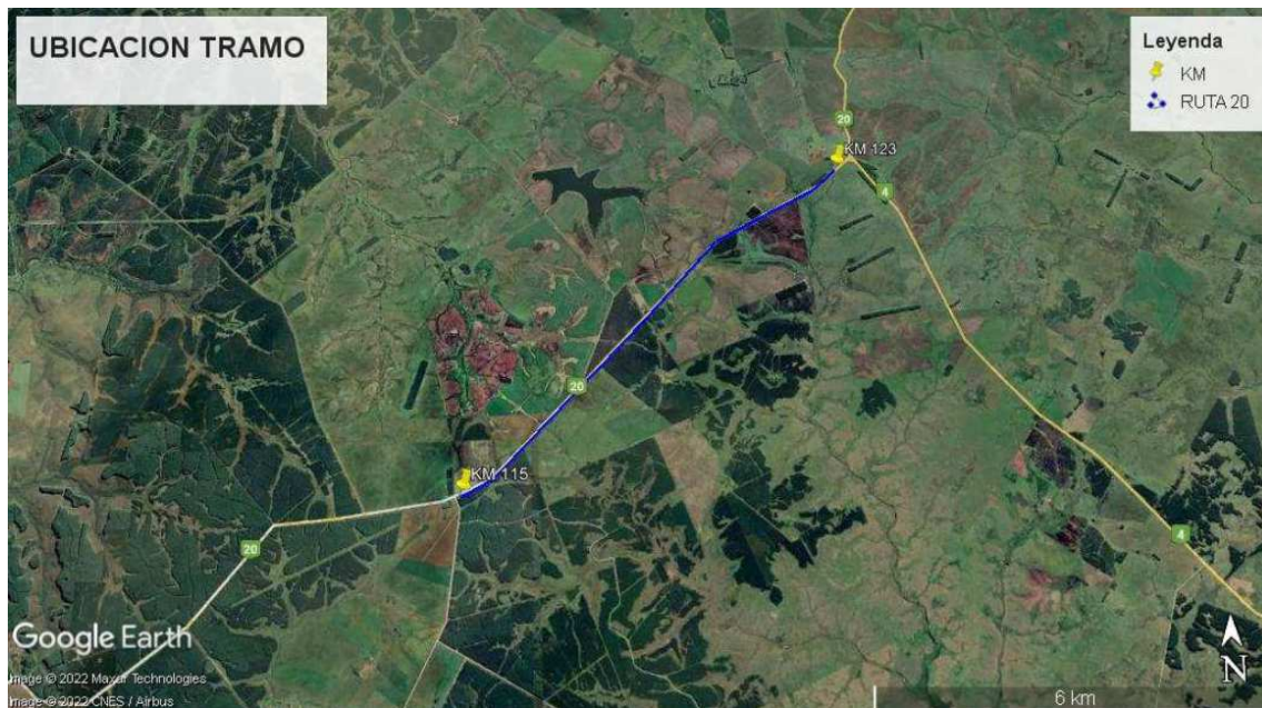
Figura 1: trazado proyectado.

En el marco de la obra Licitación C/133 se plantea una ampliación de contrato que abarca la reconformación de ruta 20 en el tramo 115k500-123k000 según se indica en la figura 1.