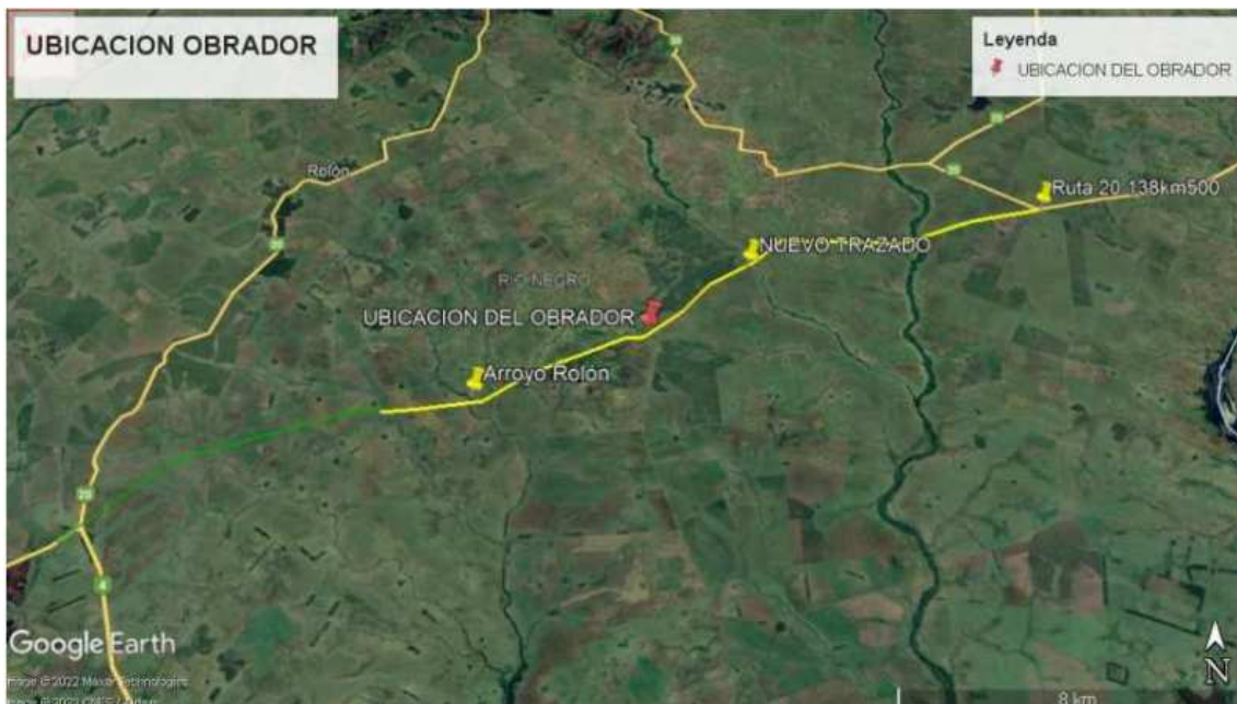
Figura 2. Ubicación obrador, Prog. 15+000

El obrador es el mismo que se viene utilizando para la obra básica de la Licitación C/133, ubicado en las cercanías de la propia obra, en lo que será faja del nuevo trazado, según se indica en figura 2 aproximadamente en la progresiva 15+000. figura 2.