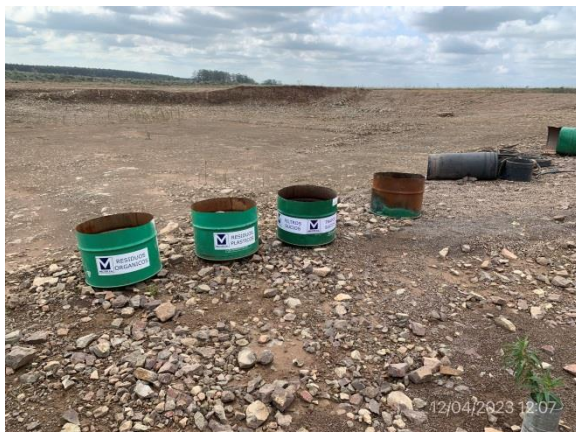
Ilustración 6 – P06, cantera de basalto. Estación para segregación de residuos por corriente de generación.