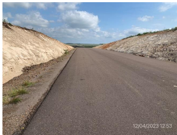
Ilustración 23 – Ruta 20, carpeta asfáltica terminada y banquetas ejecutadas con empastado incipiente.