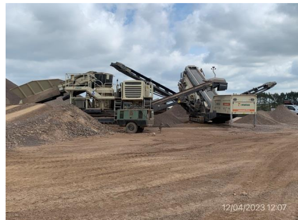
Ilustración 7 – P06, cantera de basalto. Trenes de trituración primaria y secundaria sin actividad.