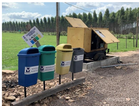
Ilustración 17 – P05, obrador. Estación de acopio de residuos segregado por corriente de generación. Generador eléctrico con contención perimetral.