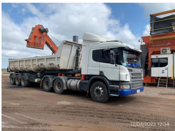
Ilustración 8 – P05, planta asfáltica. Proceso de descarga de mezcla asfáltica en camión con cazamba.