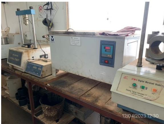
Ilustración 12 – P05, obrador. Laboratorio de suelos y asfaltos.