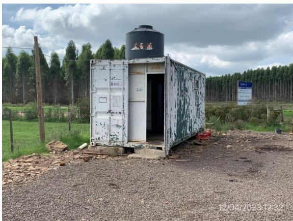
Ilustración 14 – P05, obrador. Baños.