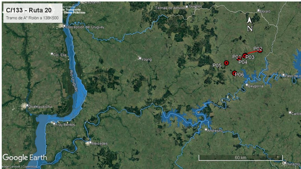
Ilustración 2 - Ubicación del contrato a nivel departamental.