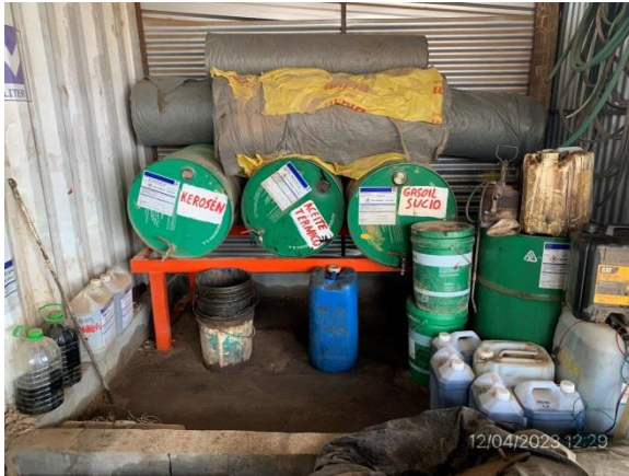
Ilustración 10 – P05, obrador. Depósito de lubricantes en local cerrado y vallado.