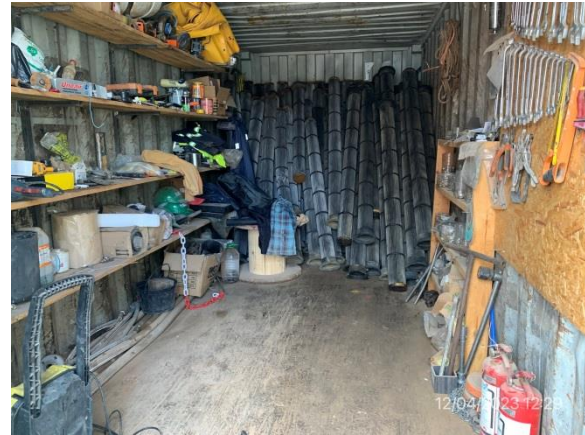
Ilustración 11 – P05, obrador. Pañol cerrado con depósito vallado para acopio de lubricantes usados.