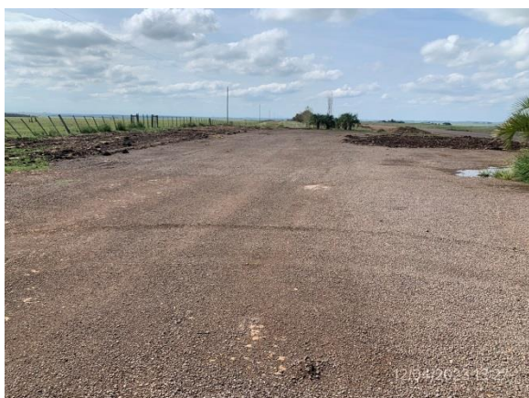
Ilustración 20 – P03, campamento provisorio desmontado. Faja pública de nueva traza de Ruta 20, progresiva 136K800 a (-).