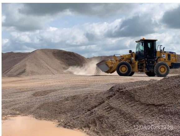
Ilustración 16 – P05, obrador. Explanada de acopio de áridos