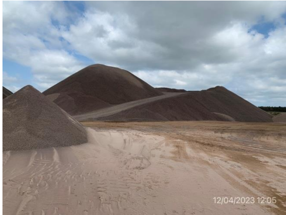
Ilustración 4 – P06, cantera de basalto. Acopio de material triturado.