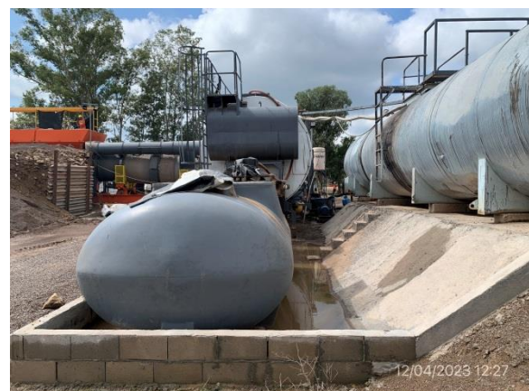
Ilustración 9 – P05, planta asfáltica. Vallado de tarrinas de emulsión correcto