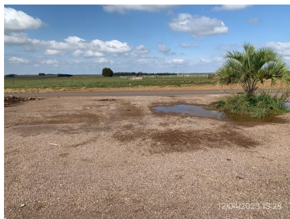
Ilustración 21 – P03, campamento provisorio desmontado, libre de ROCs u otros residuos.