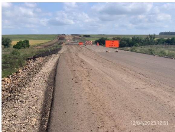
Ilustración 22 – P01, inicio de tramo. Límite con accesos a puente sobre A° Rolón.