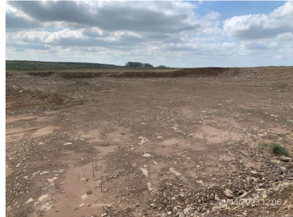
Ilustración 5 – P06, cantera de basalto. Piso de yacimiento.