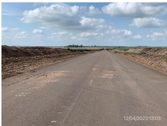
Ilustración 24 – Ruta 20, carpeta asfáltica terminada y banquetas sin ejecutar.