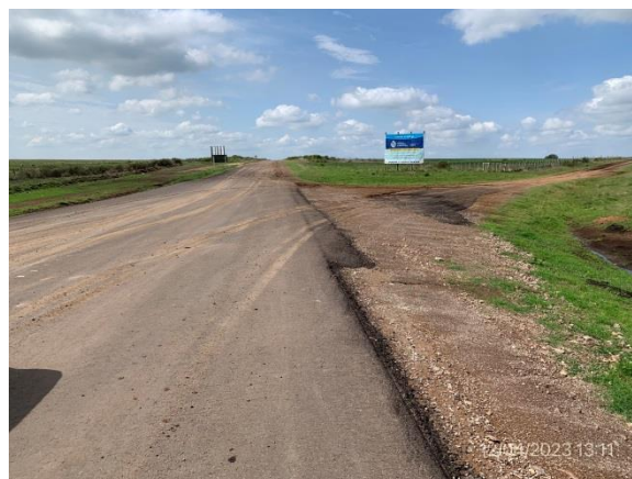
Ilustración 25 – P02, Fin de tramo, Ruta 20 progresiva 138K500.