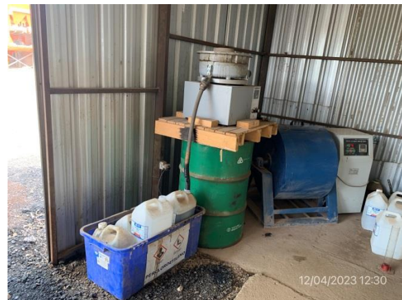
Ilustración 13 – P05, obrador. Depósito de perclorileno usado con doble contención plástica