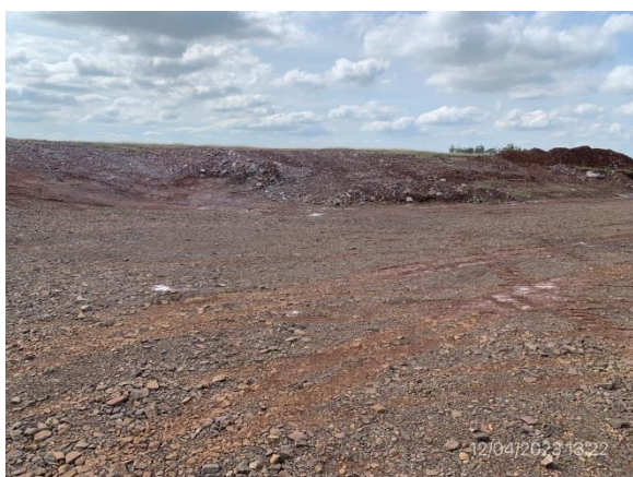
Ilustración 18 – P04, cantera de tosca con explotación detenida. Piso de cantera con taludes suavizados