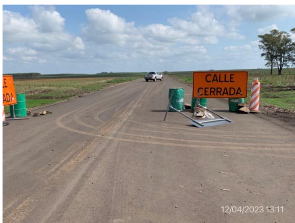
Ilustración 26 – P02, Fin de tramo, Ruta 20 progresiva 138K500.