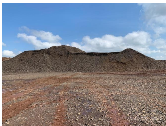
Ilustración 19 – P04, cantera de tosca. Acopio de material excavado.