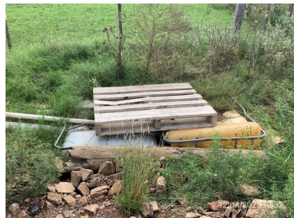
Ilustración 15 – P05, obrador. Depósito impermeable para aguas servidas.