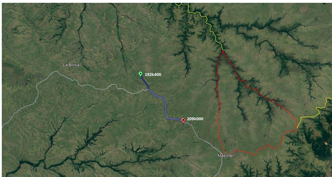
Figura 1: Ubicación de la obra

El presente documento constituye el Plan de Gestión Ambiental (PGA) de Rehabilitación de Ruta 30, tramo 192km400 al 209km000, en el departamento de Artigas, contemplando las pautas y procedimientos concernientes a la gestión ambiental de dicha obra.