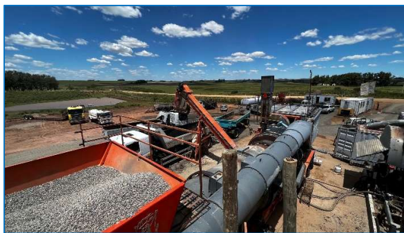
Primeras jornadas de elaboración y tendido de mezcla asfáltica en caliente.