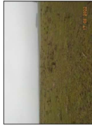
Zona de implantación del obrador.

El predio elegido contará con acceso, playa de estacionamiento y maniobras. Sin perjuicio de la información que se brinde como complemento del PGA y en los ITGA's, se agregan a continuación fotografías del sitio y datos del predio.