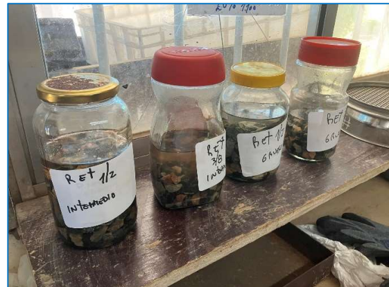
Evaluación de durabilidad de áridos gruesos suministrados por ASTM.