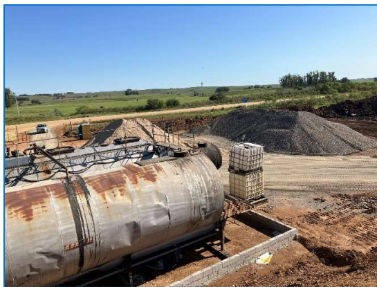
Recinto estanco en tanques de almacenamiento y acopio de áridos gruesos.