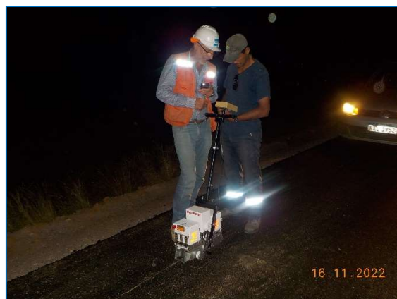
Pavimentación de calzada y evaluación de regularidad superficial.