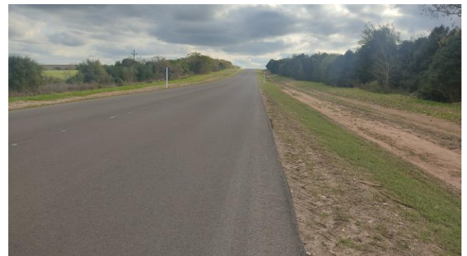
Foto 10.4-1 Vistas del tramo del contrato.