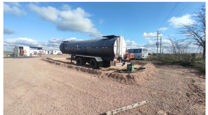
Foto 10.2-1 Vistas Obrador.