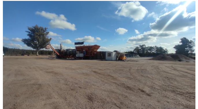
Foto 10.1-1 Vistas Planta de Asfalto.