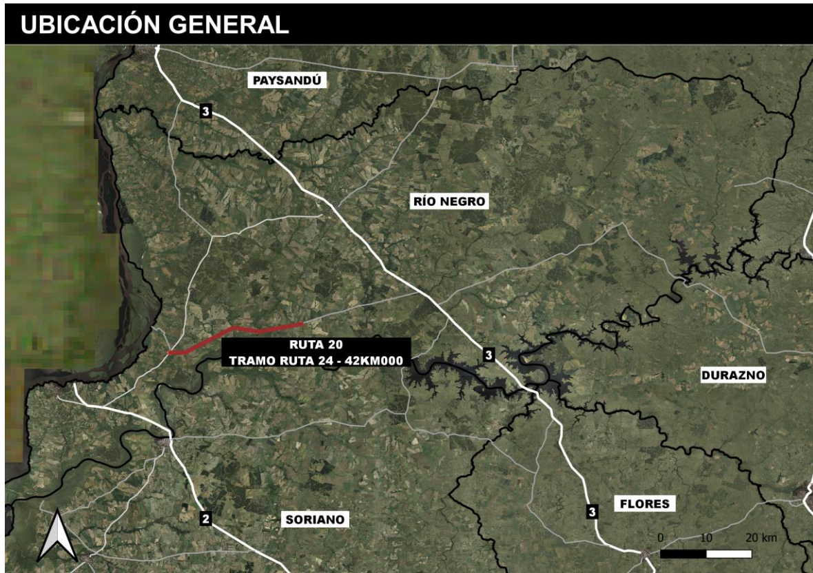
Figura 4-1 Ubicación de la obra