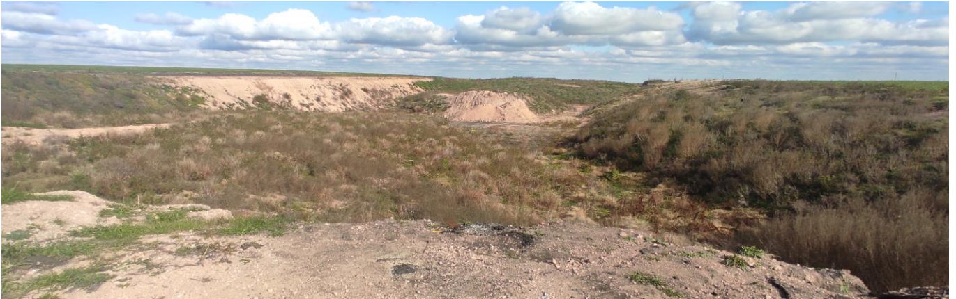
Foto 10.3-1 Vista Cantera Padrón 5947.