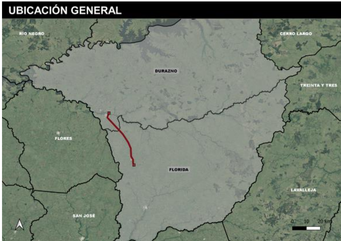
Figura 4-1 Ubicación de la obra