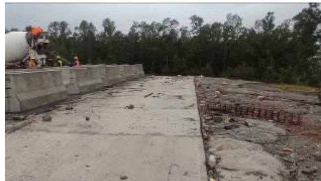
Foto 12.2-2 12.2-3 Explanada acopio - Prefabricados.