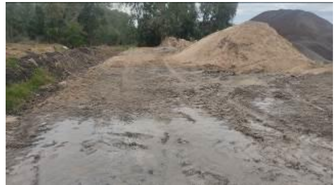
Foto 12.1-1 Zona de elaboración de mezcla con riesgo de erosión.