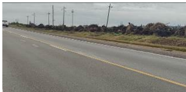
Foto 12.3-1 Vistas del tramo en obra.