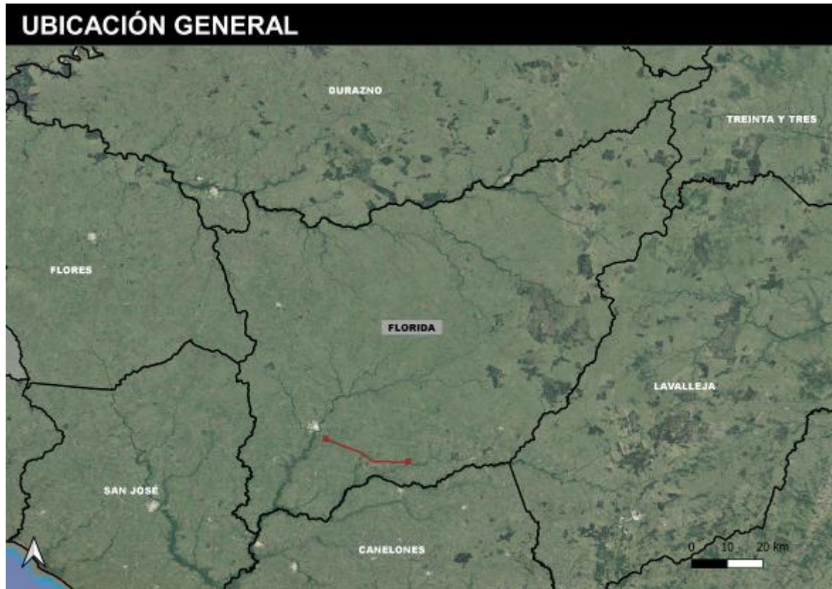
Figura 4-1 Ubicación de la obra.