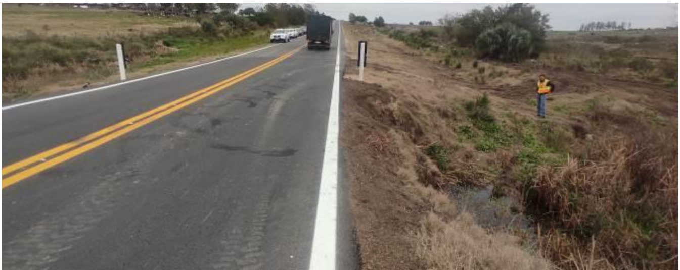
Foto 12.1-1 Vta.2 - Erosión en banquina.