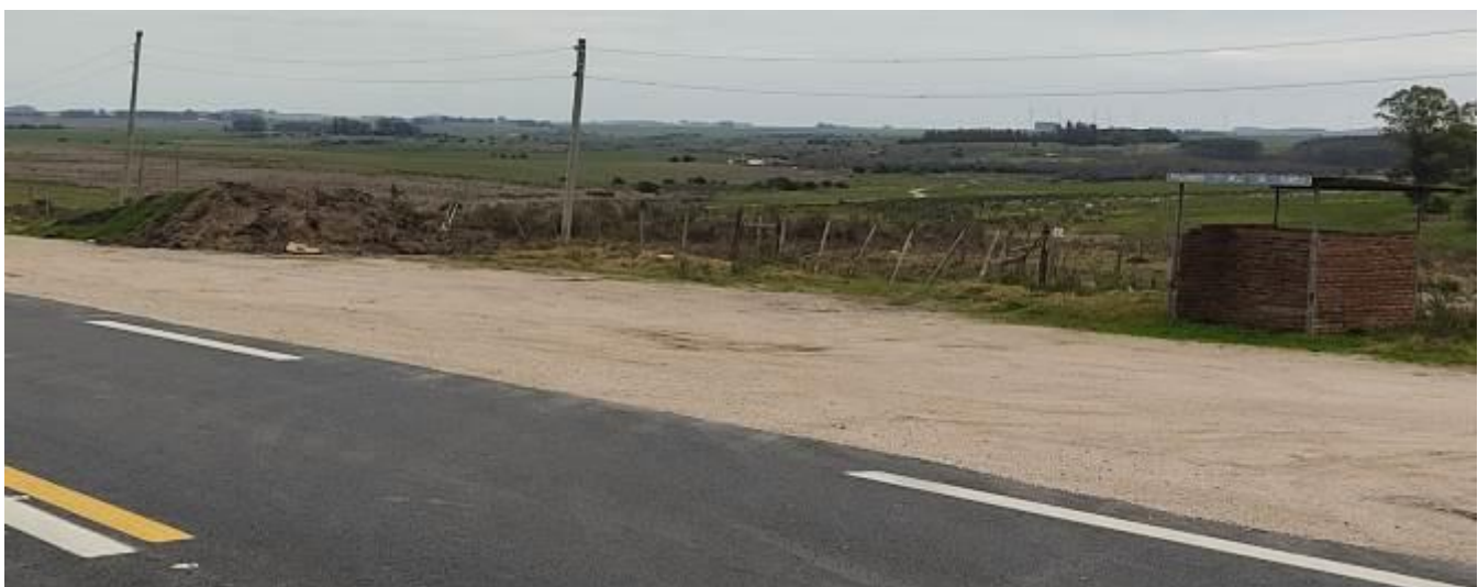
Foto 12.2-1 Vta.1 - Montículo de tierra en faja.