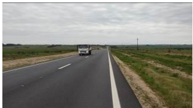
Foto 12.3-1 Vistas del tramo de Ruta 12 terminado.