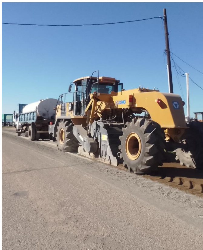
Reciclado con cemento