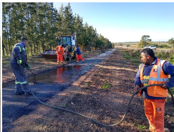
Tratamiento bituminoso doble en sendas peatonales