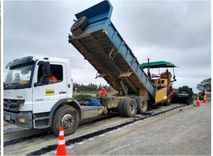
Repavimentación con mezcla asfáltica en caliente