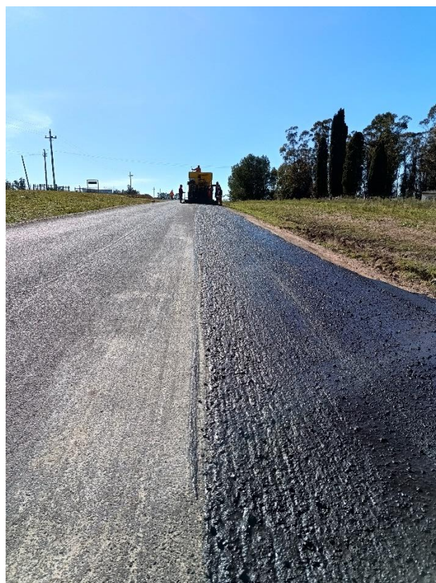
Lechada asfáltica (Slurry Seal)