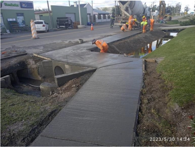
Sendas peatonales de H° en San Bautista