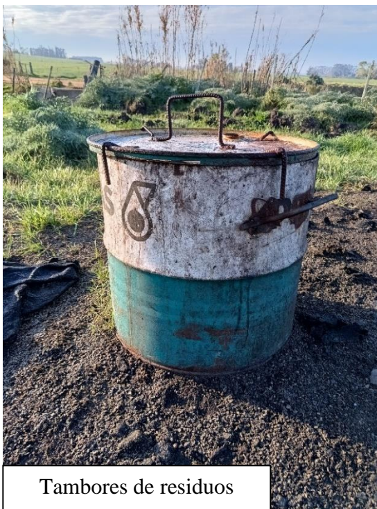
Tambores de residuos