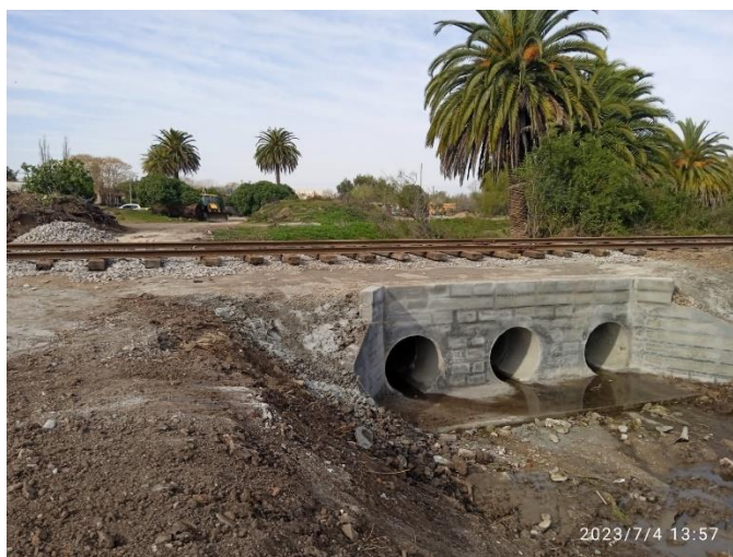
Reconstrucción de alcantarillas