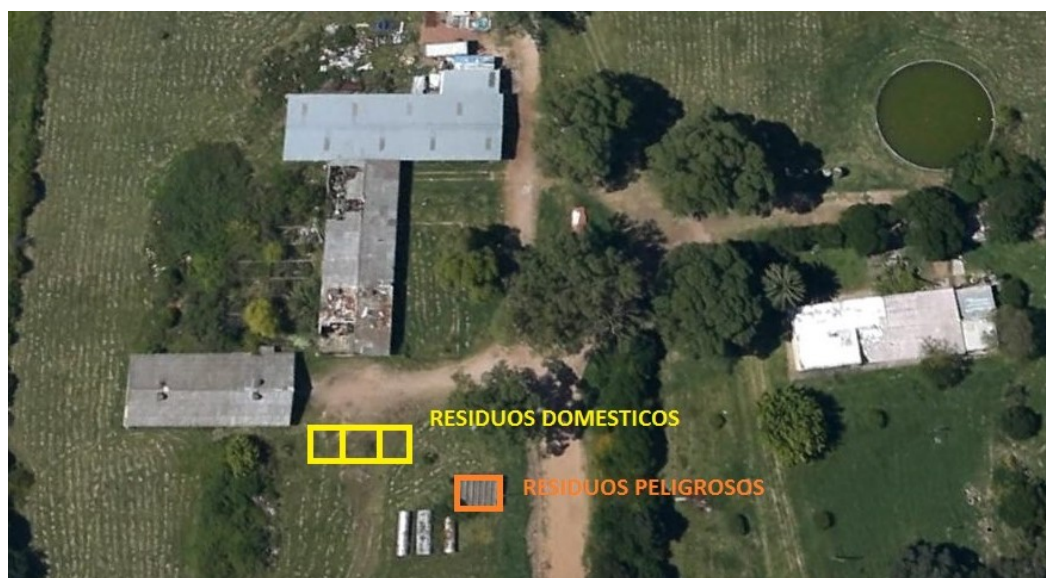
Detalle de ubicación residuos domésticos y peligrosos