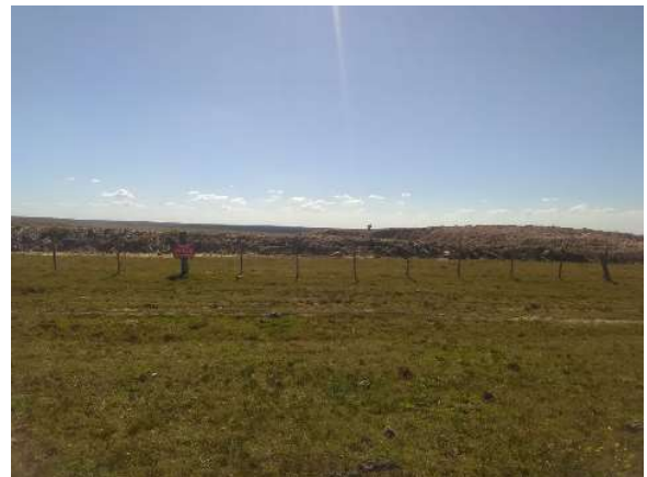
vista general de la cantera clausurada

Dirección: Treinta y Tres 413 – San José, Uruguay Teléfono: (00598) (434) 29371 – (00598) (434) 29003 Fax: (00598) (434) 29763 Email: administracion@serviam.com.uy