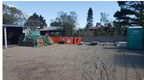
galponcito con señalización y herramientas de mano