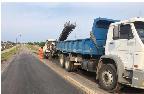
bacheo en calzada

Los frentes de trabajo estuvieron relacionados directamente con las actividades realizadas: mantenimiento (sellado, pintado pavimento, reposición de carteles, reparación de alcantarillas, corte pasto, etc.), bacheo. Como se puede apreciar son todas actividades totalmente habituales del sector vial, cuyos impactos ambientales y medidas de mitigación son bien conocidos y su manejo ambiental está debidamente reguladas en el Manual Ambiental, en el SIG de la empresa y en PGAS del contrato. En lo que respecta a los frentes de trabajo, en éste trimestre no registraron eventos ambientales significativos o imprevistos en el PGAS.