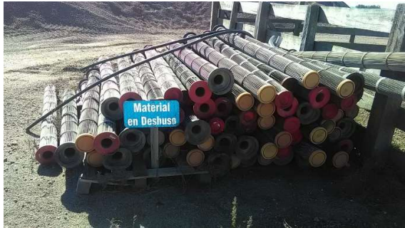
Materiales en desuso en obrador