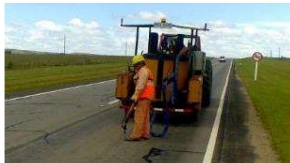
selladora de grietas