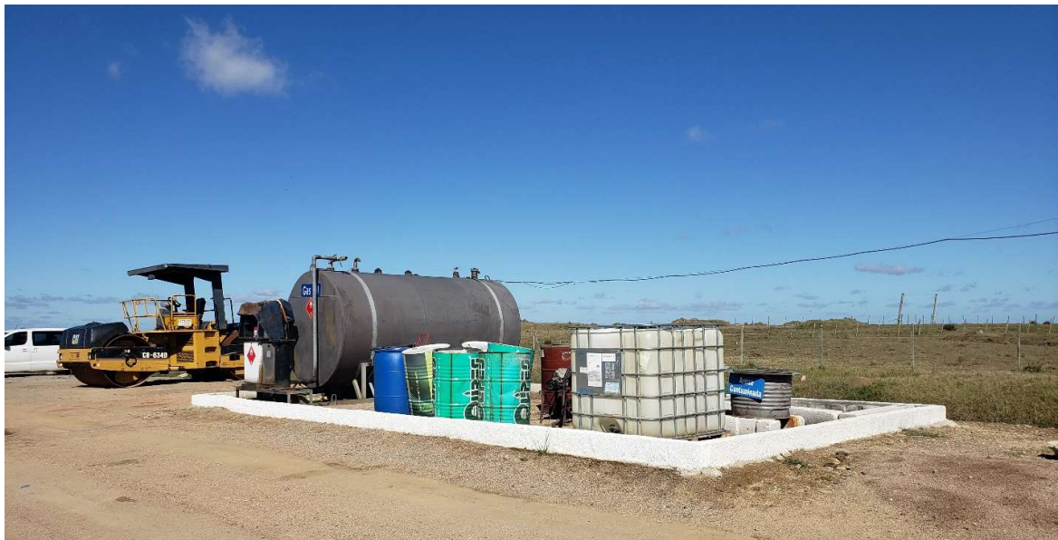
Vista de tanques de gasoil y muro de contención de derrames.

Dirección: Treinta y Tres 413 – San José, Uruguay Teléfono: (00598) (434) 29371 – (00598) (434) 29003 Fax: (00598) (434) 29763 Email: administracion@serviam.com.uy