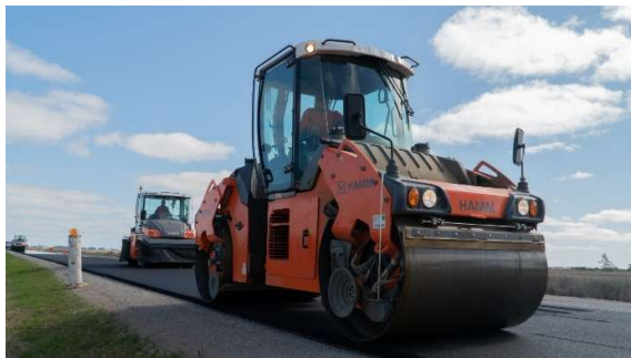
Compactación de mezcla