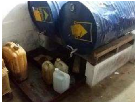
sistema de bandejas con arena para evitar derrames