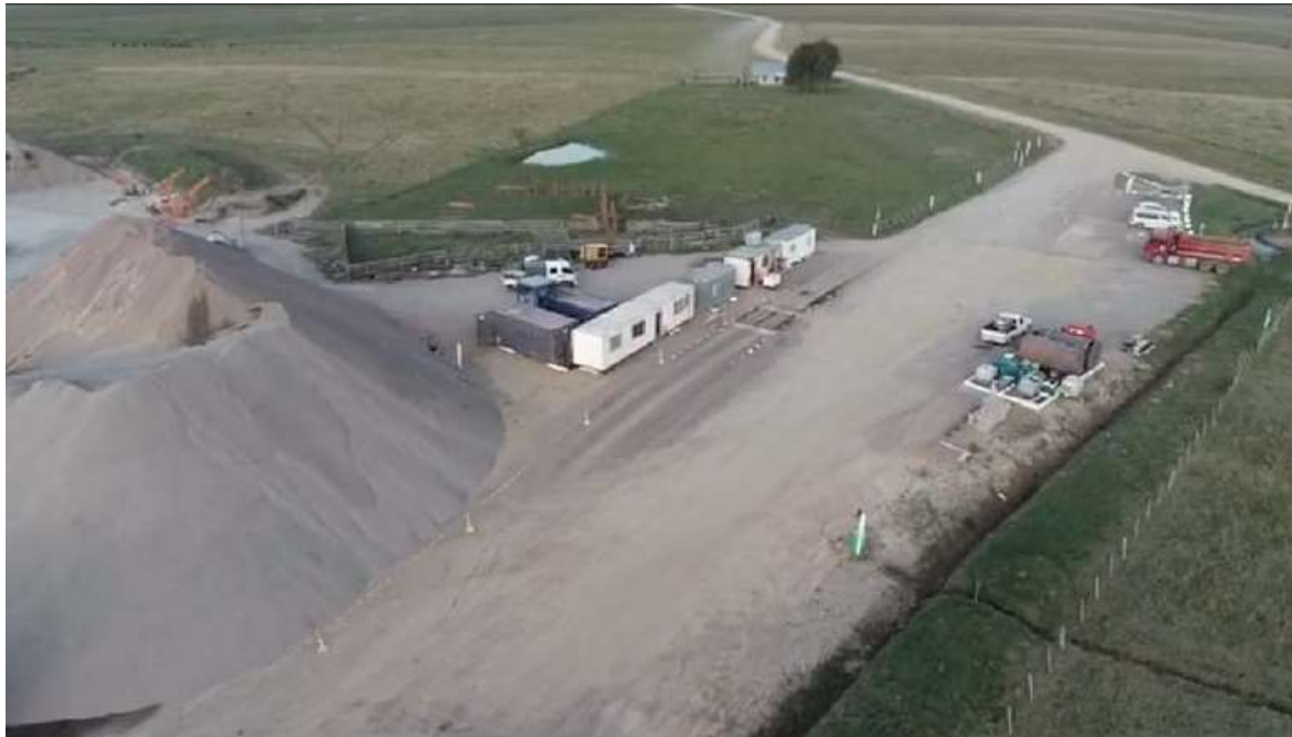
vista general del obrador.