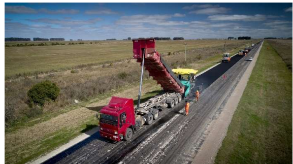
colocación de mezcla