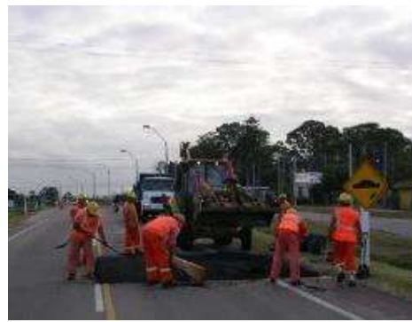
personal trabajando en tareas de pintura y bacheo con sus respectivos uniformes y elementos de seguridad

Dirección: Treinta y Tres 413 – San José, Uruguay Teléfono: (00598) (434) 29371 – (00598) (434) 29003 Fax: (00598) (434) 29763 Email: administracion@serviam.com.uy