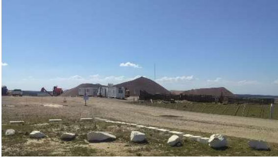
acceso y estacionamiento