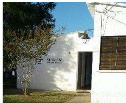
vista exterior de la sede de Vergara