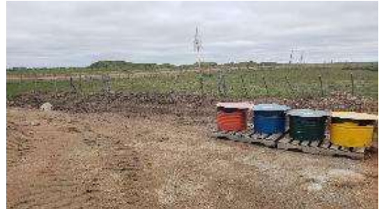
almacenamiento de residuos en obrador

Con los residuos se siguen las medidas contempladas en el SIG de la empresa y el PGAS del contrato. Los residuos se concentran, clasifican y almacenan temporalmente en recipientes debidamente tapados y rotulados, en el depósito de Mariscal y Vergara, y en el obrador. Los residuos del tipo domésticos son trasladados a los vertederos municipales de Mariscal y Vergara, para lo cual se gestionó autorización (no se dispone de registros por la falta de personal en el mencionado predio). Los residuos especiales son trasladados al depósito central de la