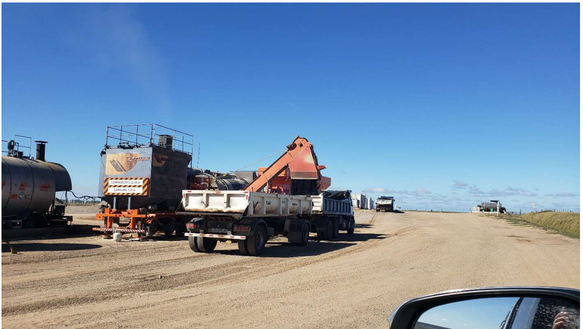
vista general de la planta asfáltica.

Dirección: Treinta y Tres 413 – San José, Uruguay Teléfono: (00598) (434) 29371 – (00598) (434) 29003 Fax: (00598) (434) 29763 Email: administracion@serviam.com.uy