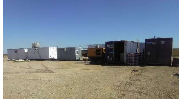
oficinas, depósitos, laboratorio