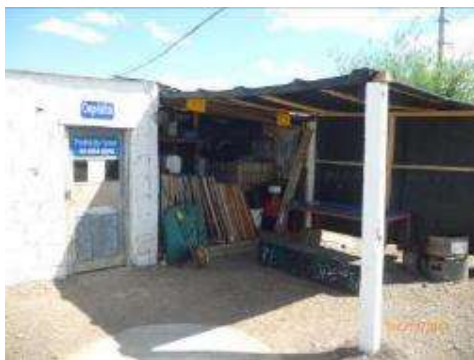
vista exterior de la sede de Mariscal

La empresa se encuentra instalada en las localidades de Mariscal y Vergara, donde se cuenta con * una sencilla oficina administrativa encargada de los pedidos de insumos al depósito central de la empresa, la gestión de los partes de equipos, elementos de seguridad del personal, tareas y otros documentos del SGI, así como de * un pequeño depósito de herramientas, señalización de obra, repuestos, insumos, etc.. En dichas instalaciones no se fabrican materiales de construcción, ni se tiene un taller mecánico, por lo cual no tiene el carácter de obrador. Desde estos puntos salen diariamente las cuadrillas de mantenimiento. En lo que respecta a las sedes, en éste último trimestre no registraron eventos ambientales significativos.