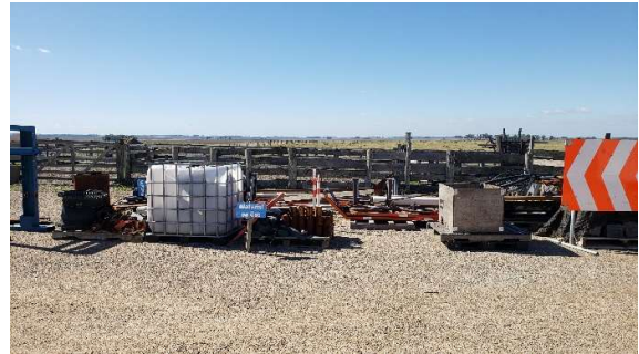
Materiales en uso en el obrador