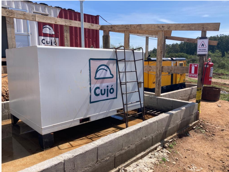
Imagen N°6: Recinto de combustibles y productos químicos y bandeja para generador.