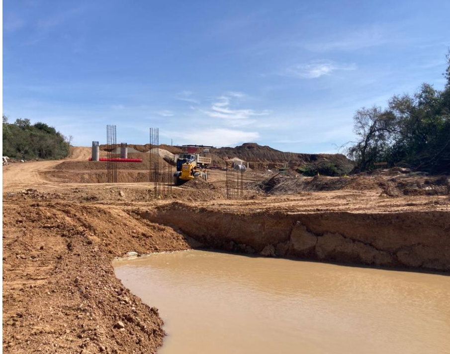
Imagen N°9 y 10: Bases de fundación.