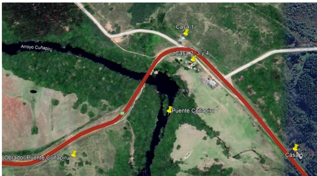
Imagen N°6: Ubicación de los vecinos más cercanos.