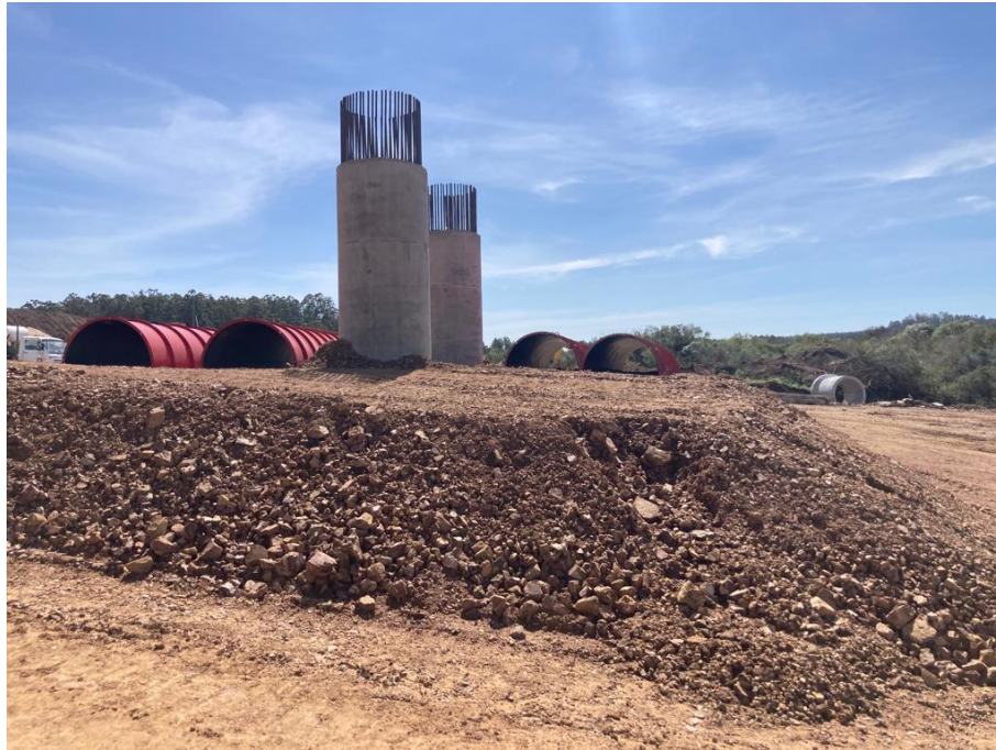
Imagen N°8: Pilares hormigonados.