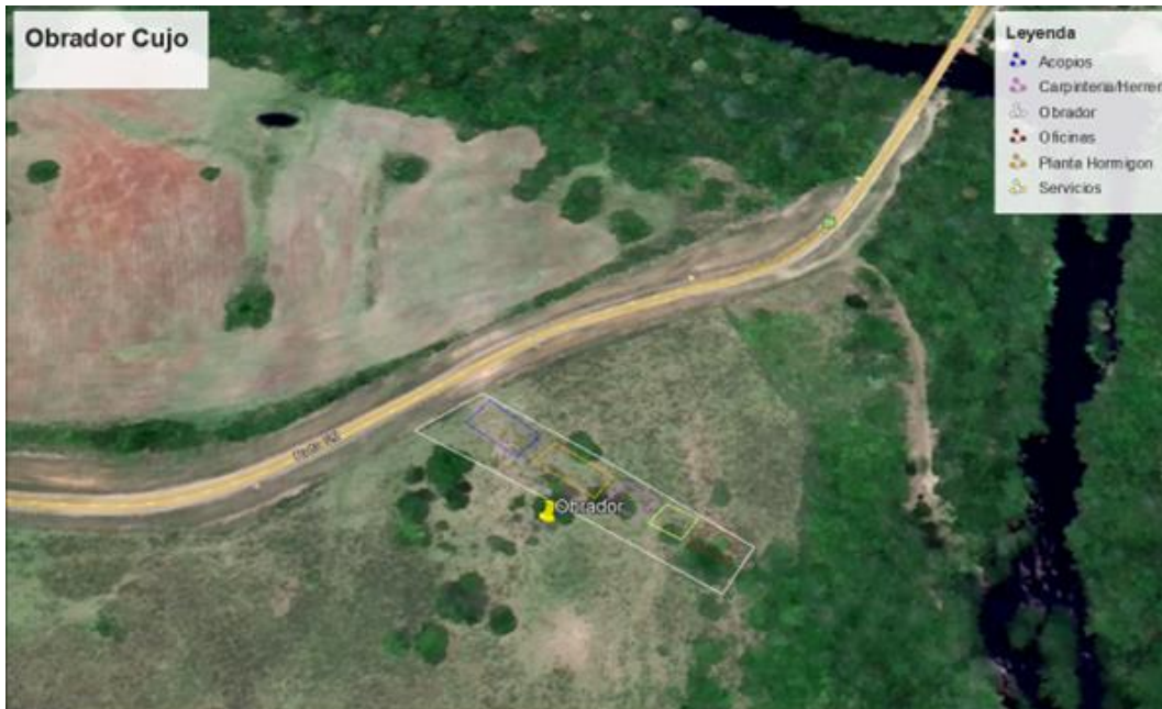
Imagen N°2: Instalaciones del obrador.