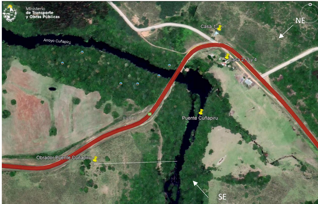
Imagen N°4: Vientos predominantes SE y vientos de invierno NE.

En el presente trimestre en el frente de obra se ejecutaron las tareas de instalación del obrador, atagúa del puente, armado de vigas prefabricadas de hormigón, armado y hormigonado de bases de fundación del puente y de pilas del puente del lado sur.