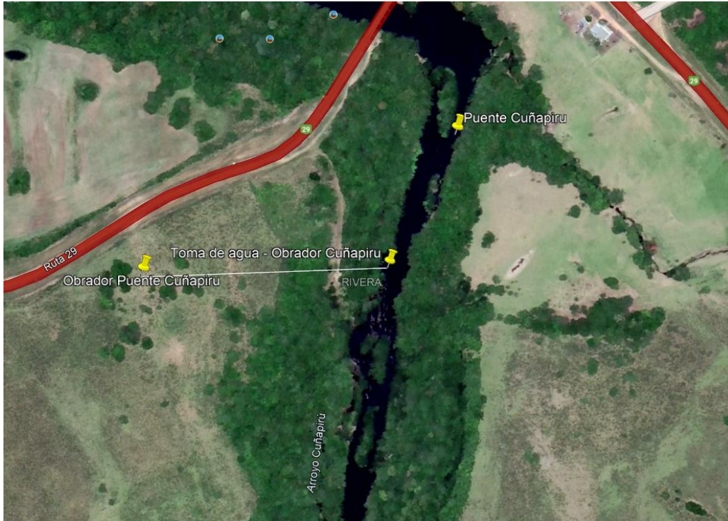
Imagen N°5: Ubicación de la toma de agua.