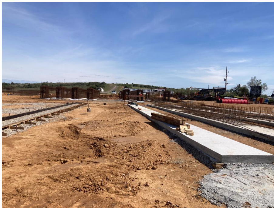
Imagen N°7: Pistas para vigas prefabricadas y armaduras de vigas al fondo.