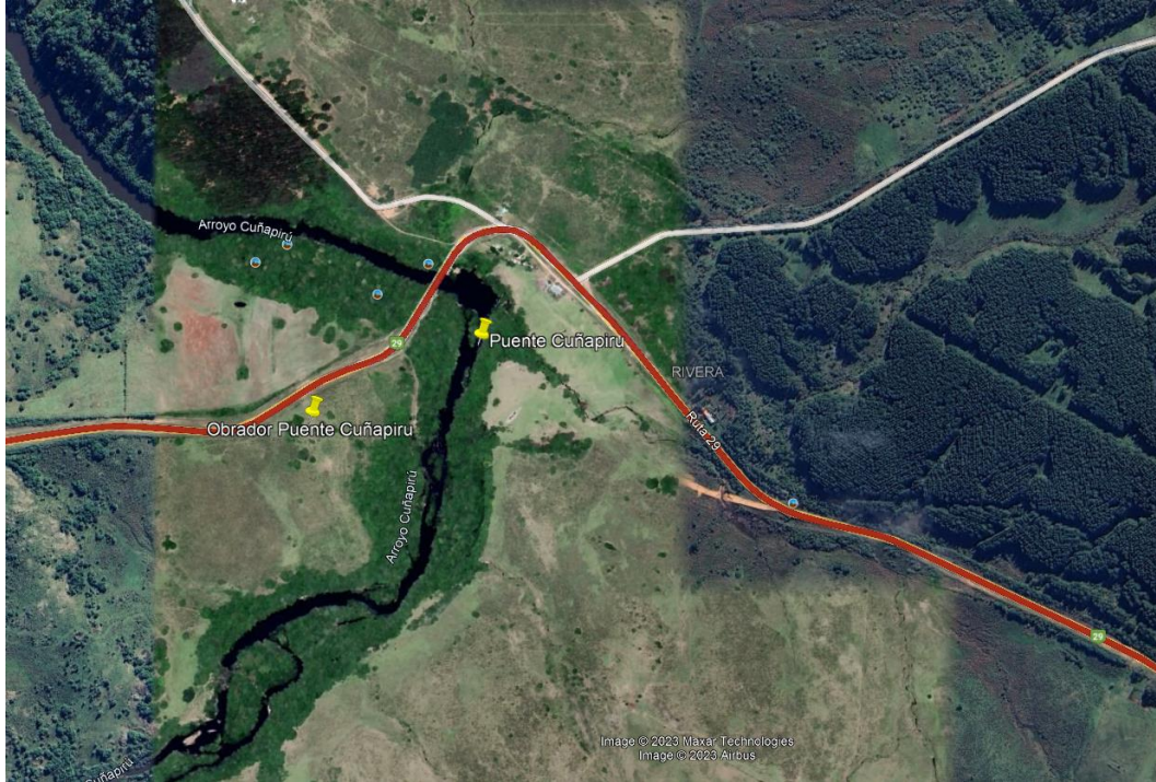
Imagen N°1: Ubicación del obrador.