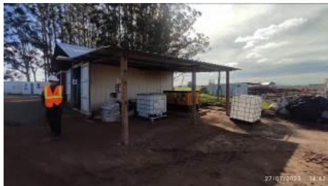
Foto 11.4-1 Obrador MELITER.