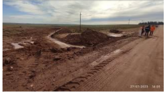
Foto 11.2-2 Canalización de pluviales a predios vecinos.