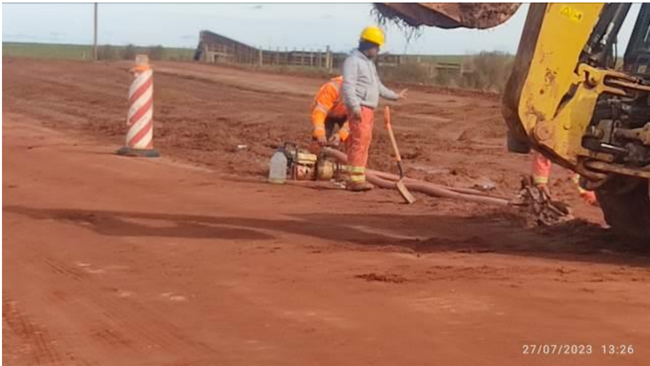
Foto 11.1-1 Tanque de Combustible sin contención.