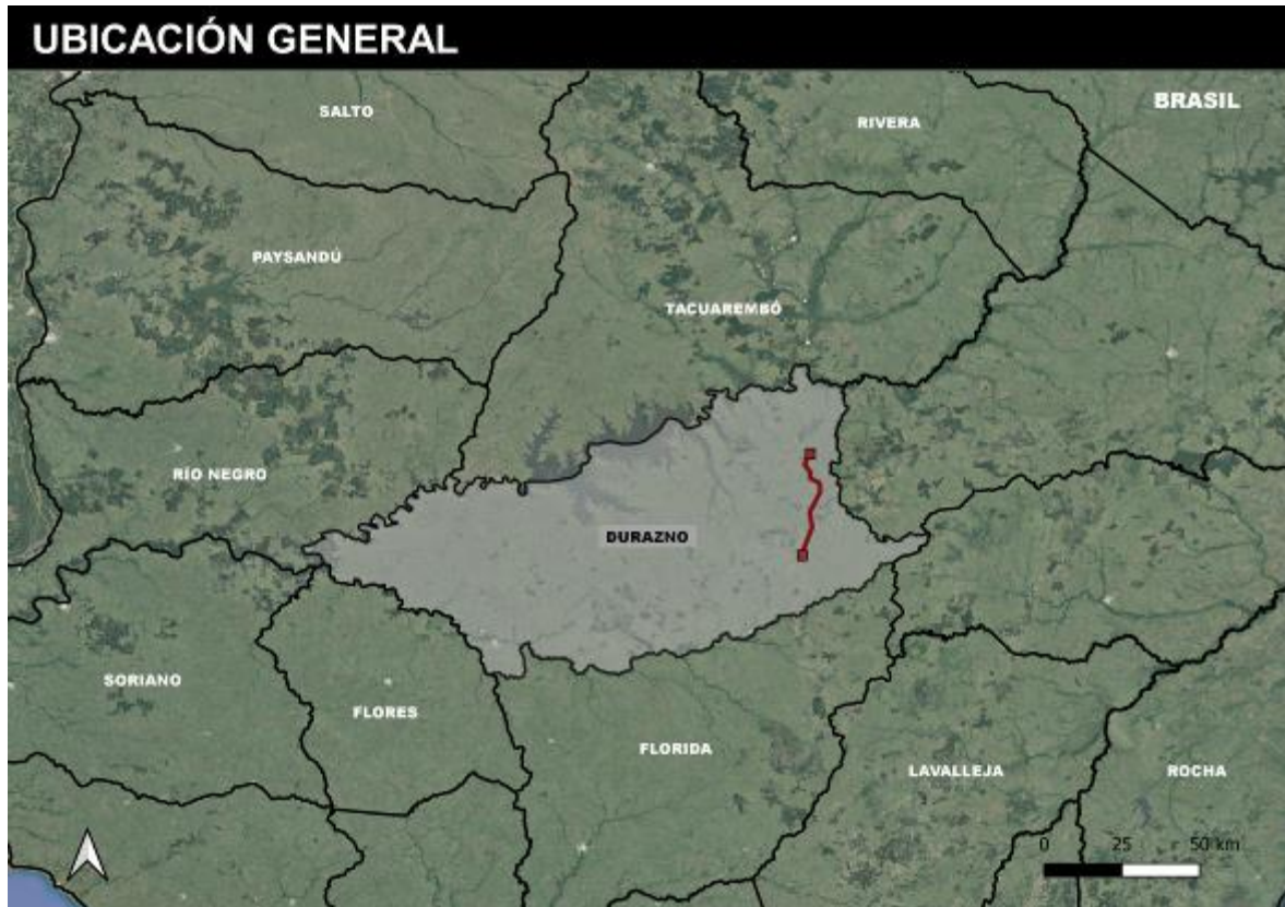
Figura 4-1 Ubicación de la obra