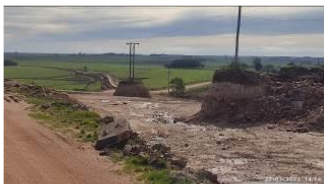
Foto 11.2-1 Vistas del tramo en obra.