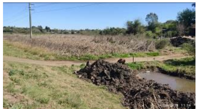
Foto 12.3-1 Vta.2 Regularización de faja (Lat. 31°23'29.35"S, Long. 57°53'34.46"O)