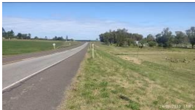
Foto 12.5-3 Vistas del estado del mantenimiento de faja en Ruta 3.