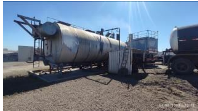
Foto 12.4-1 Vistas del Obrador.