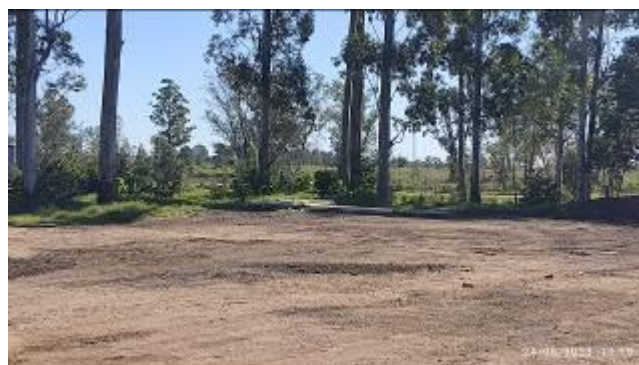
Foto 12.1-1 Vta. 1 Acopios en faja.