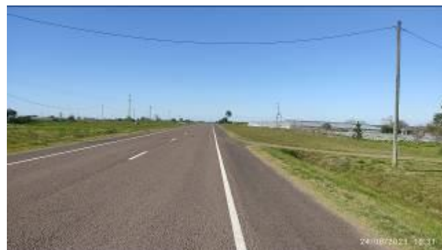
Foto 12.5-1 Ramal de acceso Represa Salto Grande.