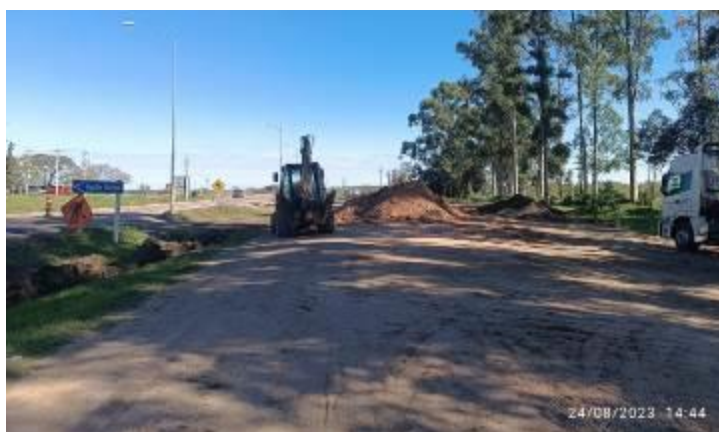
Foto 12.1-2 Inicio de tareas de retiro de acopios, foto enviada por RCA.