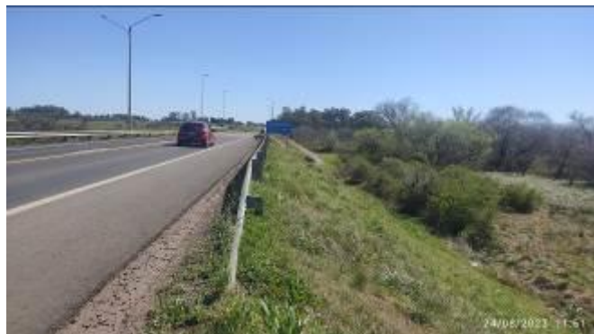
Foto 12.5-2 Entorno Pte. Cañada Doña Jacinta.