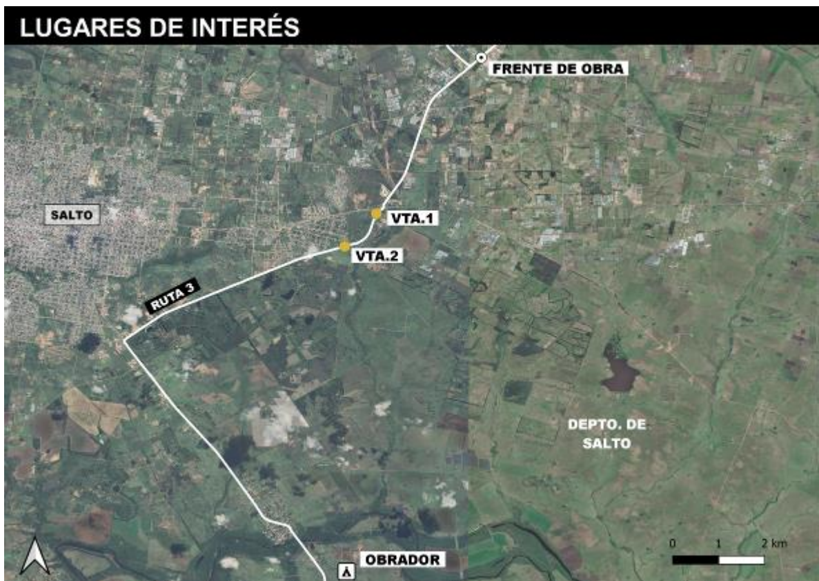
Figura 5-1 Lugares de interés