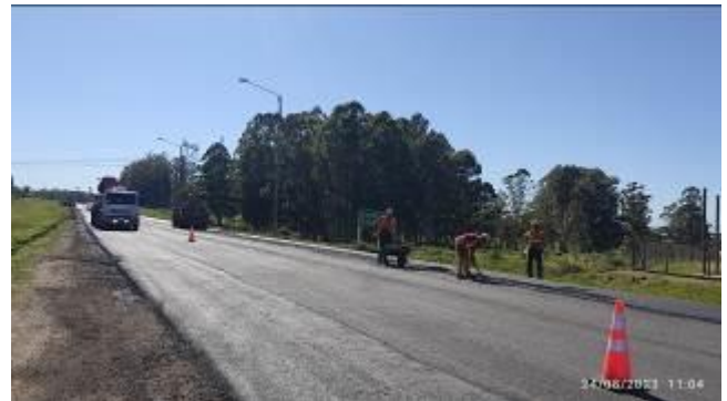
Foto 12.2-1 Frente de Obra