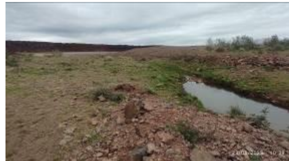
Foto 12.4-1 Cantera Padrón 1531