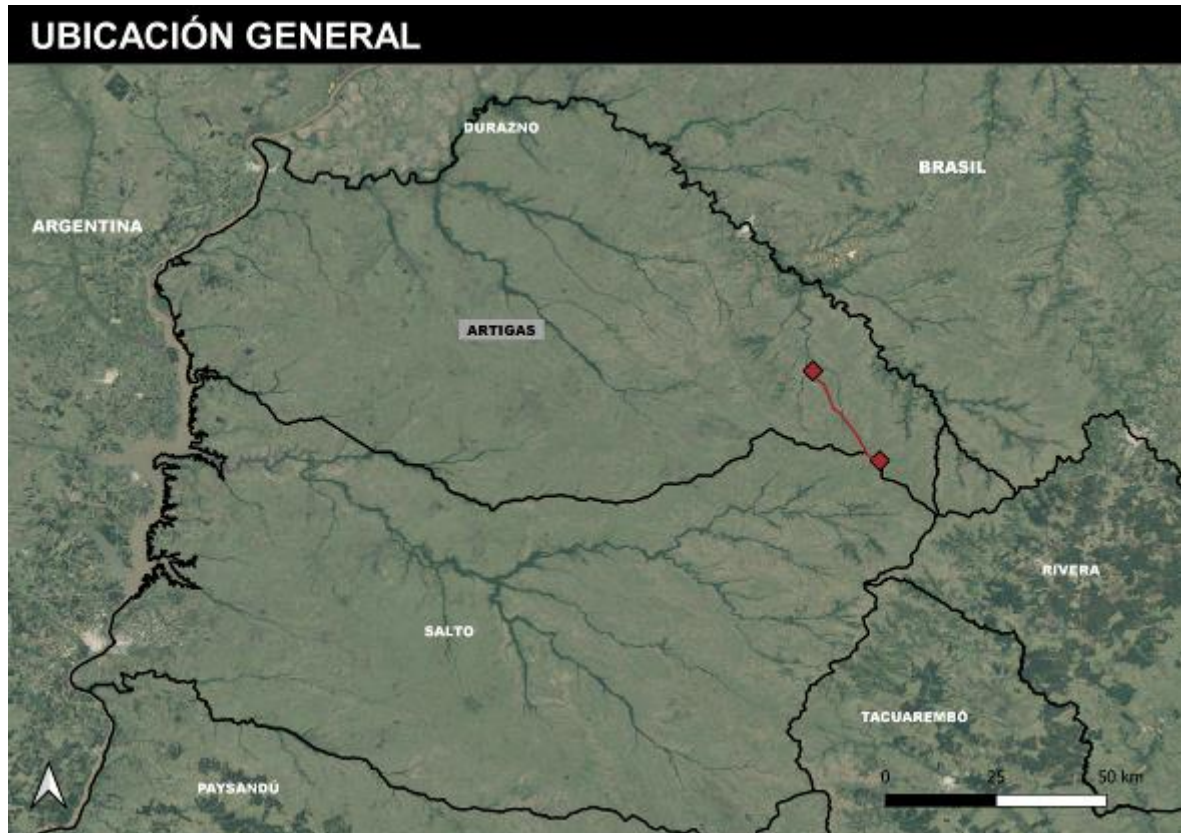
Figura 4-1 Ubicación de la obra