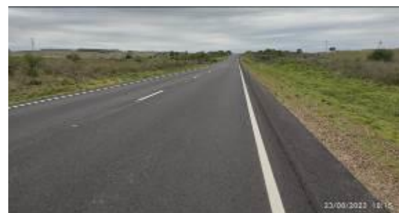
Foto 12.5-1 Vistas de Ruta 30.