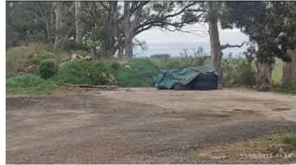
Foto 12.3-1 Vistas Obrador Traxpalco.