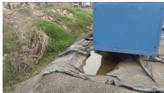
Foto 12.2-1 Dique de generador eléctrico inadecuado.