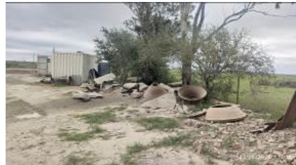
Foto 12.1-1 Materiales sin disposición adecuada.