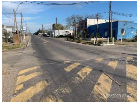
Foto 12.1-4, P02. Fin del tramo en Ruta 12. Progresiva 108K000, planta urbana de Cardona.