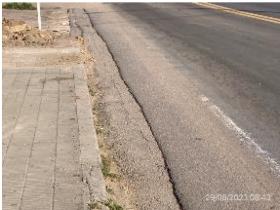
Foto 12.1-3. Obra terminada en Ruta 12. Planta urbana de Cardona