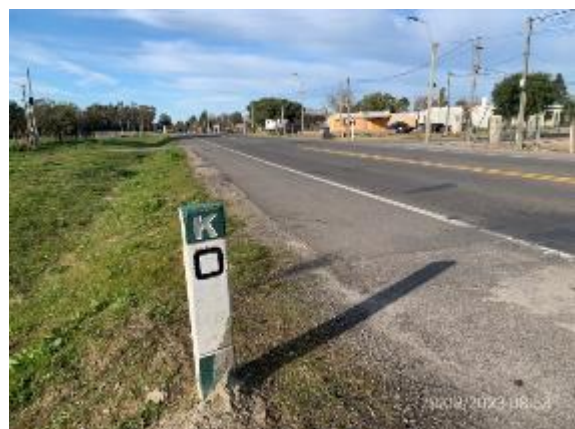
Foto 12.1-5, P03. Inicio del tramo en Ruta 57. Progresiva 0K000, planta urbana de Cardona.