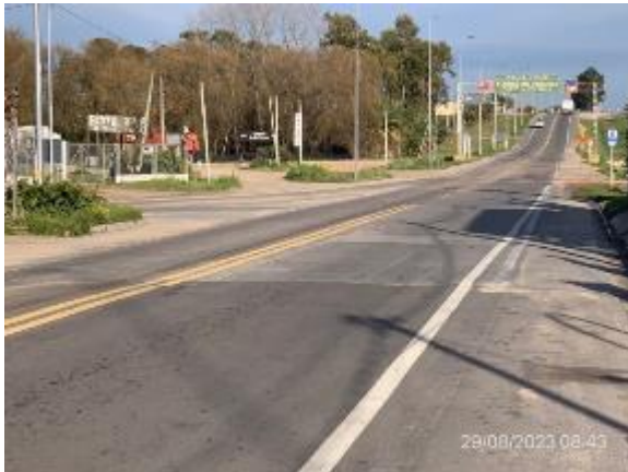
Foto 12.1-1, P01. Inicio del tramo en Ruta 12. Progresiva 107K100, planta urbana de Cardona.