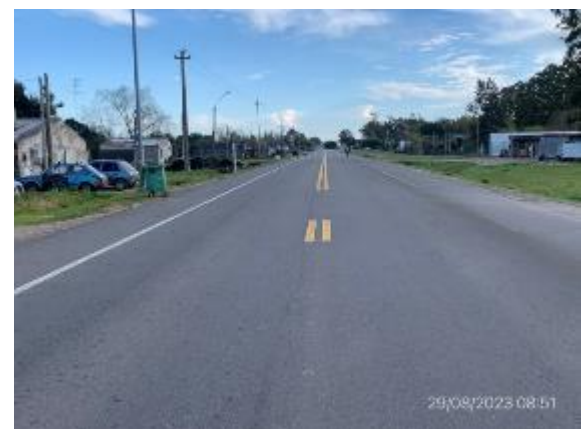
Foto 12.1-6, Obras terminadas en Ruta 57. Planta urbana de Cardona. Carpeta de rodadura ejecutada