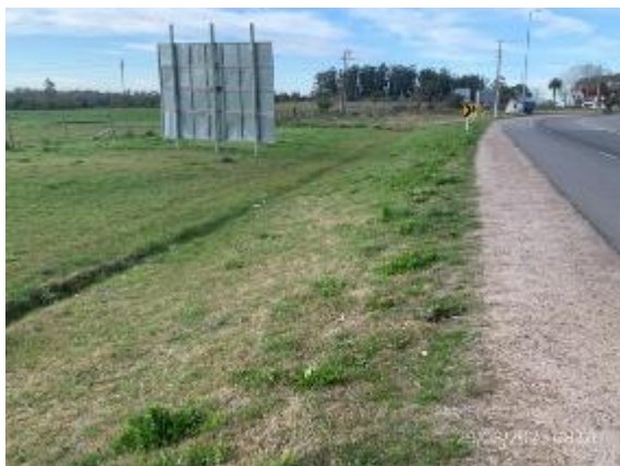
Foto 12.1-7, Obras terminadas en Ruta 57. Empastado de faja vegetal en crecimiento y drenajes reconstruidos.