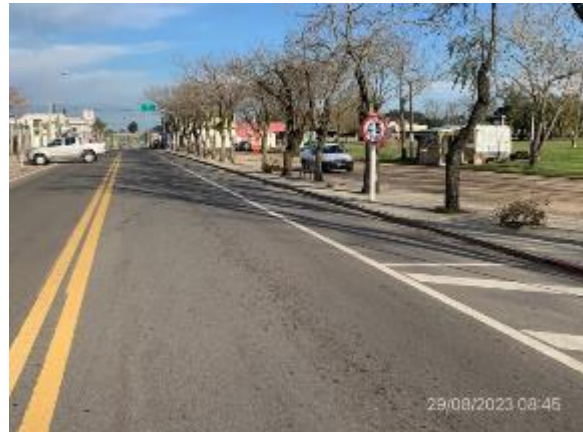
Foto 12.1-2. Obra terminada en Ruta 12. Planta urbana de Cardona.