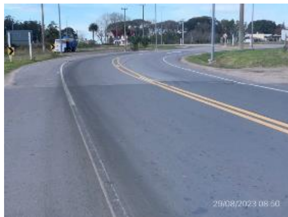
Foto 12.1-8, P04, Fin del tramo en Ruta 57. Progresiva 1K300, planta urbana de Cardona.