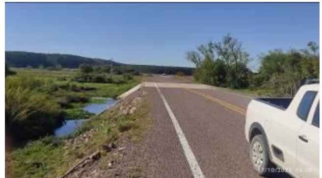
Foto 12.3-1 Vistas del tramo del contrato.