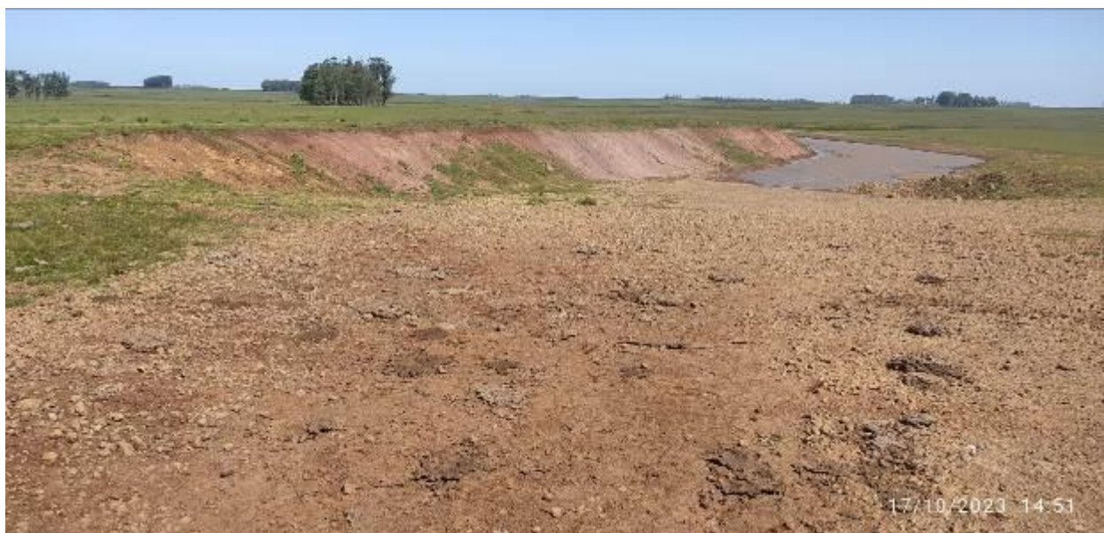
Foto 12.4-1 Predio de la Cantera Padrón 7777.