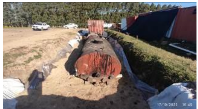
Foto 12.5-1 2 Vistas del Obrador.