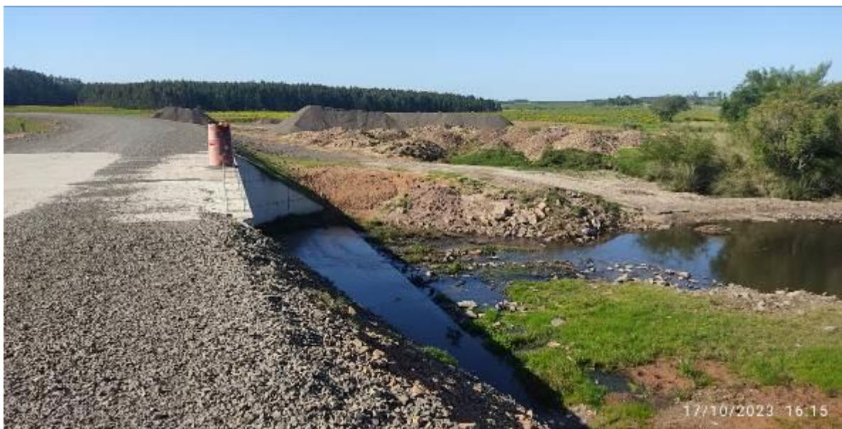
Foto 12.1-1 Acopio en zona con riesgo de inundación.