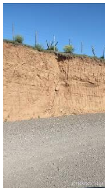
Foto 12.2-1 Erosiones en taludes de faja.