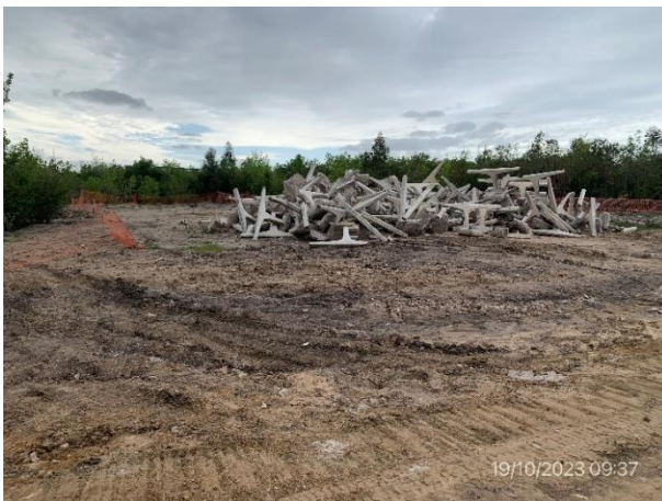
Foto 12.2-9, P01. Sector de planicie de inundación de Aº Santa Lucía chico con monte nativo talado. Se instaló señalización, resta por ejecutar remediación ambiental.