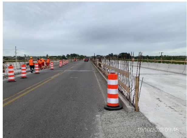
Foto 12.2-6, P01. Puente existente, zona de circulación con señalización de obra correcta.