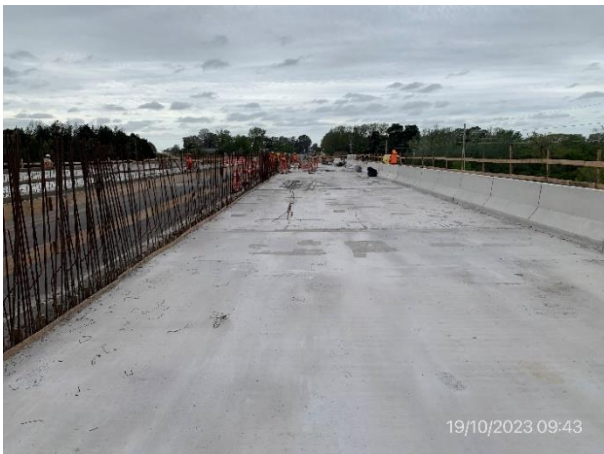
Foto 12.2-5, P01. Zona de tablero superior en puente de senda a (+) en condiciones de ser abierto al tránsito.