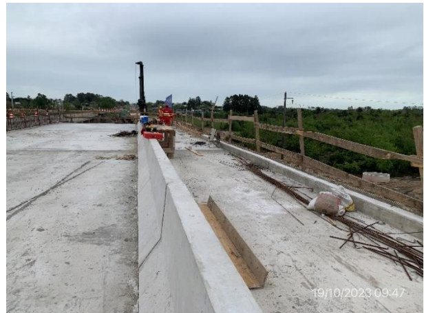
Foto 12.2-4, P01. Obras en tablero superior, zona limpia y ordenada