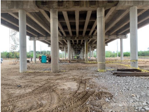
Foto 12.2-1, P01. Nuevo puente sobre A° Santa Lucía Chico. 95K350. Pilares en el lecho del arroyo.