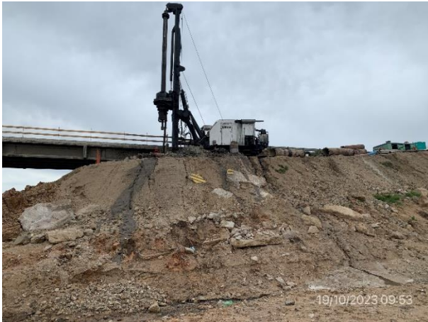
Foto 12.2-7, P01. Frente de obra de subcontratista de pilotaje, Viermond SA