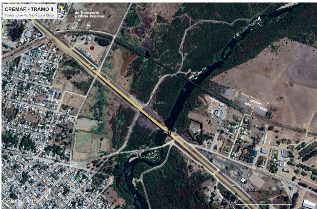
Figura 5-1 Lugares de interés.

Durante la auditoría ambiental se recorrió el puente en obra en Ruta 5 sobre el río Santa Lucía Chico en la progresiva 93K500 y el obrador de Stiler. Se recorrió también el sector de la obra donde estaba trabajando la subcontratista Viermond SA, así como un sector de la planicie de inundación del curso de agua, donde se produjo un hallazgo durante la auditoría anterior a este contrato realizada el 27/03/2023.