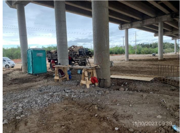
Foto 12.2-2, P01. Campamento móvil en el lecho del curso, no cuenta con infraestructura para acopio y gestión de residuos de forma segregada por canal de generación.