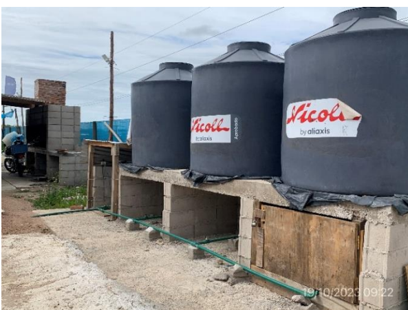
Foto 12.1-5, P02. Tanques de agua, provisión acargo de terceros