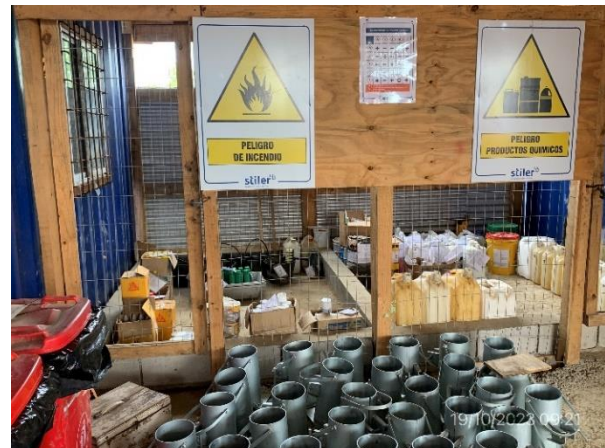
Foto 12.1-4. P02. Sector envuelto con pavimento impermeable para acopio de productos peligrosos.