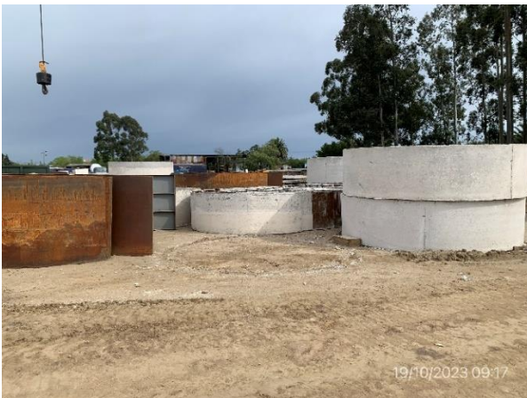
Foto 12.1-3. P02. Sector de acopio de encofrados perdidos