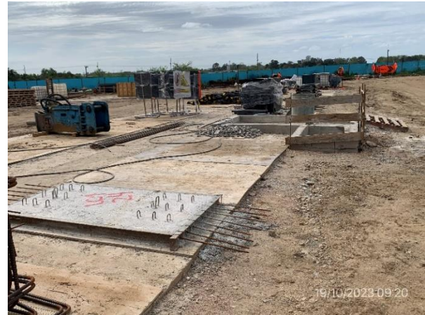
Foto 12.1-2. P02. Sector de prefabricados de hormigón, dotado de pileta de decantación de aguas de lavado.