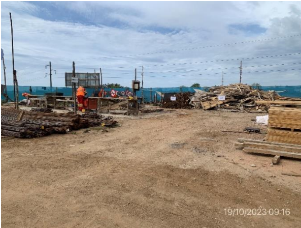
Foto 12.1-1, P02. Obrador de Stiler SA, sector de almacenamiento de armaduras y encofrados