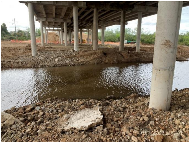
Foto 12.2-3, P01. Curso de agua en buenas condiciones, swin presencia de ROCs.