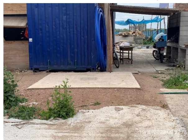
Foto 12.1-6, P02. Depósito impermeable para recolección de aguas servidas.