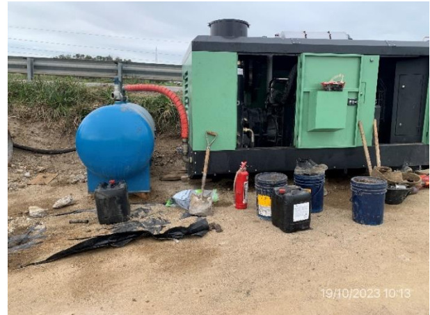
Foto 12.2-8, P01. Campamento provisorio de Viermond SA. no cuenta con infraestructura para acopio transitorio de residuos. Bidones de hidrocarburos están apoyados en suelo desnudo sin contención de prevención de derrames.