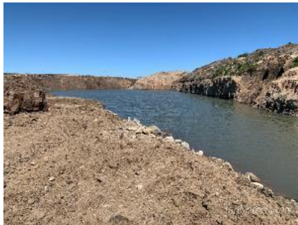
Foto 12.2-2, P09. Cantera de tosca. Frente de explotación terminado, apto para inicio de tareas de recuperación.