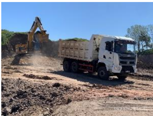
Foto 12.2-3, P09. Cantera de tosca. Instalaciones para gestión ambiental apegada al PGA incompletas, no se dispone de elementos para implementación del PA.CO