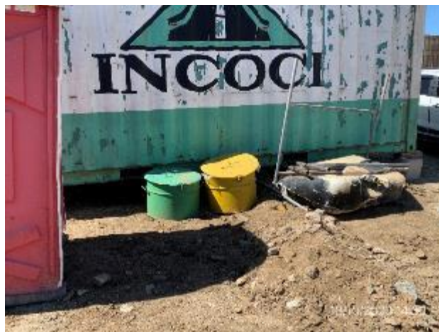
Foto 12.1-12, P08. Campamento móvil de en condiciones correctas.