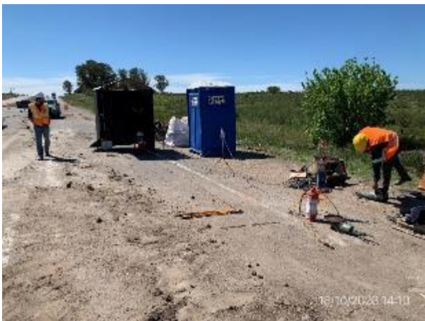
Foto 12.1-7, P06. Campamento precario de subcontratista Suelo Firme SA. No cuenta con infraestructura adecuada para gestión ambiental correcta.