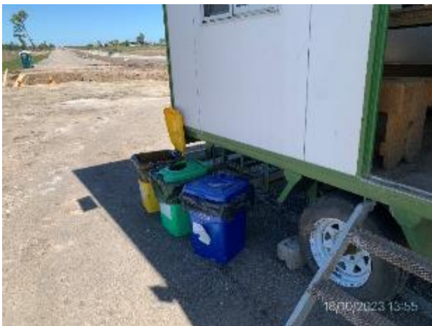
Foto 12.1-3. P04. Campamento móvil con acopio de residuos segregados por corriente de generación.