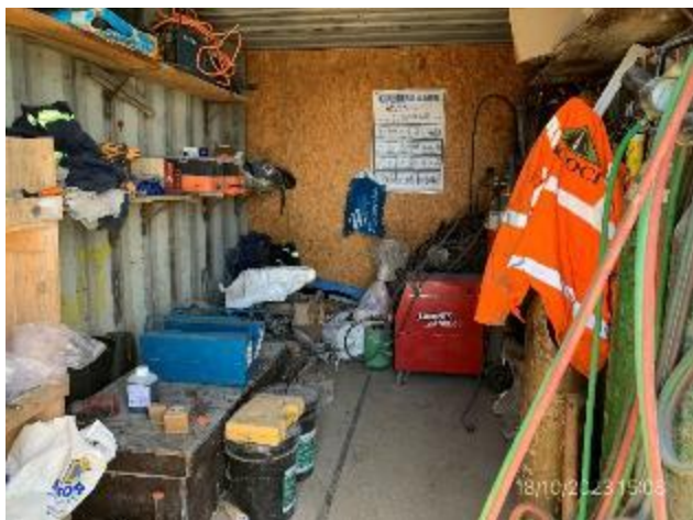
Foto 12.2-7, P10. Cantera de piedra. Pañol cerrado, no se dispone de elementos para implementación del PA.CO