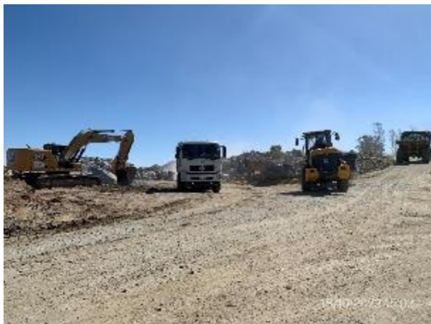
Foto 12.2-5, P10. Cantera de piedra en explotación Padrón N°3874 de la 1ª Sección Catastral de Florida.