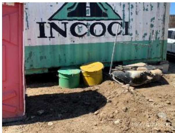
Foto 12.2-4, P09. Cantera de tosca. Instalaciones adecuadas para gestión de residuos de forma segregada.