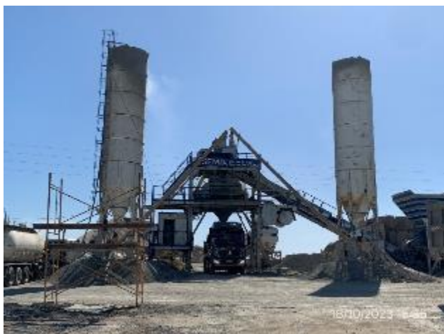
Foto 12.2-9, P03. Planta de hormigón en operación