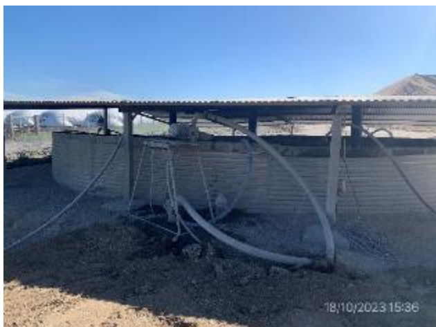
Foto 12.2-11, P03. Planta de hormigón. Tanque asutrialiano con sistema de recuperación