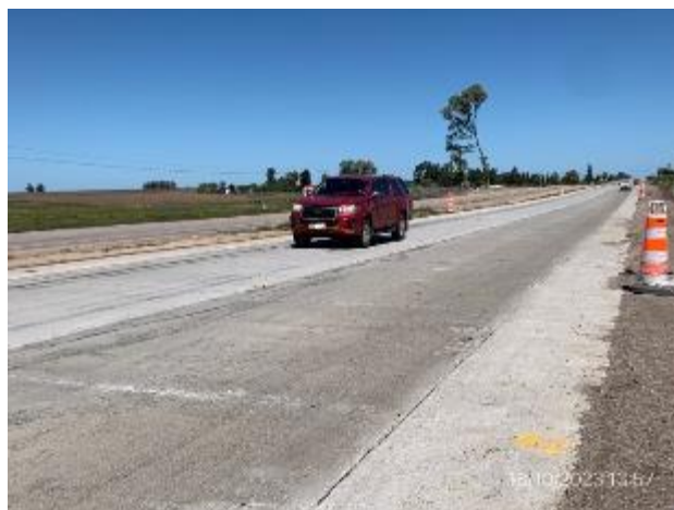
Foto 12.1-14. Tramo de obra. Nueva senda en hormigón en Componenter A abierta al tránsito