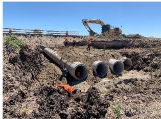
Foto 12.1-4. P05. Frente de obra: Alcantarilla en construcción. Ruta 5 PK 131.200