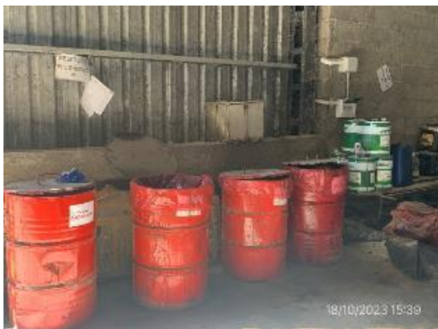
Foto 12.2-15, P03. Obrador, Sector techado y con pavimento impermeable para acopio de residuos contaminados con hidrocarburos