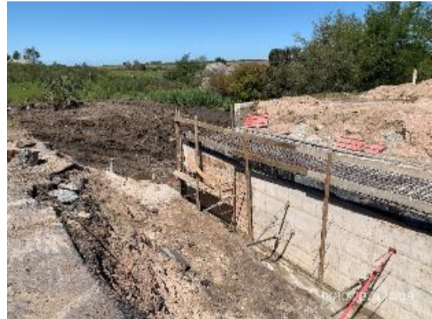
Foto 12.1-6, P06. Frente de obra: Alcantarilla con construcción subcontratada. Ruta 5 PK 129.000