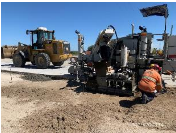
Foto 12.1-9, P07. Frente de obra: Banquinas en construcción. Ruta 5 PK 125.400