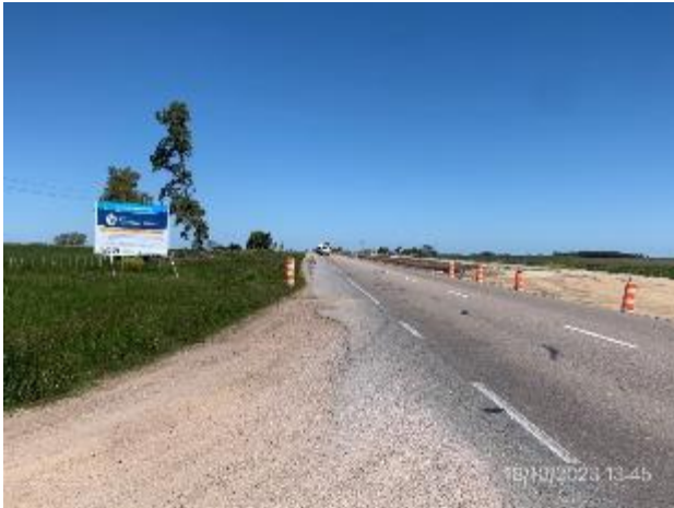
Foto 12.1-1, P02. Fin de tramo. Ruta 5 PK 133K500. Empalme con Ruta 58