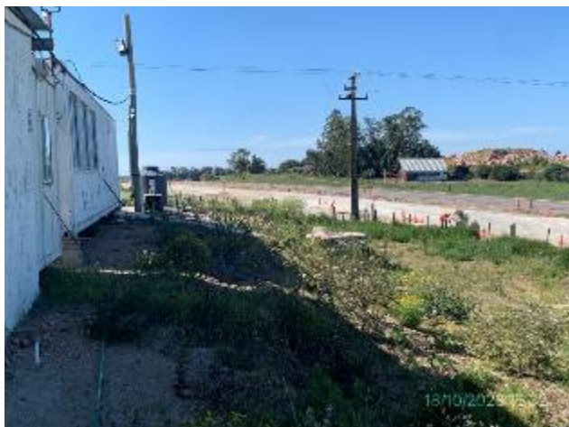
Foto 12.2-13, P03. Obrador, Depósito impermeable para recolección de aguas servidas