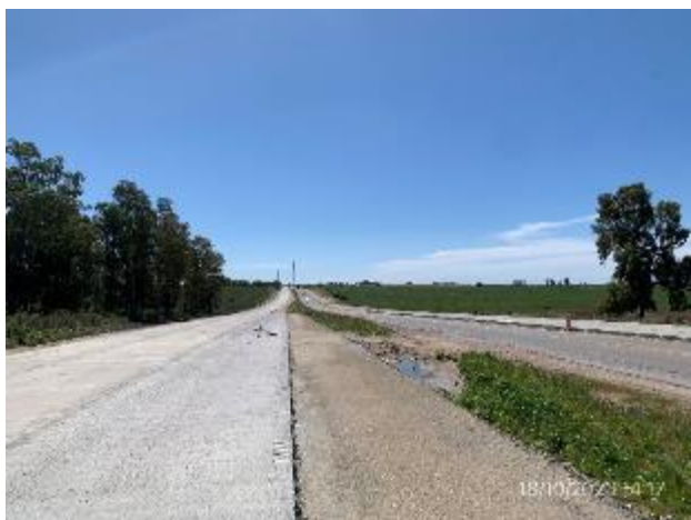
Foto 12.1-13. Tramo de obra. Nuevas sendas a (+) y a (-) construidas en hormigón.