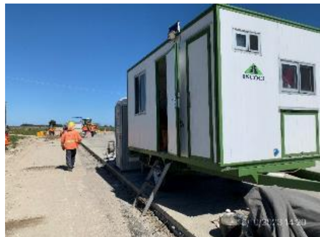
Foto 12.1-10, P07. Campamento móvil de en condiciones correctas.