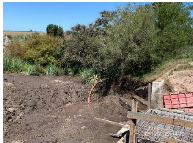
Foto 12.1-8, P06. Motobomba de subcontratista Suelo Firme SA en funcionamiento. No cuenta con elementos de protección anti derrame de combustible.