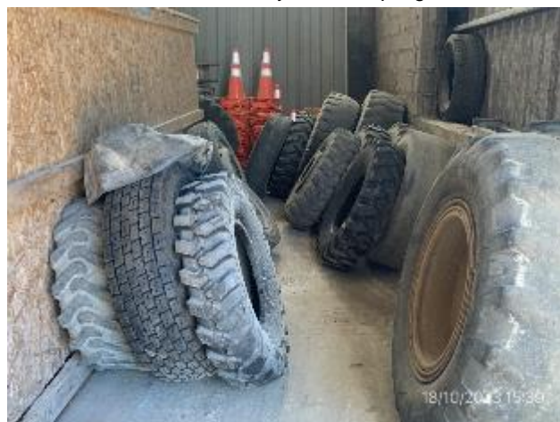
Foto 12.2-16, P03. Obrador, cubiertas en desuso acopiadas en recinto cerrado y techado