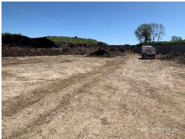
Foto 12.2-1, P09. Cantera de tosca en explotación. Ruta 5 PK 121K000 a (-).