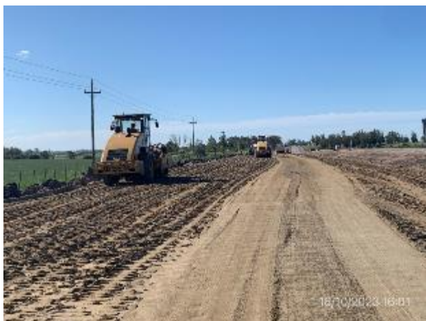
Foto 12.1-15. Tramo de obra. Construcción de base granular