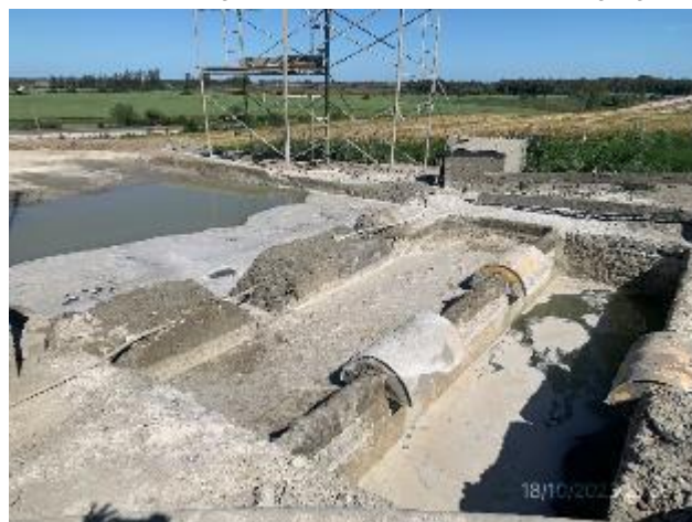
Foto 12.2-10, P03. Planta de hormigón, piletas de decantación