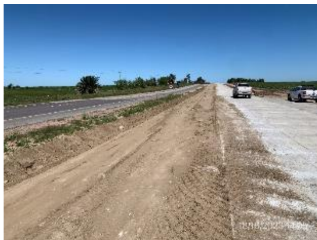
Foto 12.1-16. Tramo de obra. Perfilado de pendientes en cunetas parcialmente terminado.