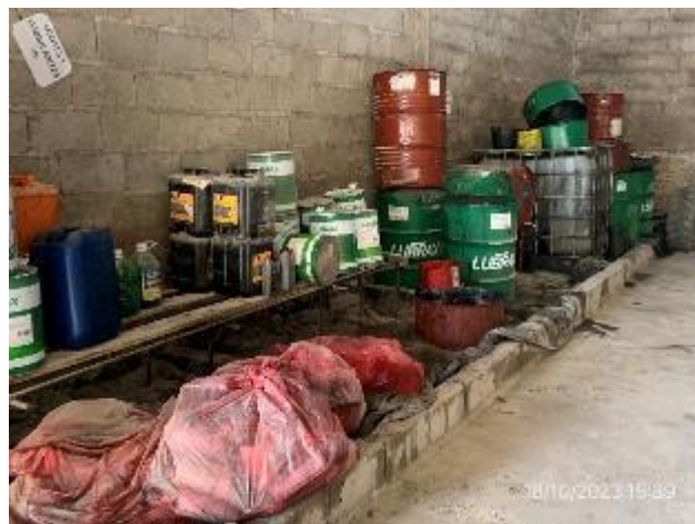
Foto 12.2-14, P03. Obrador, Sector techado y con envallado y pavimento impermeables para acopio de lubricantes usados y residuos peligrosos.