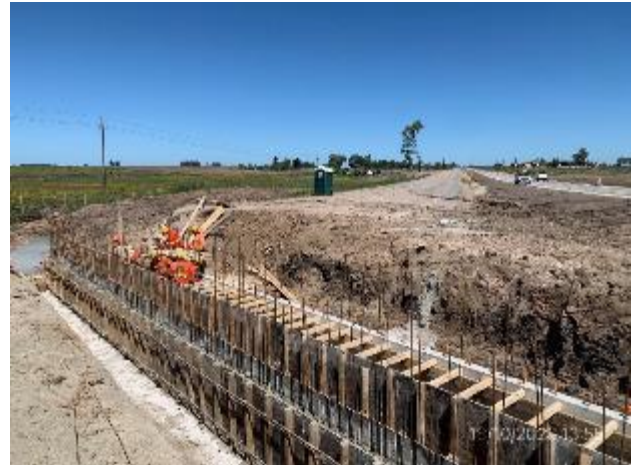
Foto 12.1-2. P04. Frente de obra: Paso de ganado en construcción. Ruta 5 PK 132.300