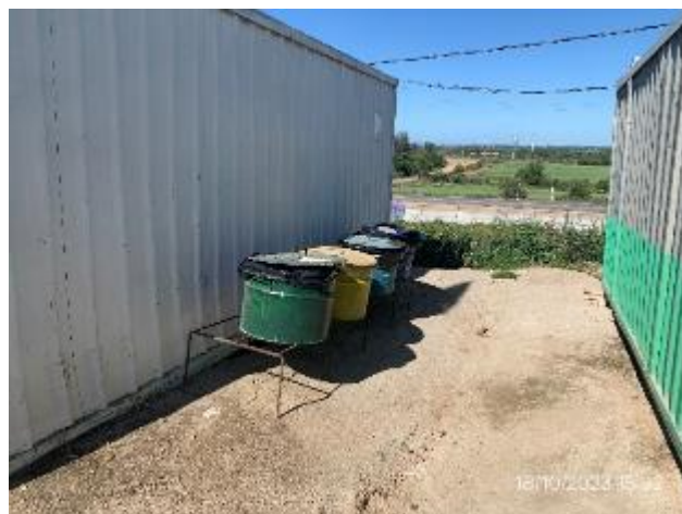
Foto 12.2-12, P03. Obrador, estación de recolección y acopio de residuos segregados por canal de generación.