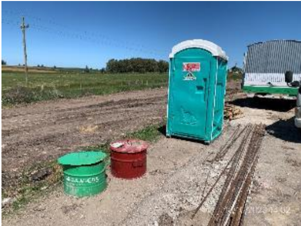
Foto 12.1-5, P05. Campamento móvil con acopio de residuos segregados por corriente de generación.