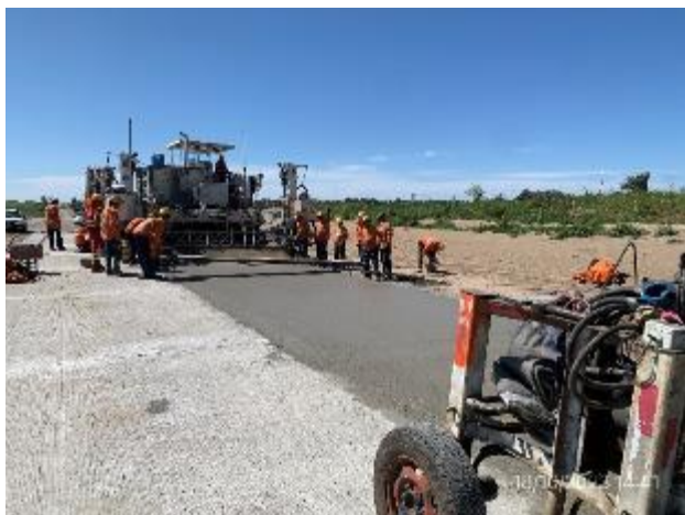
Foto 12.1-11, P08. Frente de obra: Calzada en construcción con Terminadora. Ruta 5 PK 114.700