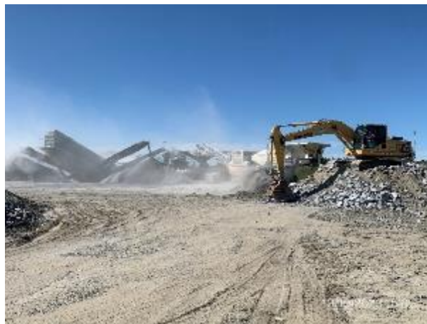
Foto 12.2-6, P10. Cantera de piedra. Tren de trituración en operación.