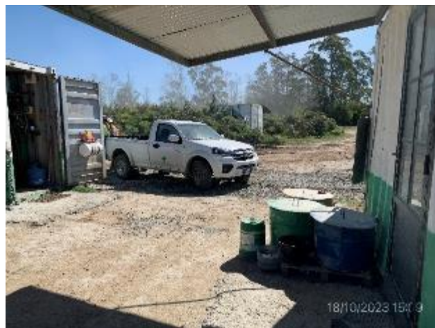
Foto 12.2-8, P10. Cantera de piedra. Instalaciones adecuadas para gestión de residuos de forma segregada