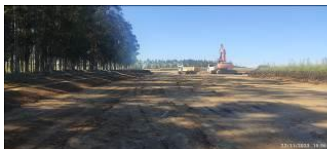
Foto 12.15-1 Vistas tramo en obra Hernández & González.