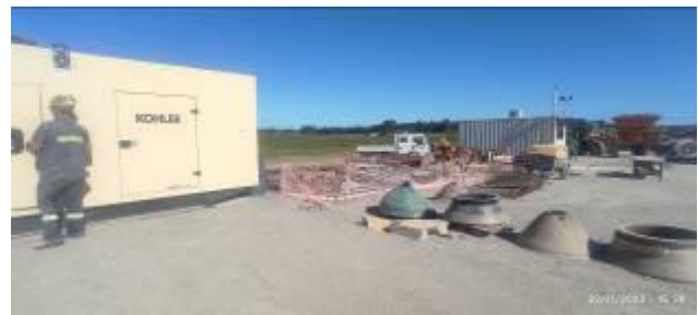
Foto 12.16-1 Planta de Asfalto Traxpalco.