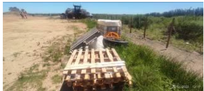
Foto 12.11-1 Obrador Traxpalco.