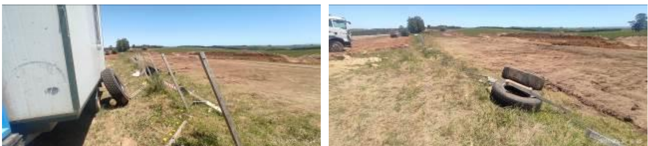
Foto 12.5-1 Cámaras sin cubrir en Cantera P 14248.