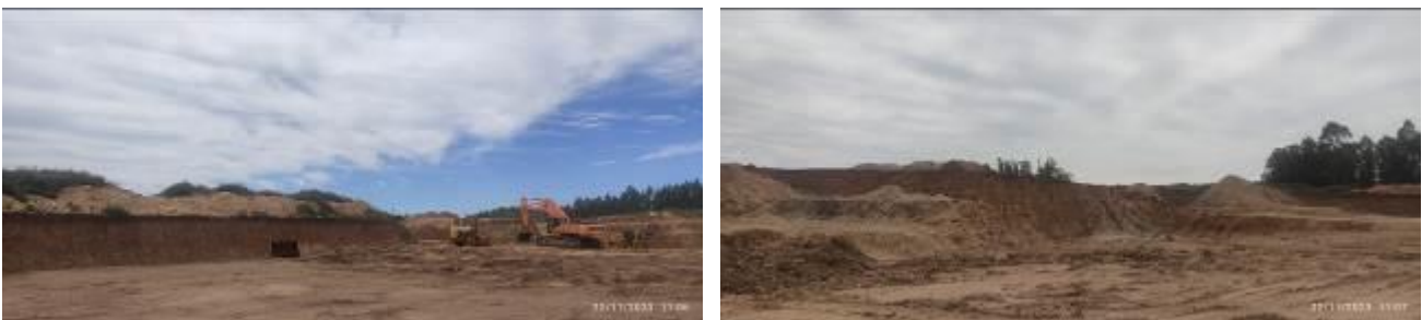
Foto 12.9-1 Vistas Cantera P 9249.