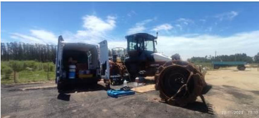
Foto 12.1-1 Tanques con hidrocarburo sin bandeja durante tarea de mantenimiento.