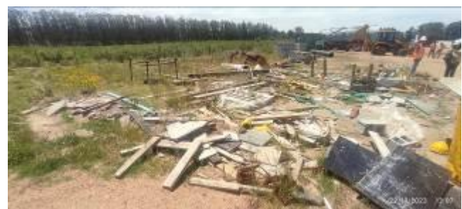
Foto 12.3-1 Residuos diseminados en Obrador de Traxpalco.