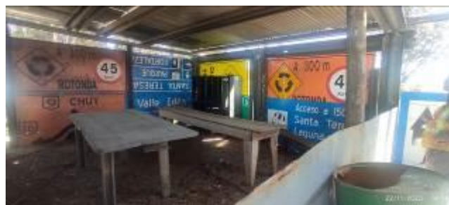
Foto 12.13-1 Campamento Hernández & González.