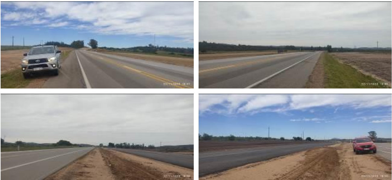
Foto 12.8-1 Vistas tramo de obra Colier.