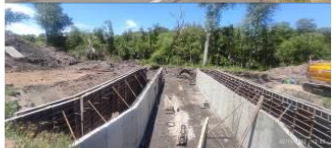
Foto 12.12-1 Vistas tramo de obra Traxpalco.