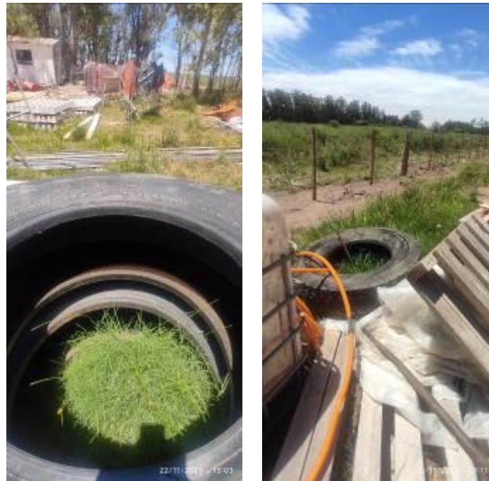
Foto 12.4-1 Cámaras con agua estancada en Obrador de Traxpalco.