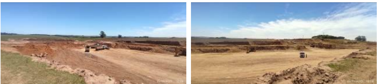
Foto 12.10-1 Vistas Cantera P 14248.