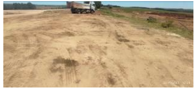
Foto 12.6-1 Derrames de hidrocarburo en Cantera P 14248.