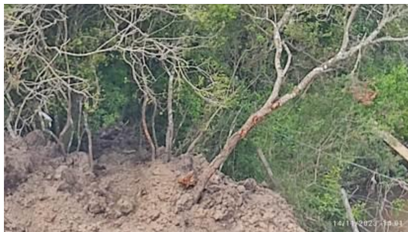
Foto 12.5-1 Vegetación dañada y residuos en el entorno del puente.