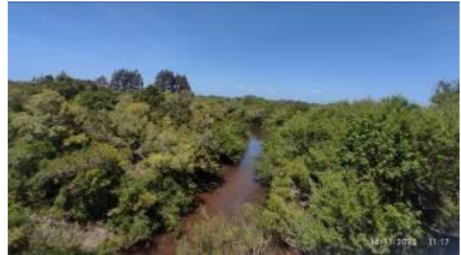
Foto 12.11-1 Puente Ao. Maldonado.