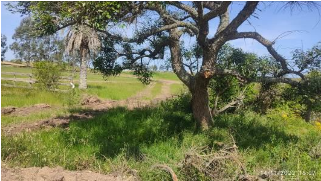
Foto 12.8-1 Rama rasgada.