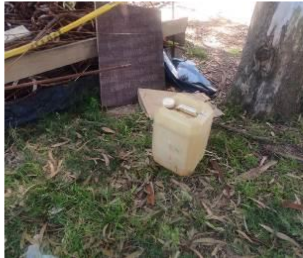
Foto 12.4-1 Tanque de hidrocarburo sin bandeja de contención.