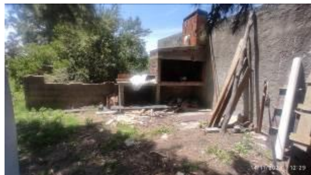
Foto 12.7-1 Residuos diseminados.