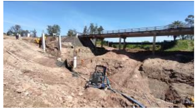
Foto 12.20-1 Puente Ao. del Sauce.