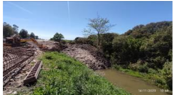
Foto 12.10-1 Puente Ao.Sauce.