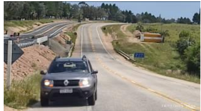
Foto 12.18-1 Puente Cda. La Cruz.