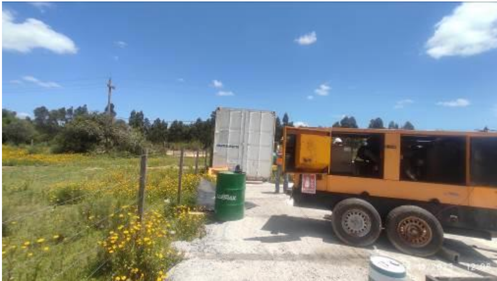
Foto 12.6-1 Piso para tareas de mantenimiento sin perímetro de contención.