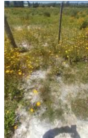
Foto 12.1-1 Derrames en Pileta de Hormigón.