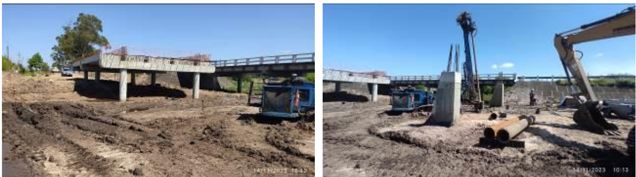
Foto 12.9-1 Puente Ao. Pan de Azúcar.