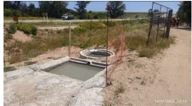
Foto 12.17-1 Puente Ao. José Ignacio.