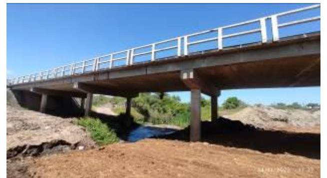
Foto 12.12-1 Puente Cañada Chávez.