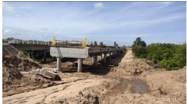
Foto 12.21-1 Puente Ao. Garzón.