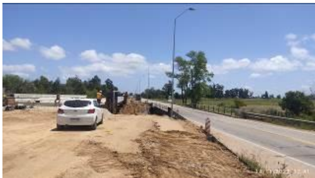
Foto 12.16-1 Puente Cañada Las Pajas.