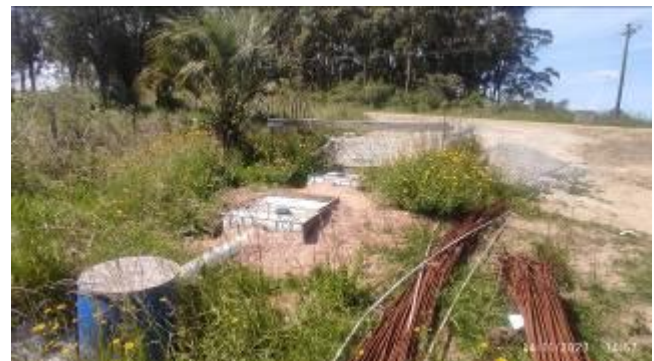
Foto 12.23-1 Puente Ao. Sauce de Rocha.