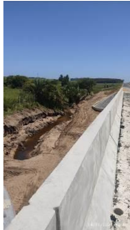
Foto 12.19-1 Puente Ao. Anastasio.