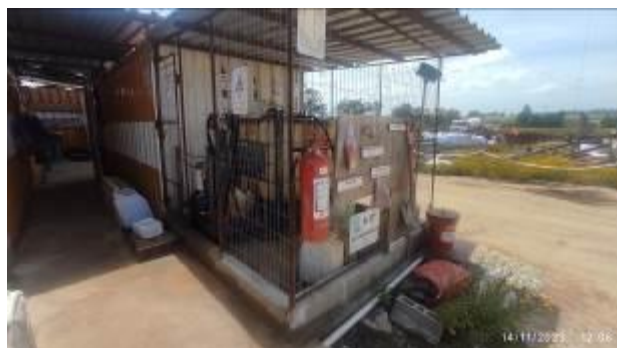
Foto 12.13-1 Obrador SACEEM.