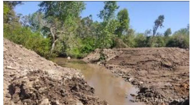
Foto 12.22-1 Puente Ao. Canelón.