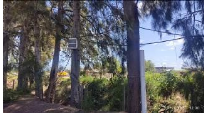
Foto 12.2-1 Estructuras apoyadas en vegetación del entorno.