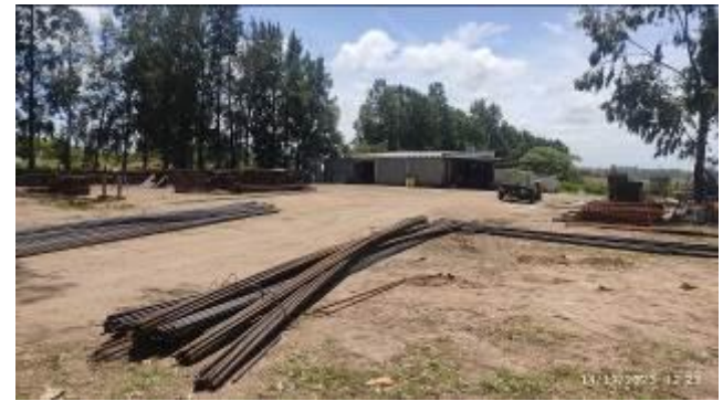
Foto 12.15-1 Obrador PALNET.