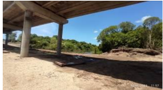
Foto 12.14-1 Puente Ao.San Carlos.