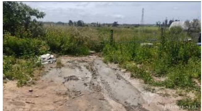
Foto 12.3-1 Derrames en el entorno de un equipo de mezcla de hormigón.