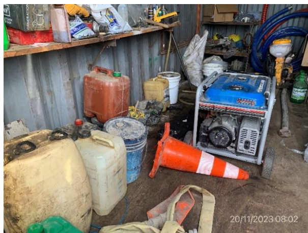
Foto 12.1-6, P03. Obrador, pañol. No hay receptáculos para contención de aceites, combustibles y baterías.