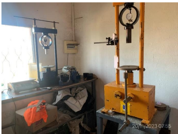
Foto 12.1-5, P03. Obrador, laboratorio de suelos y de asfaltos en buenas condiciones.