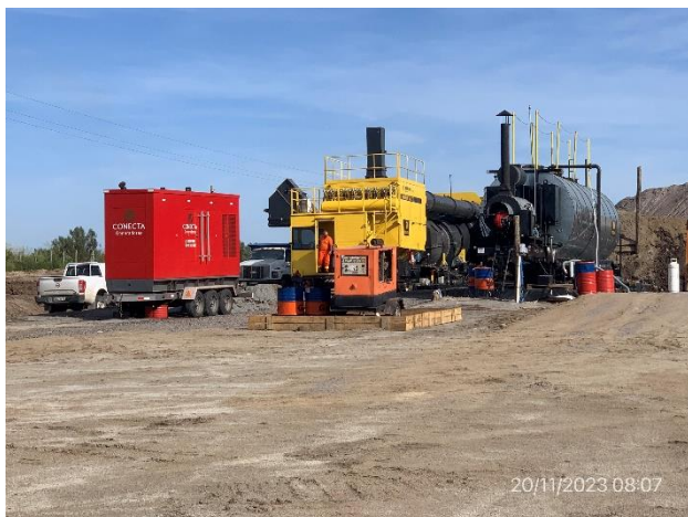
Foto 12.1-1, P03. Obrador y planta asfáltica. Padrón Rural N° 7150 de la 1ª Sección Catastral de Florida. No hay infraestructura para gestión segregada de residuos.