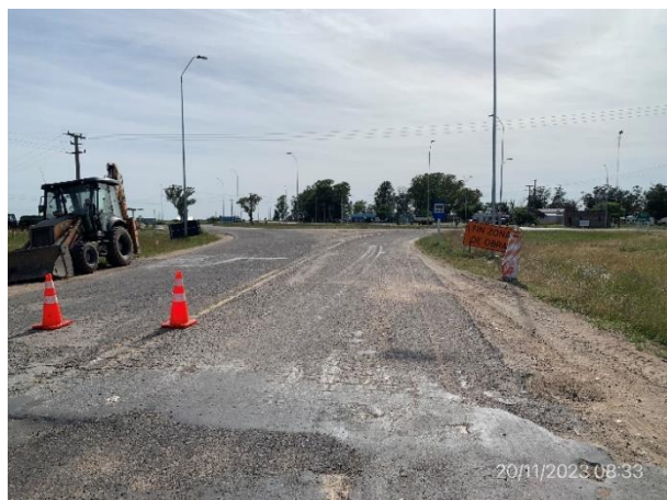
Foto 12.2-1, P02. Fin de tramo, Ruta 56 progresiva 30K800, empalme con Ruta 6.