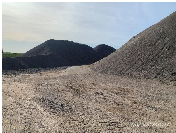
Foto 12.1-2, P03. Planta asfáltica, acopios de material granular de cantera comercial con habilitaciones vigentes.