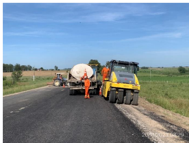
Foto 12.2-4, P04. Frente de obra. Tareas de cebado de banquina en ejecución.