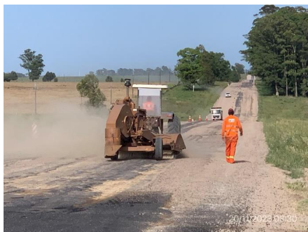
Foto 12.2-3, P04. Frente de obra, Ruta 56 progresiva 29K800. Tareas de barrido en ejecución.