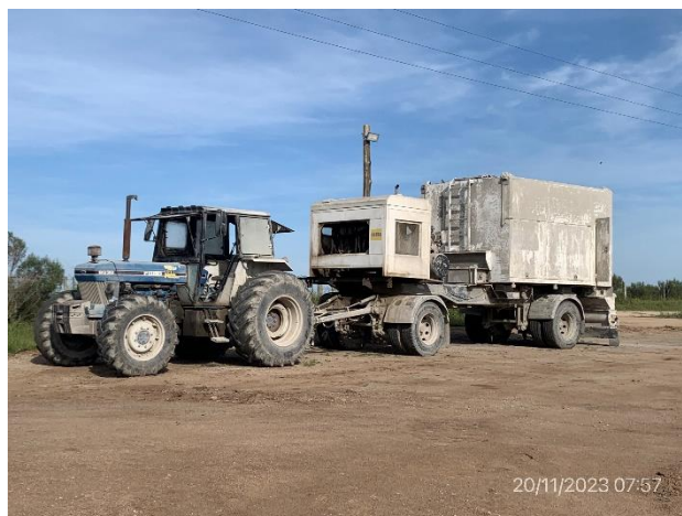
Foto 12.1-4, P03. Obrador, explanada para maniobra y estacionamiento de maquinaria.