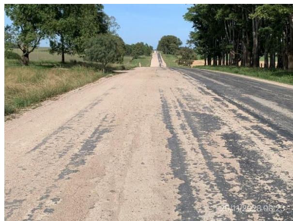
Foto 12.2-2, Ruta 56. Tramo parcial con reciclado de base granular completado.