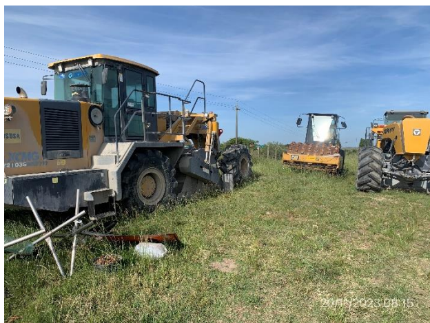
Foto 12.2-5, P05., Campamento provisorio. Ruta 56 progresiva 24K600 a (+). No hay infraestructura para gestión de residuos.