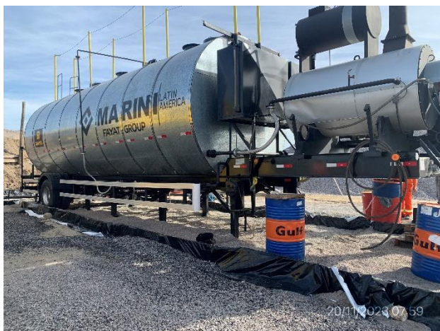
Foto 12.1-3, P03. Planta asfáltica en proceso de montaje, envueltos en construcción.