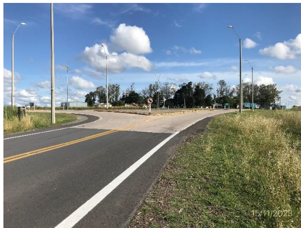
Foto 12.2-2, P02, Fin de tramo. Ruta 20 progresiva 9K200, empalme con Ruta 24.