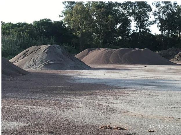
Foto 12.1-5, P06. Acopios de piedra triturada cedidos por Colier SA a DNV – MTOP.