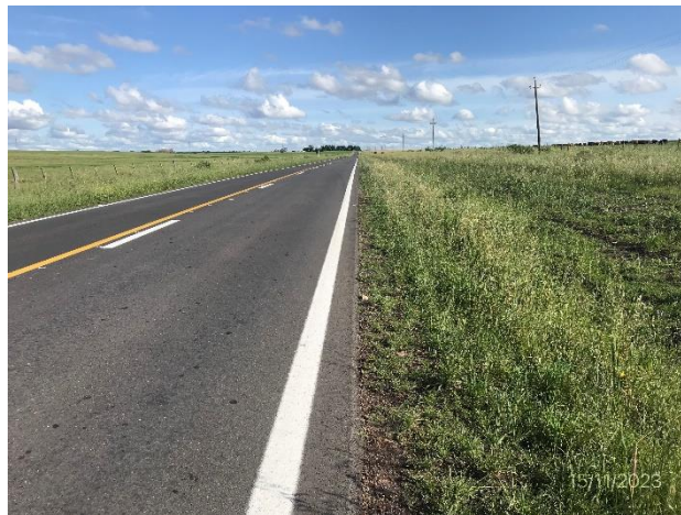
Foto 12.2-4. Ruta 20, faja pública con tapiz vegetal recompuesto y drenaje correcto