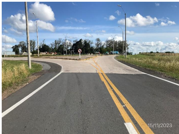
Foto 12.2-1, P02, Fin de tramo. Ruta 20 progresiva 9K200, empalme con Ruta 24