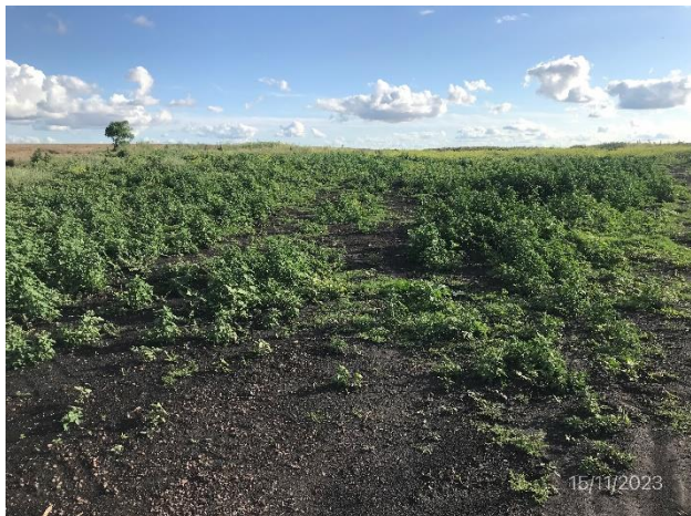
Foto 12.1-1, P05. Obrador desmantelado. Padrón 5947 Río Negro. Ruta 20 progresiva 44K000 a (+).