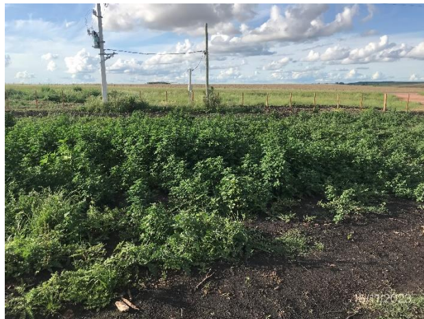
Foto 12.1-2. P05. Explanada desmontada, con suelo descompactado y cubierta vegetal en buenas condiciones.