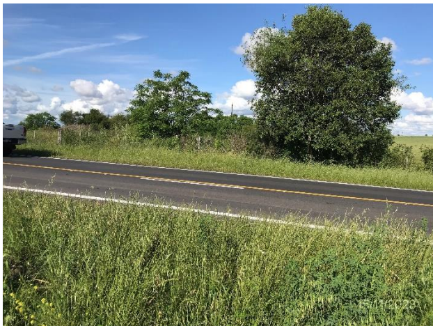
Foto 12.2-3, P04. Ruta 20 progresiva 8K500, paso ferroviario a nivel removido.