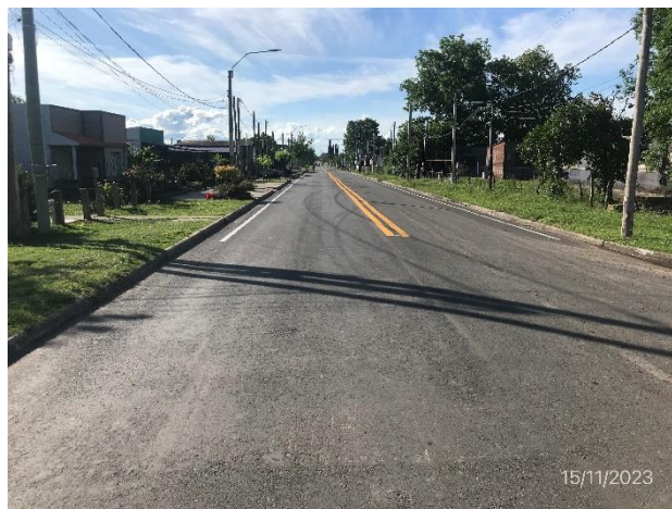
Foto 12.2-6, P03, fin de tramo en Calle 18 de Julio, planta urbana de Nuevo Berlín. Empalme con Ruta 20.