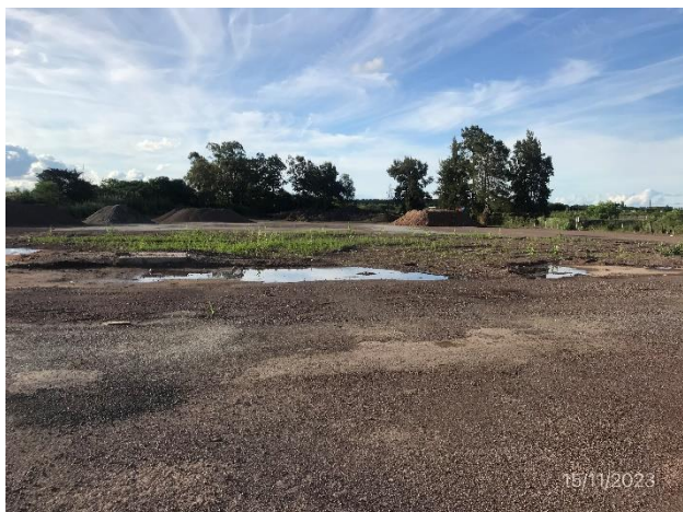
Foto 12.1-3. P06. Planta asfáltica desmontada. Ruta 3 progresiva 277K800 a (-), campamento de DNV – MTOP.