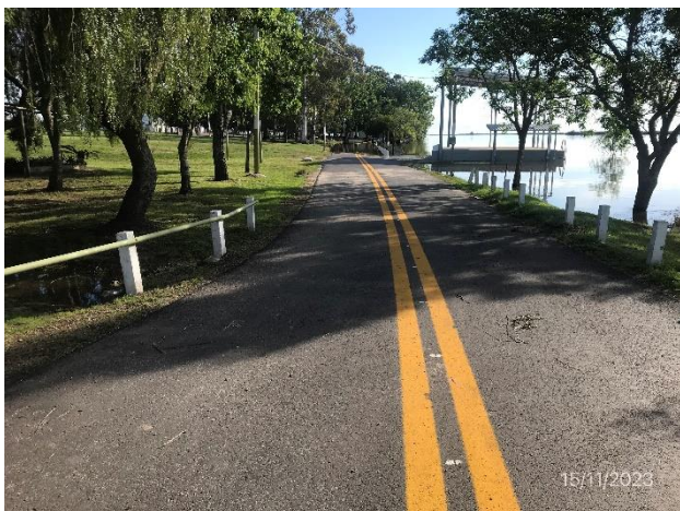
Foto 12.2-5, P01, Inicio de tramo. Ruta 20 progresiva 0K000, Nuevo Berlín