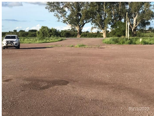
Foto 12.1-4. P06. Planta asfáltica desmontada, infraestructuras de Colier SA completamente retiradas