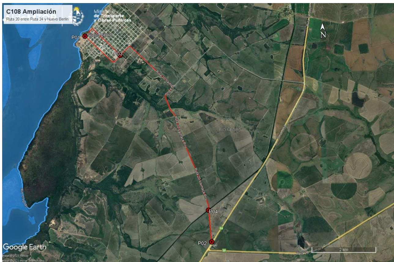
Figura 5-1 Lugares de interés.

También se recorrieron el predio donde estuvo el obrador y el predio donde estuvo ubicada la planta asfáltica. Al momento de la auditoría, ambas infraestructuras fueron íntegramente desmanteladas.