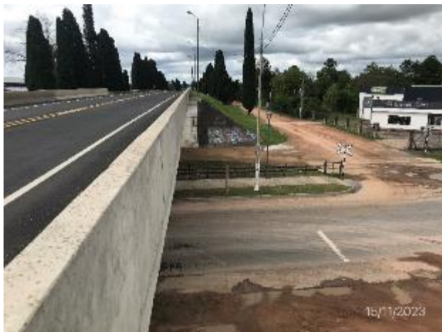
Foto 12.1-11, P03. Campamento móvil desmontado, zona libre de ROCS u otro tipo de residuos..