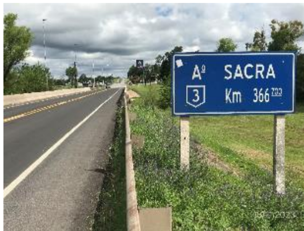
Foto 12.1-6, P02. Obras terminadas en puente sobre Aº Sacra. Ruta 3 progresiva 366K700.