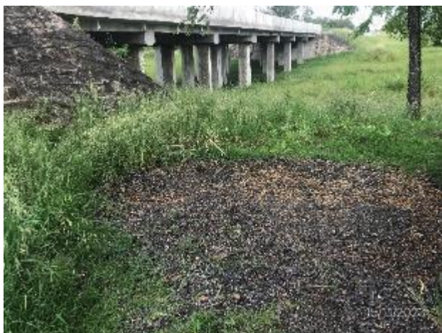
Foto 12.1-3, P01. Restos de fresado de asfalto – RAP – sin retirar en campamento móvil desmantelado de la faja pública de Ruta 3