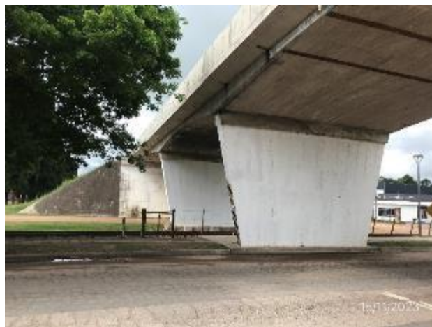
Foto 12.1-10, P03. Obras terminadas en puente de intercambiador sobre Ruta 90, Ruta 3 progresiva 366K700.