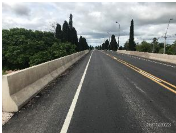
Foto 12.1-12, P03. Carpeta de rodadura y obras de señalización terminadas.