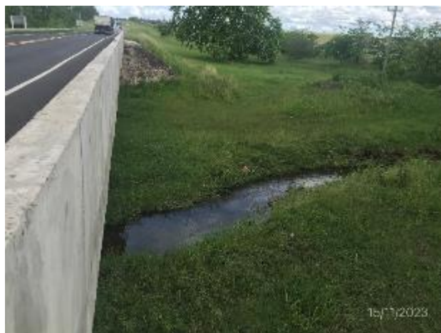
Foto 12.1-4, P01. Cauce de agua limpio, sin ROCs u otro tipo de residuos..