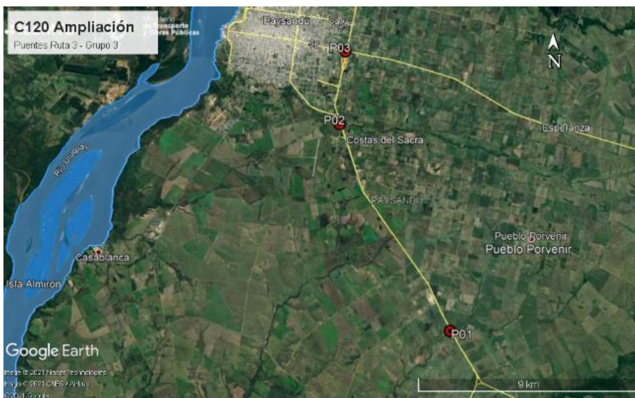
Figura 5-1 Lugares de interés.

También se recorrieron las zonas donde estuvieron los campamentos móviles, linderas a cada uno de los puentes.