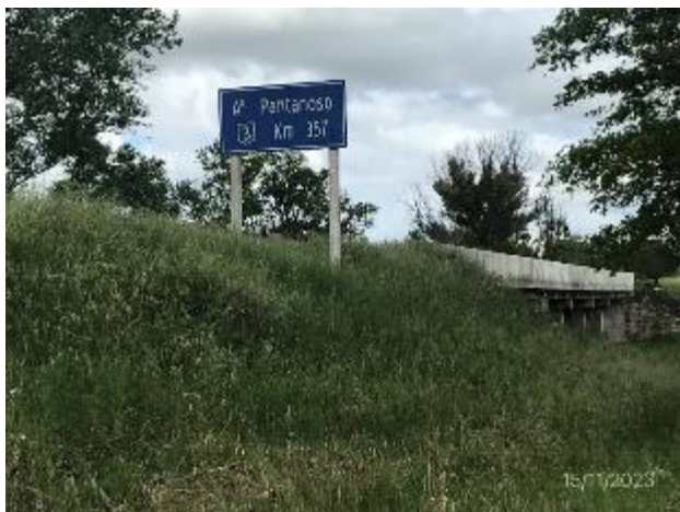
Foto 12.1-1, P01. Obras terminadas en puente sobre A° Pantanoso. Ruta 3 progresiva 356K910.