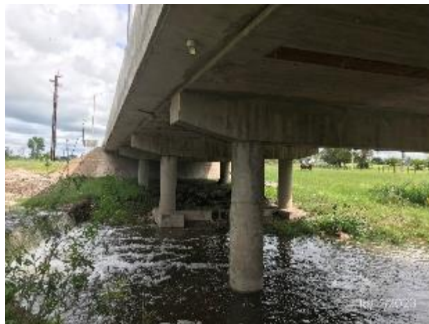
Foto 12.1-8, P02 Ataguía desmontada y zona curso de agua con remediación ambiental ejecutada.