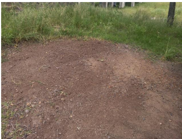
Foto 12.1-5, P01. RAP retirado .