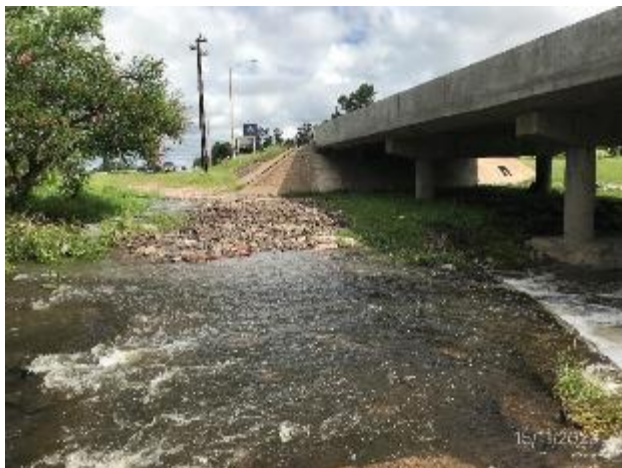
Foto 12.1-7, P02. Cauce de agua limpio, sin ROCs u otro tipo de residuos..