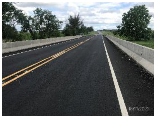
Foto 12.1-2, P01. Carpeta de rodadura y obras de señalización terminadas.