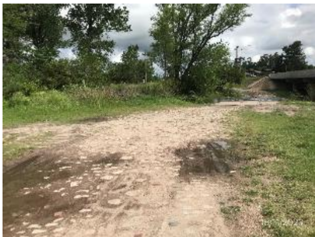
Foto 12.1-9, P02. Zona de campamento móvil desmantelado libre de ROCs u otro tipo de residuos..