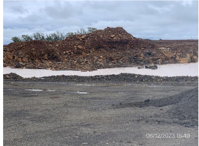
Foto 12.2-2, P04. Cantera, frente de explotación.