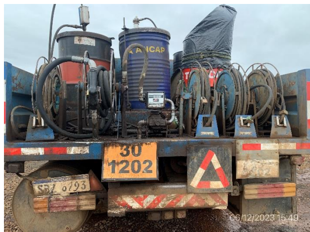
Foto 12.2-7, P04. Obrador, camión de mantenimiento mecánico con elementos de seguridad según PGA de la obra.