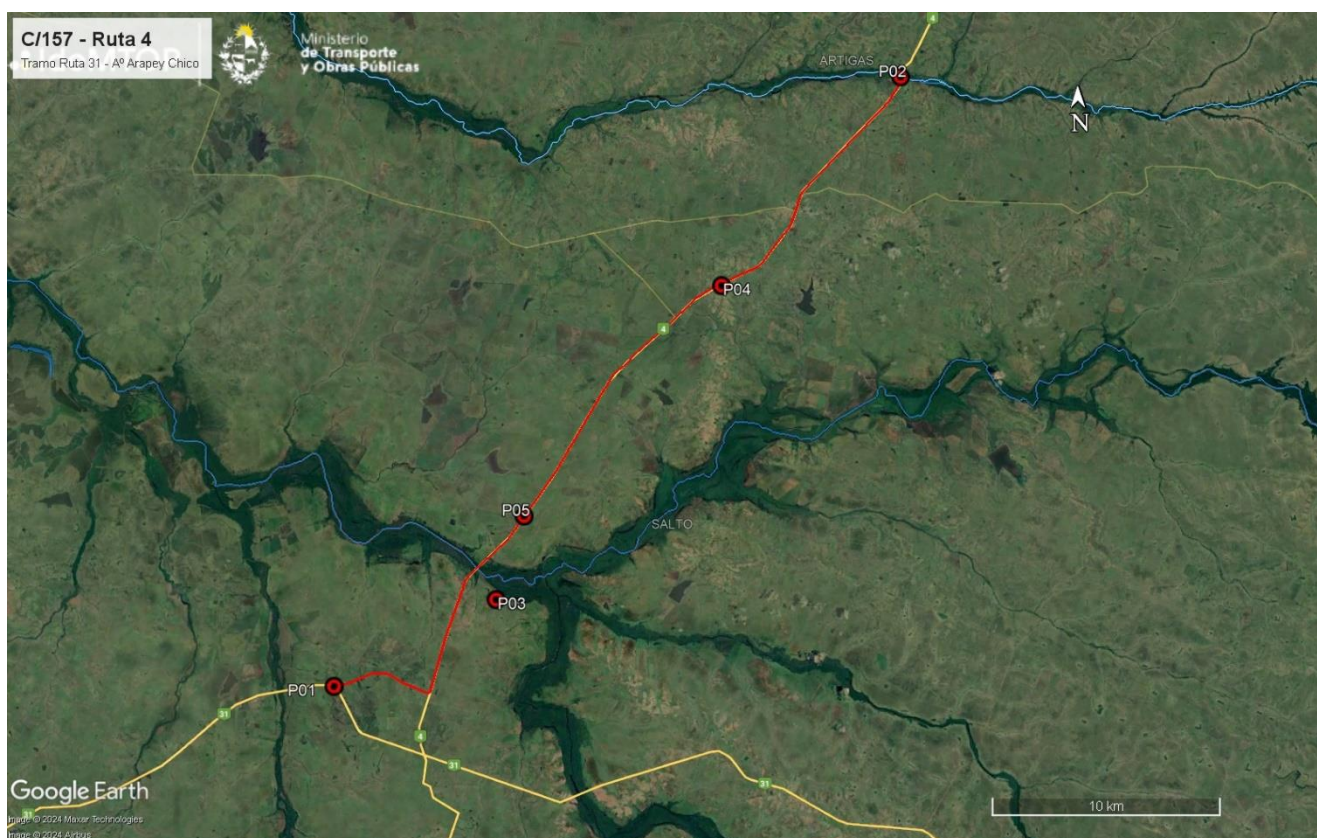
Figura 5-1 Lugares de interés.

La empresa Impacto Construcciones subcontrató a la empresa Macromil SA la ejecución de los trabajos en el tramo de Ruta 31 comprendido entre las progresivas 99K000 y 118K500.