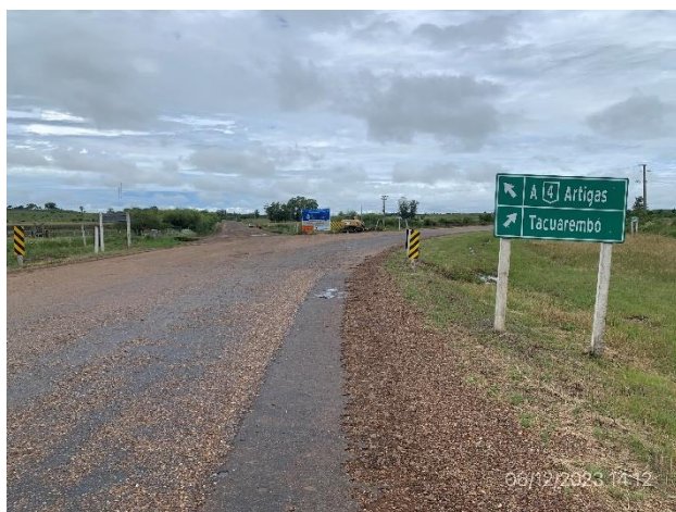
Foto 12.3-1, P01. Inicio de tramo, Ruta 4 progresiva 99K000. Empalme con Ruta 31.