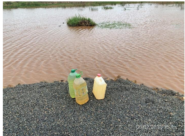
Foto 12.2-4, P04. Cantera, bidones de combustible sin rotular y sin elementos de contención para prevención de derrames