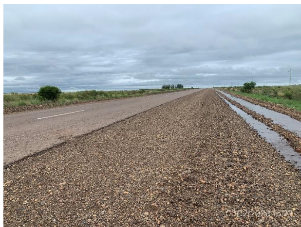
Foto 12.3-6. Tramo de Ruta 4 con bacheo terminado en media calzada.