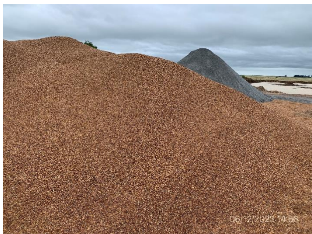
Foto 12.1-11, P03. Cantera, acopios de material triturado.