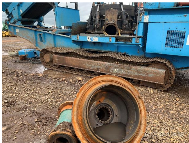
Foto 12.1-8, P03. Obrador, se realiza mantenimiento de equipo pesado fuera de la zona prevista como taller mecánico.