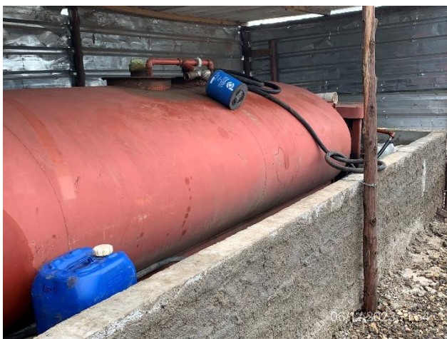
Foto 12.1-3, P03. Obrador, surtidor de combustible en local envallado y con pavimento impermeable.