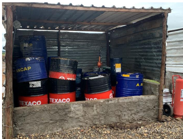
Foto 12.1-4, P03. Obrador, sector envallado y techado para alojar tarrinas con lubricantes.