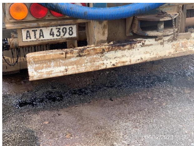
Foto 12.2-10, P04. Obrador, derrames de emulsión de camión regador.