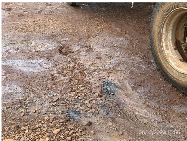
Foto 12.2-11, P04. Obrador, derrames de hidrocarburos sobre suelo desnudo.