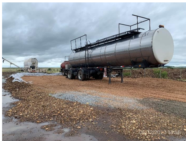
Foto 12.1-6, P03. Obrador, cisterna de emulsiones asfálticas estacionada en recinto impermeable.