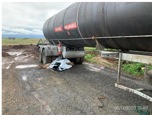
Foto 12.2-6, P04. Obrador, cisternas de emulsiones asfálticas estacionada sobre suelo desnudo.