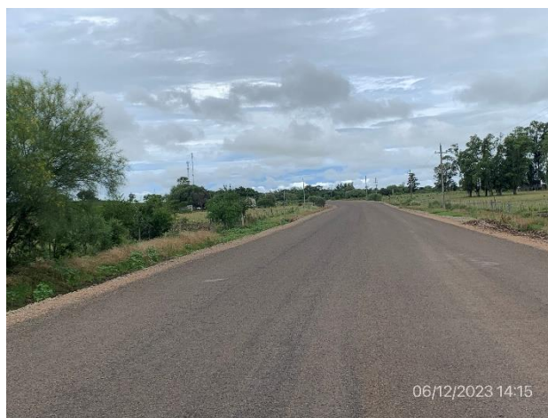
Foto 12.3-2. Tramo de Ruta 4 parcialmente completo con ensanche realizado y primer tratamiento ejecutado.