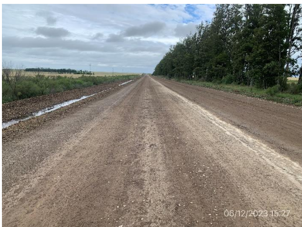
Foto 12.3-5. Tramo de Ruta 4 con estabilizado de base granular ejecutado.