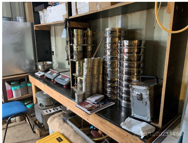
Foto 12.1-2, P03. Obrador, laboratorio de suelos en buenas condiciones de orden y limpieza.