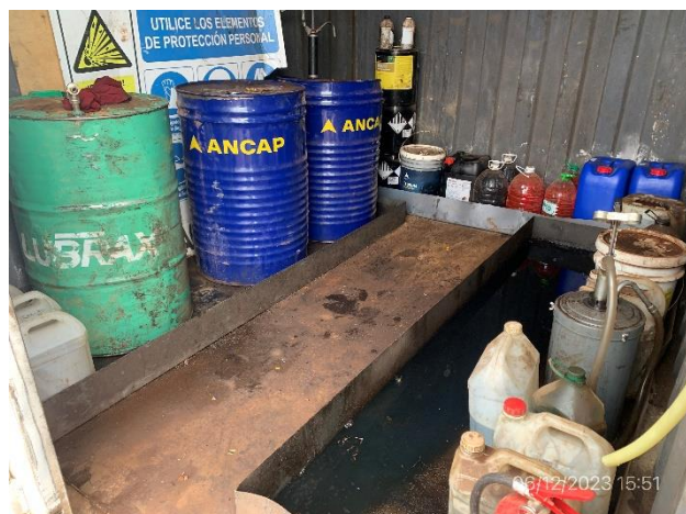
Foto 12.2-9, P04. Obrador, pañol cerrado con lubricantes alojados en bandejas estancas.