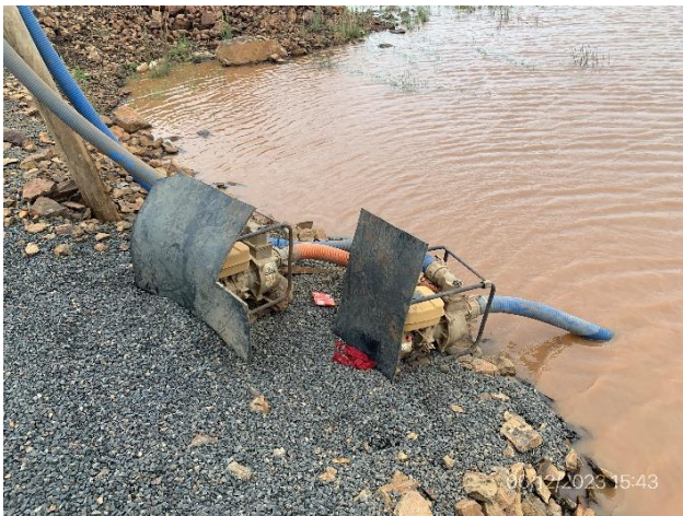
Foto 12.2-3, P04. Cantera, motobombas en funcionamiento sin elementos de contención para prevención de derrames