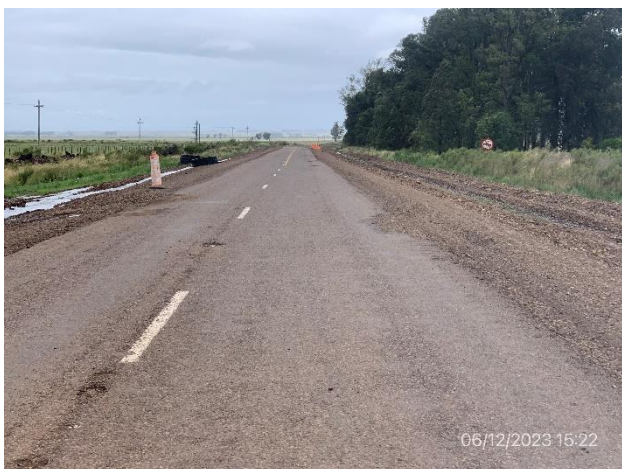
Foto 12.3-3. Tramo de Ruta 4 con ensanche de base granular ejecutado en sendas a (+) y a (-).