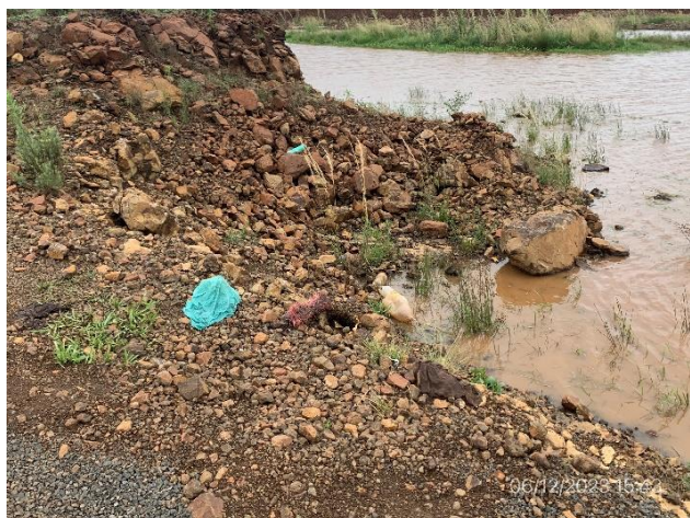
Foto 12.2-5, P04. Cantera, residuos dispersos.