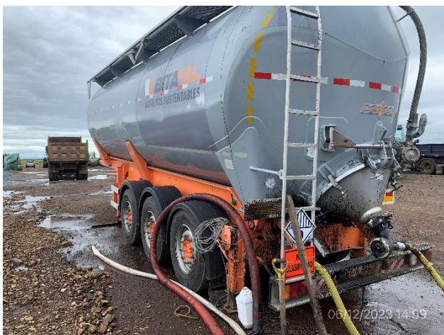
Foto 12.1-9, P03. Segunda cisterna de emulsiones asfálticas, alojada fuera de la zona de pavimento impermeable.