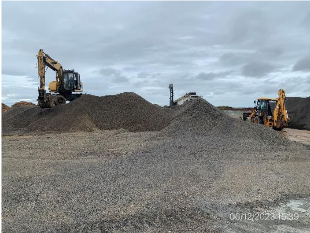
Foto 12.2-1, P04. Cantera y Obrador de Macromil SA. Padrón N°425 de la 7ª SC de Salto.