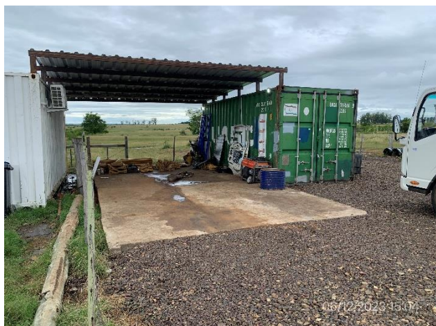
Foto 12.1-7, P03. Obrador, taller mecánico. No es apropiado para el porte del equipamiento dispuesto en el obrador. No cuenta con pavimento con pendientes dotado de interceptor de grasas y aceites.