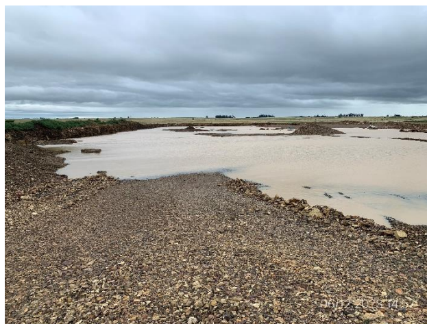
Foto 12.1-10, P03. Cantera, frente de explotación. Buenas condiciones de limpieza.