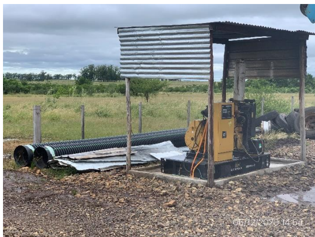
Foto 12.1-5, P03. Obrador, recinto envallado para grupo electrógeno.