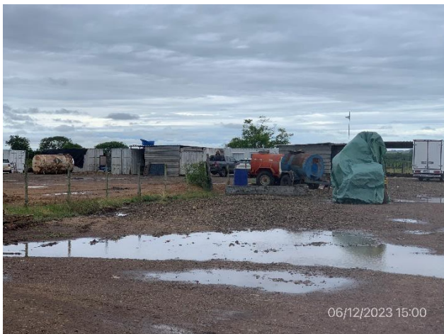
Foto 12.1-1, P03. Cantera y Obrador de Impacto Cosntrucciones SA. Padrón N°1085 de la 4ª SC de Salto.