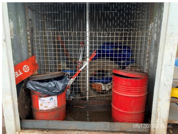
Foto 12.2-8, P04. Obrador, recinto de acopio de residuos contaminantes envuelto y techado.