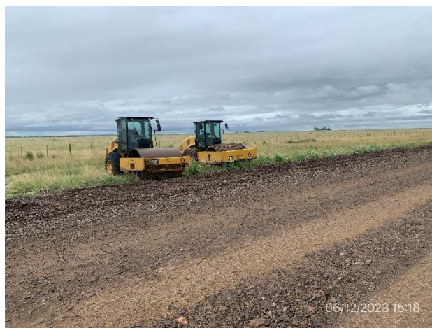
Foto 12.3-4, P05. Frente de Obras. Ruta 4 progresiva 92K000. Equipos estacionados en faja pública de Ruta 4, sin evidencia de contar con autorización de DNV – MTOP.