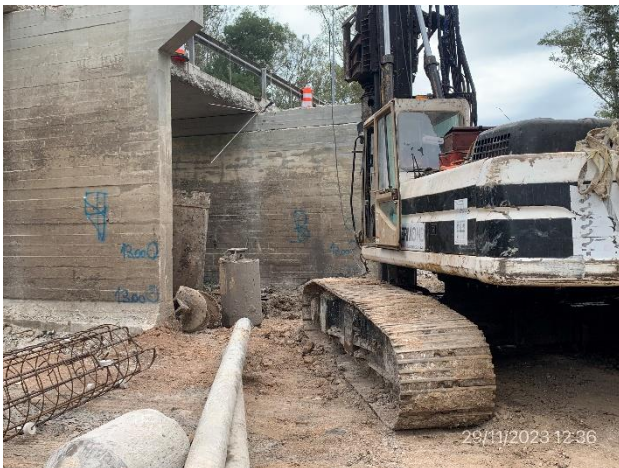
Foto 12.2-5, P01. Trabajos de subcontratista Viermond SA detenidos por modificación de procedimiento constructivo.