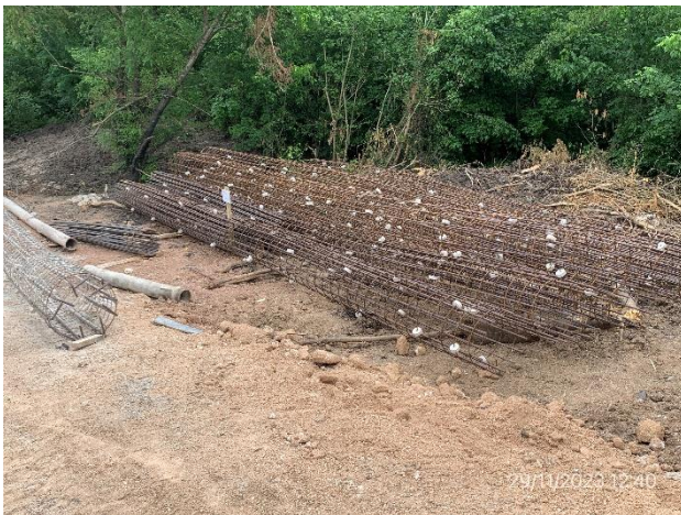
Foto 12.1-3, P05. Obrador, explanada de acopio de armaduras listas para su colocación.