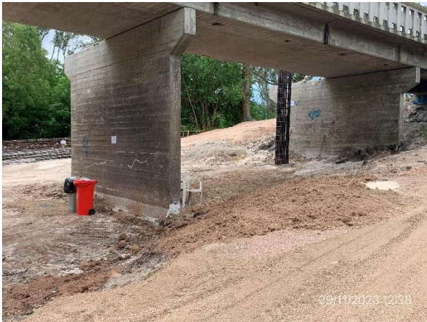
Foto 12.2-3, P01. Planicie de inundación del curso de agua limpia, con estación de acopio de residuos segregados.