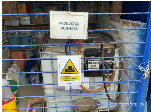
Foto 12.1-4, P05. Obrador, sector envallado para acopio de productos peligrosos.