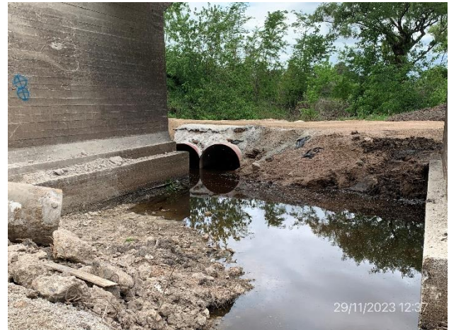
Foto 12.2-4, P01. Alcantarilla provisional para permitir circulación de maquinaria.