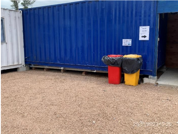
Foto 12.1-1, P05. Obrador, estación de acopio de residuos segregados.