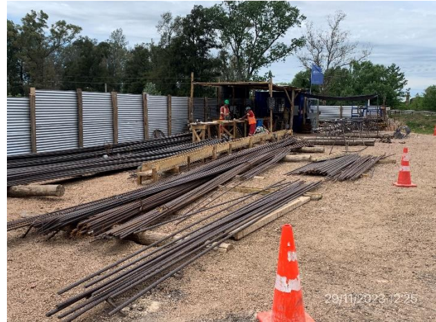
Foto 12.1-2, P05. Obrador, explanada de acopio de armaduras sin procesar.