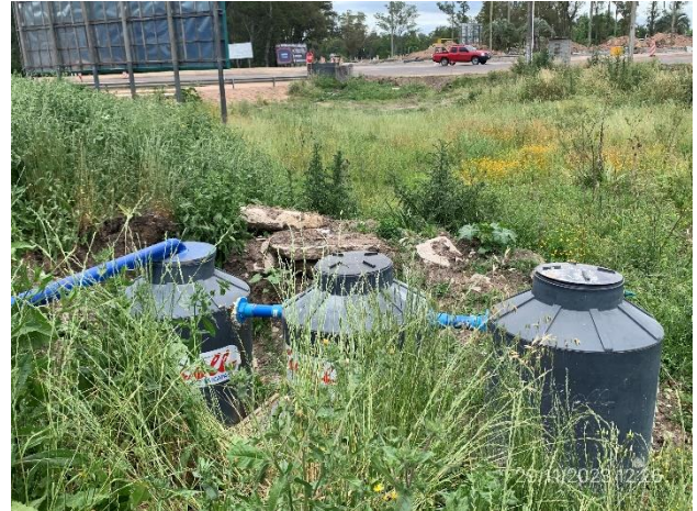
Foto 12.1-6, P05. Obrador, depósito impermeable para almacenaje de aguas servidas.