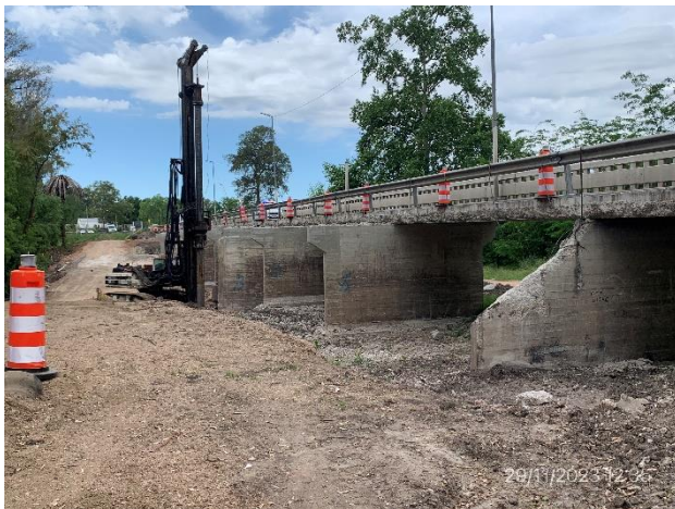
Foto 12.2-1, P01. Puente principal sobre Arroyo Canelón Chico en obra. Ruta 11 progresiva 99K750.