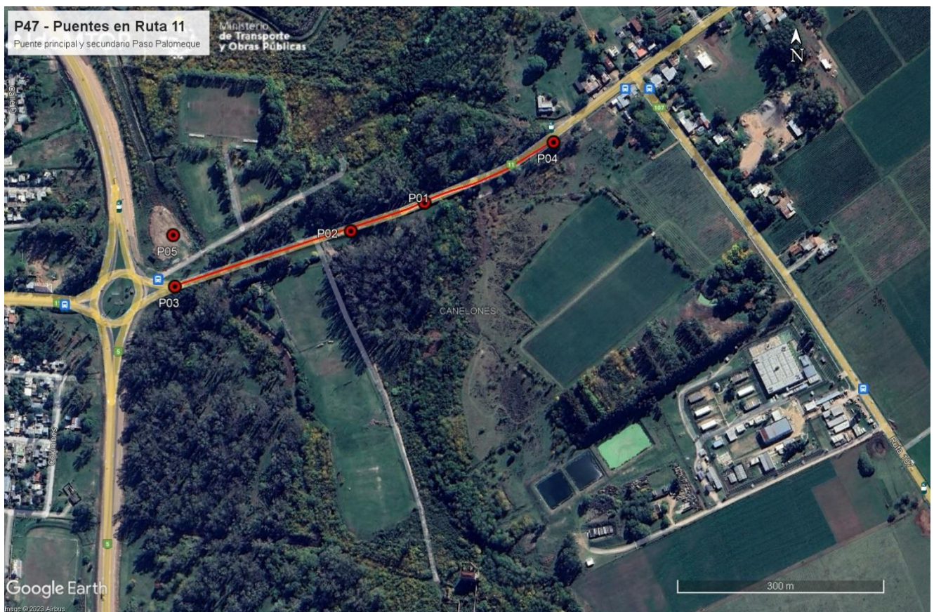
Figura 5-1 Lugares de interés.

Durante la auditoría ambiental se recorrió la obra del puente sobre el curso principal del A° Canelón chico y el obrador de la empresa Stiler SA.