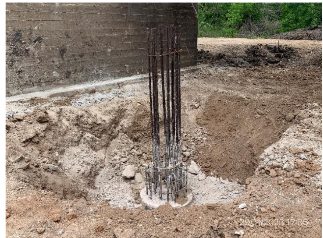
Foto 12.2-2, P01. Pilote ejecutado para cimentación de nuevo puente.