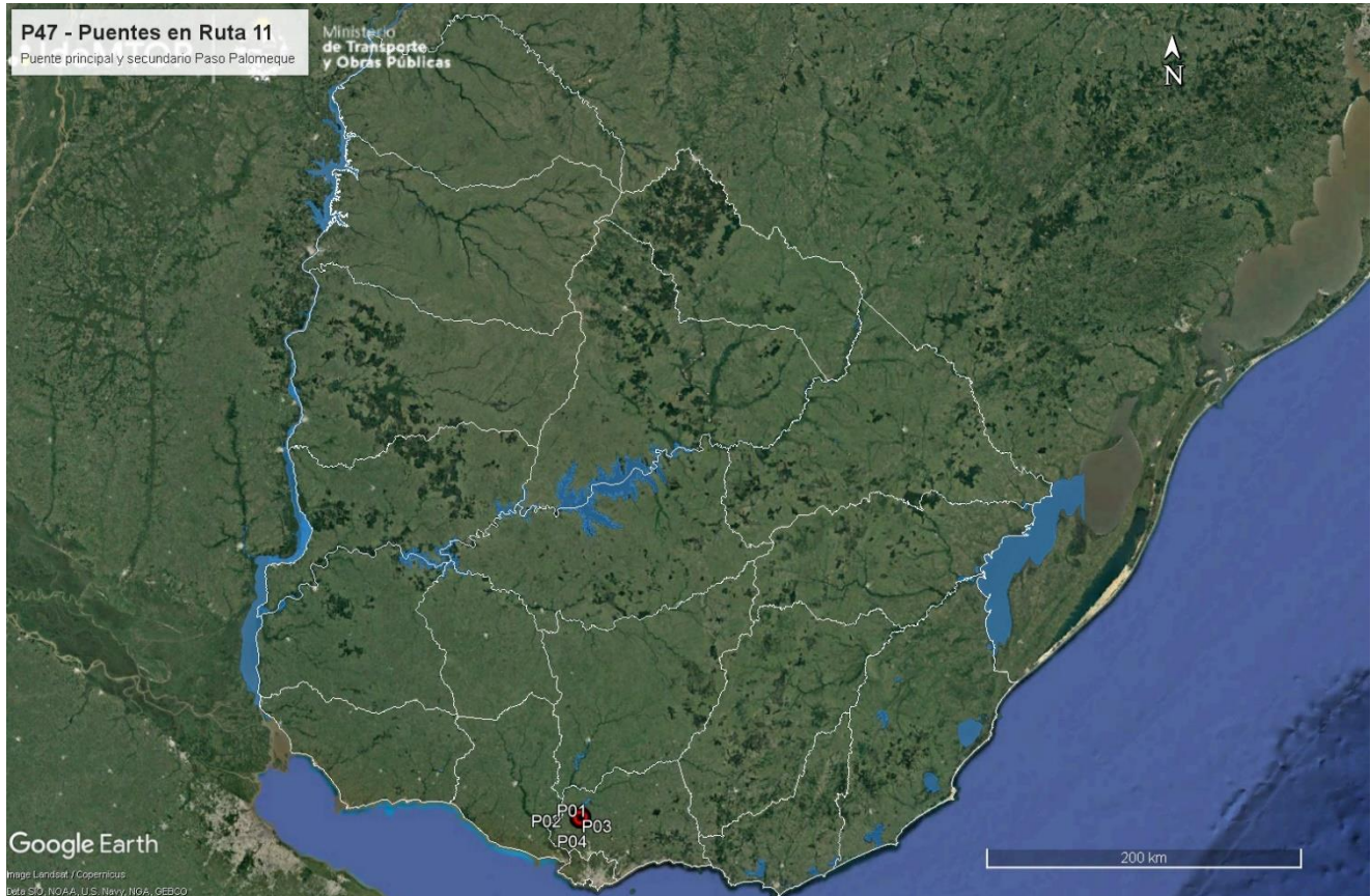
Figura 4-1 Ubicación de la obra.