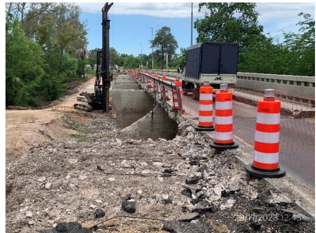
Foto 12.2-6, P01. Tránsito en Ruta 11 en media calzada por demolición senda a (-) del puente.