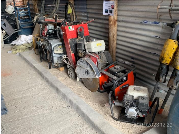
Foto 12.1-5, P05. Obrador, sector envallado con impermeable para almacenaje de motoherramientas.