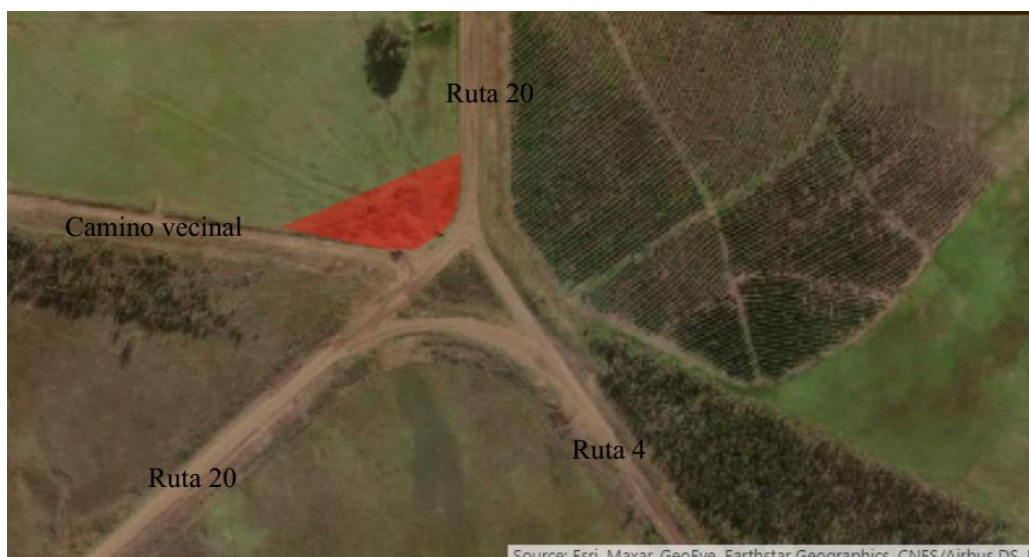
Figura 5 Ubicación de la Planta Asfáltica

En la figura 5 se muestra la ubicación de la misma la que fuera aprobada por la dirección de obra.