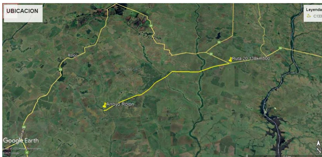
Figura 1: trazado proyectado.

En el marco de la obra Licitación C/133 se plantea un nuevo trazado de Ruta 20, en el tramo Arroyo Rolón - Ruta 20 (138km500) según se indica en la figura 1.