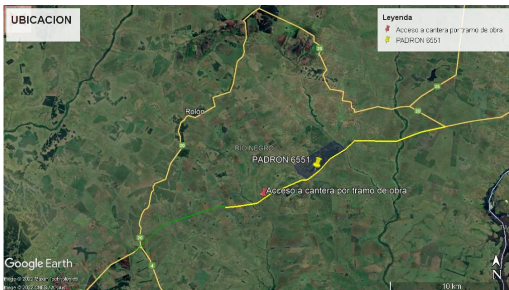
Figura 3: ubicación de la cantera padrón 6551

Una ubicada en el padrón No 6551, de la 10ª sección catastral del departamento de Río Negro, a la cual se accede desde la propia obra, en la siguiente imagen se muestra su ubicación: