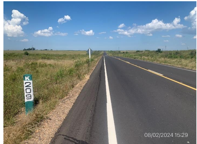
Foto 12.2-4, P02. Fin de tramo. Ruta 30 progresiva 209K000.