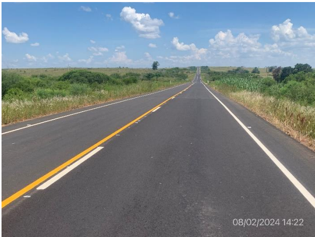
Foto 12.2-3, Ruta 30. Recapado en mezcla asfáltica terminado, con señalización concluida.