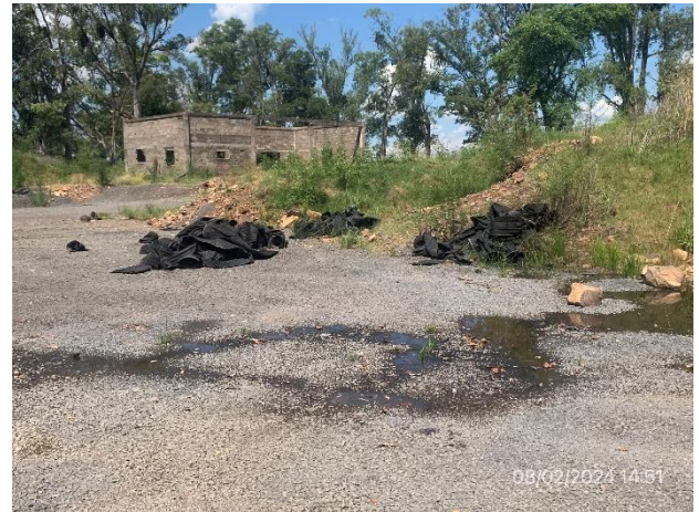
Foto 12.1-4, P03. Plataforma de maniobras, quedan residuos sin disponer adecuadamente.