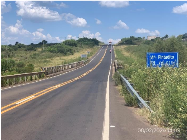
Foto 12.2-1, P01. Inicio de tramo. Ruta 30, puente sobre Aª Pintado, Depto. de Artigas.