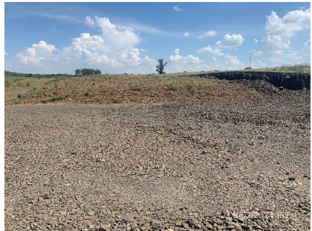
Foto 12.1-9, P04. Frente de cantera con abatimiento de pendientes por medio de material de destape estéril..