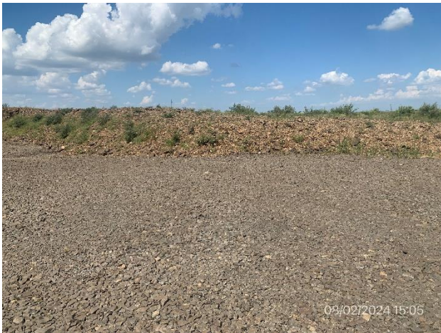
Foto 12.1-8, P04. Frente de cantera con abatimiento de pendientes por medio de material de destape estéril.