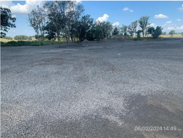
Foto 12.1-1, P03. Obrador y planta asfáltica desmontados. Ruta 30 progresiva a 173K400 a (-).