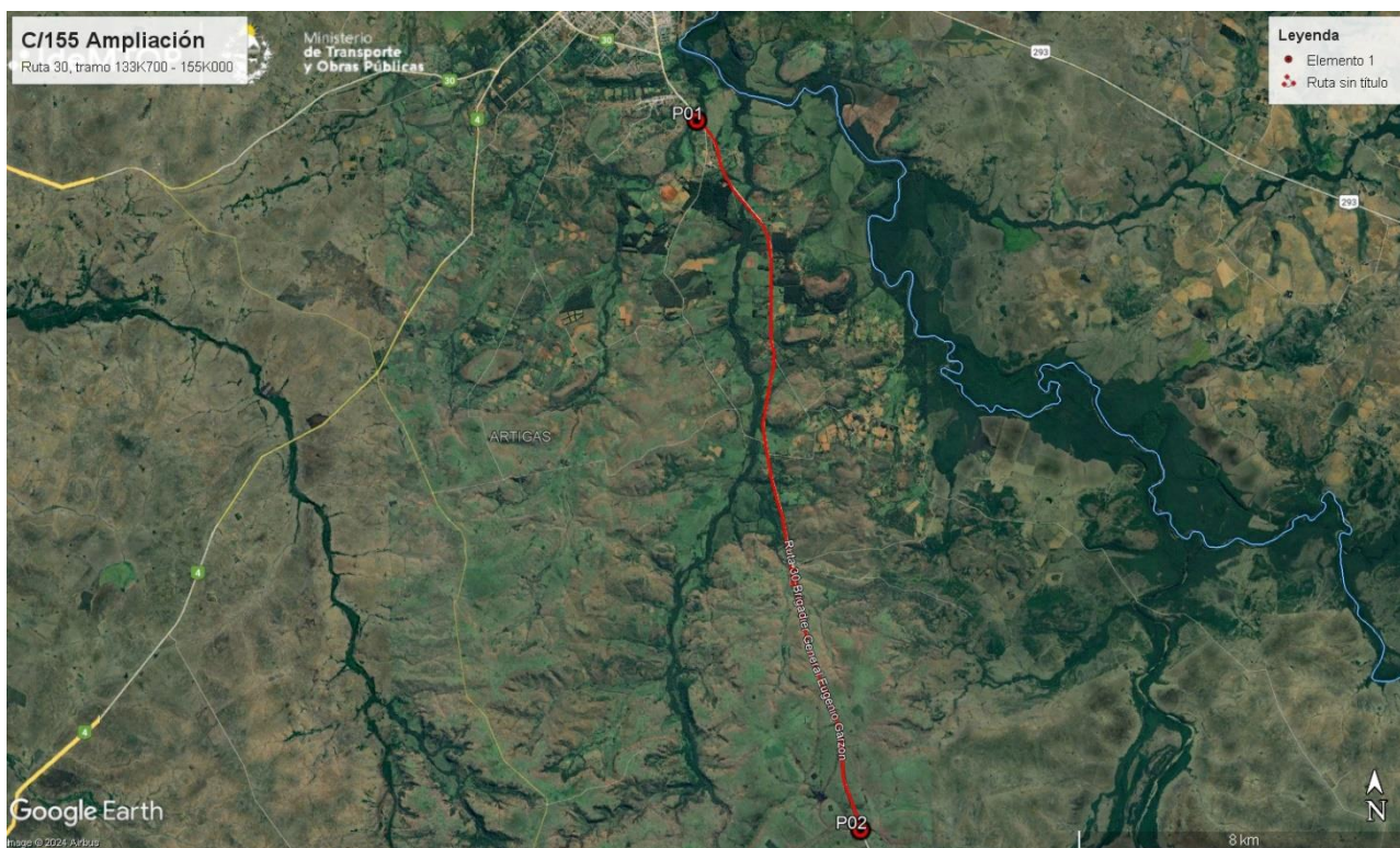
Figura 5-1 Lugares de interés.

Durante la auditoría ambiental se recorrió íntegramente el tramo de obras en Ruta 30. Se pudo observar que las obras están terminadas, y que la empresa Traxpalco SA se desmovilizó por completo de las zonas de obras, donde ya no quedan presentes infraestructuras o personal de la empresa.