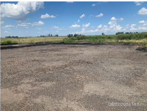
Foto 12.1-5, P03. Estacionamiento de cisternas, quedan eventualmente como mejora a beneficio del propietario.