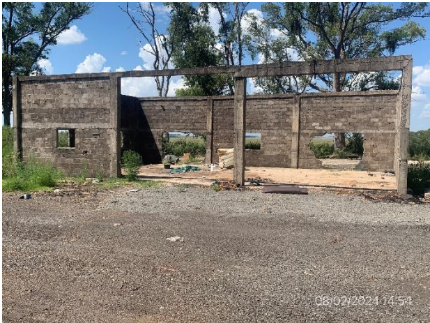
Foto 12.1-3, P03. Pañol a cielo abierto, quedan residuos sin disponer adecuadamente.