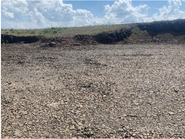
Foto 12.1-6, P04. Cantera de piedra abandonada. Ruta 30 progresiva 176K000 a (-).