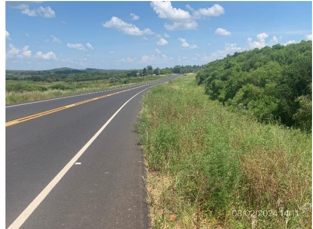
Foto 12.2-2, Ruta 30. Faja pública en buenas condiciones de limpieza, sin ROCs visibles y con tapiz vegetal abundante.