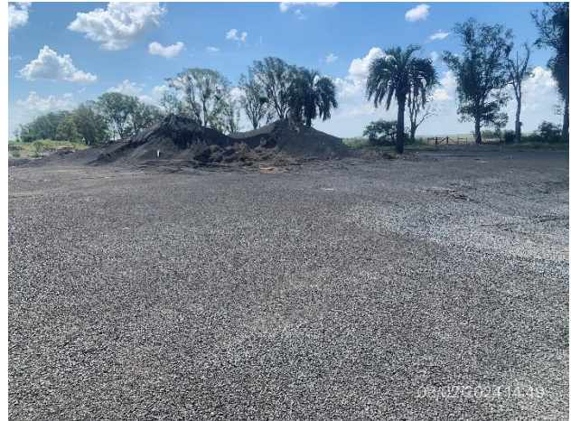
Foto 12.1-2, P03. Plataforma granular y acopios, quedan eventualmente como mejoras a beneficio del propietario.