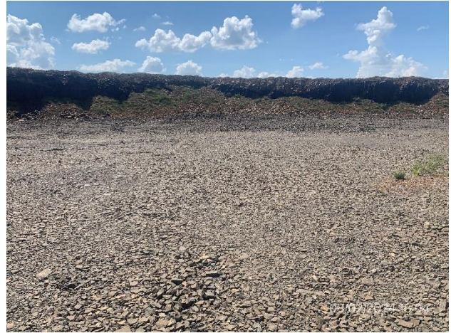
Foto 12.1-7, P04. Piso de cantera, zona libre de ROCs u otro tipo de residuos.