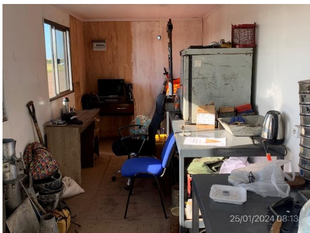
Foto 12.1-5, P03. Obrador. Laboratorio de suelos.