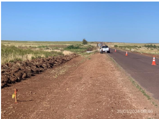
Foto 12.2-3, Ruta 20. Ensanche de plataforma y acondicionamiento de drenajes en ejecución.