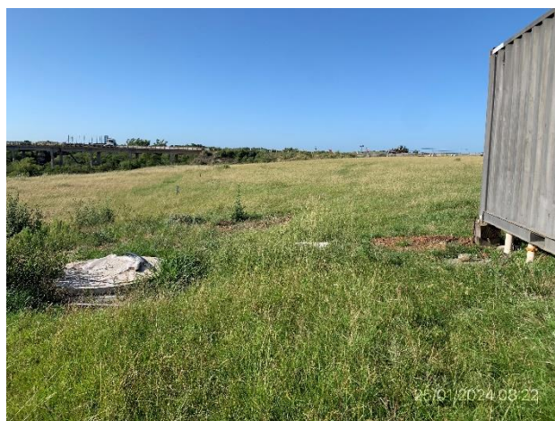
Foto 12.1-10, P03. Obrador. Depósito impermeable para aguas servidas.