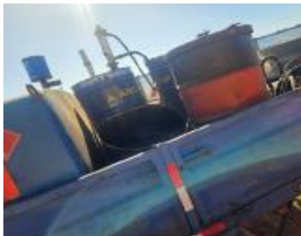
Foto 12.3-4 P04. Cantera, se dotó al camión surtidor de combustibles de Macriomil SA de tarrinas y recipientes para maniobras de carga de combustible.