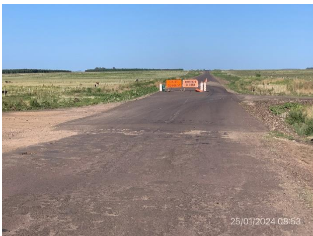
Foto 12.2-5, P01. Inicio de tramo. Ruta 20 progresiva 138K500.