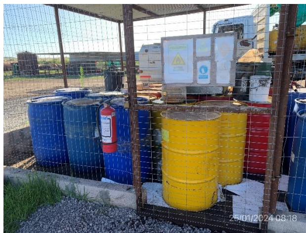
Foto 12.1-8, P03. Obrador. Tarrinas de hidrocarburos en sector con envallado defectuoso próximo a puerta de acceso.