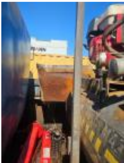
Foto 12.3-3, P04. Cantera, se dotó al camión surtidor de combustibles de Macriomil SA de tarrinas y recipientes para maniobras de carga de combustible.