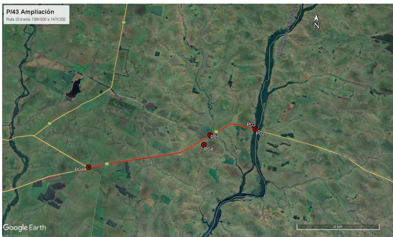
Figura 5-1 Lugares de interés.

Durante la auditoría ambiental se recorrió íntegramente el tramo de obras en Ruta 20, el predio de la cantera y donde también se ubicará la planta asfáltica en Ruta 20 progresiva 143K900 a (+), y el obrador en Ruta 20 progresiva 146K800 a (-).