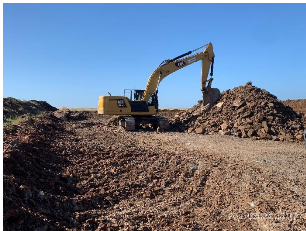
Foto 12.1-14, P04. Cantera, explotación a cargo de subcontrato Macromil SA.