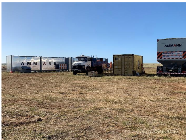
Foto 12.1-11, P04. Planta asfáltica en proceso de ensamble y montaje.