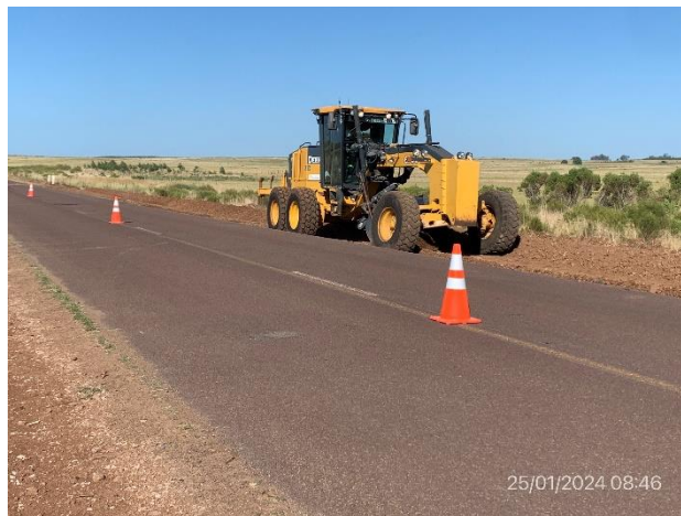
Foto 12.2-4, P05. Frente de obra. Ruta 20 progresiva 144K900.