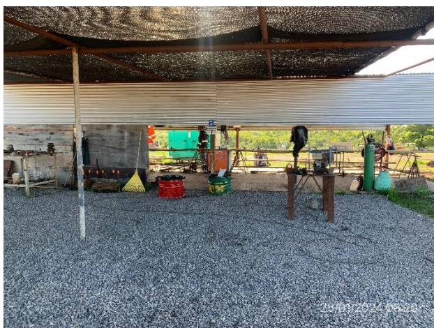
Foto 12.1-9, P03. Obrador. Sector de taller en buenas condiciones de orden y limpieza.