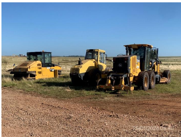
Foto 12.1-15, P04. Cantera, maquinaria pesada de Macromil SA en proceso de instalación.