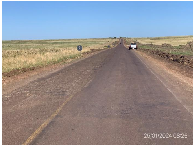
Foto 12.2-2, Ruta 20. Tramo con trabajos de bacheo en ejecución.