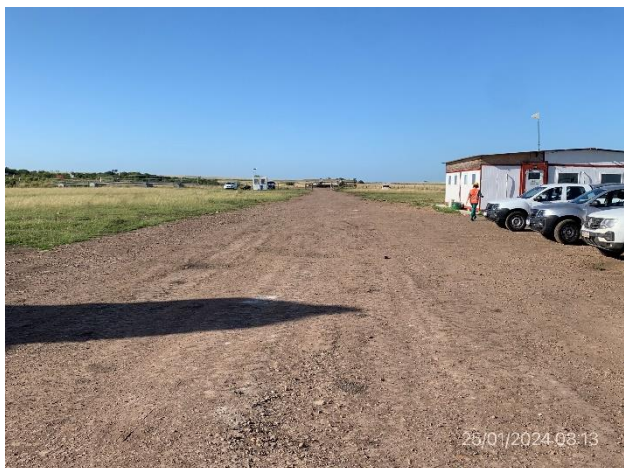
Foto 12.1-1, P03. Obrador. Vista general, accesos y explanada de maniobras.