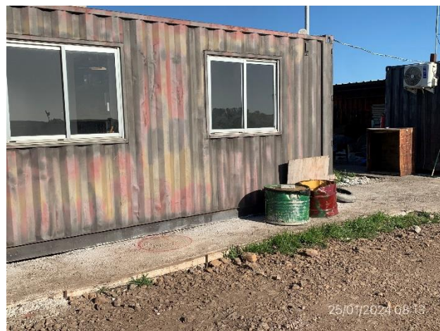
Foto 12.1-3, P03. Obrador. Estación de acopio temporal de residuos segados según corriente de generación.