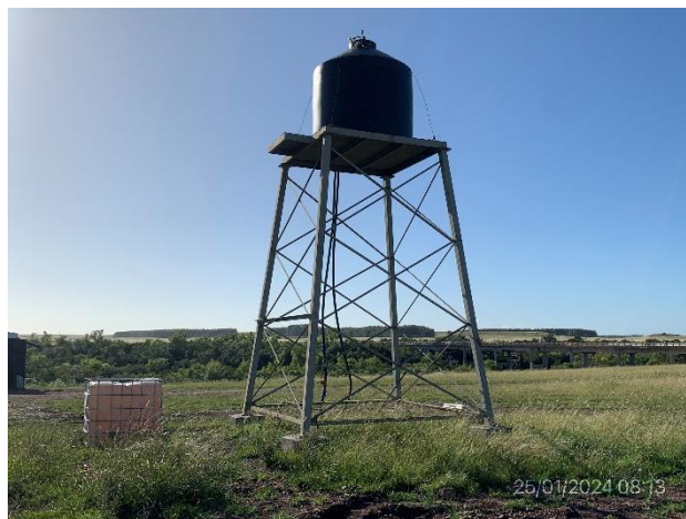
Foto 12.1-2, P03. Obrador, reservorio de agua no potable extraída a partir de toma de agua superficial con permiso de DINACEA vigente.