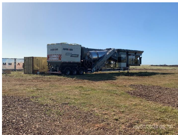
Foto 12.1-12, P04. Planta asfáltica en proceso de ensamble y montaje.