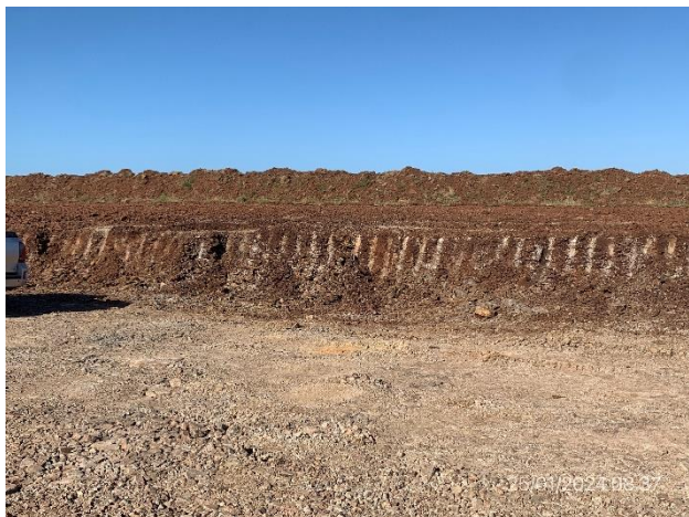
Foto 12.1-13, P04. Cantera, yacimiento de tosca en proceso de explotación.