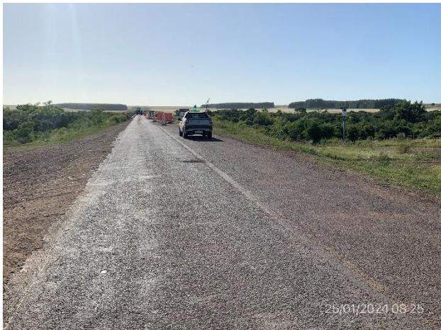
Foto 12.2-1, P02. Fin de tramo. Ruta 20 progresiva 147K200. Acceso a puente sobre A° Salsipuedes.