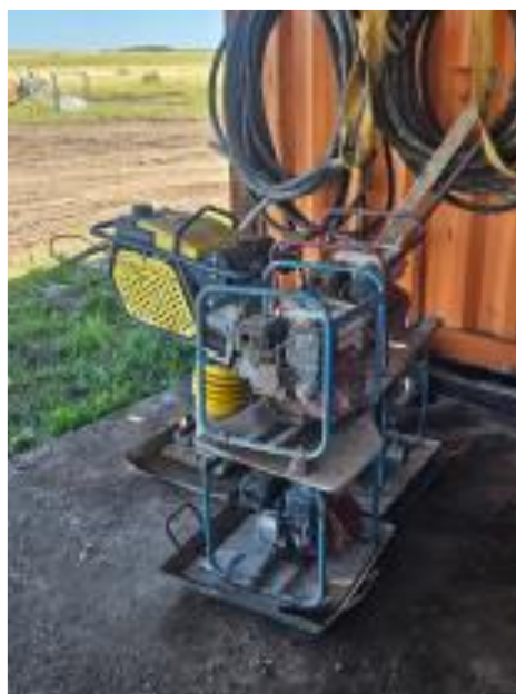
Foto 12.3-2, P03. Obrador. Se dotó a las motobombas de bandejas estancas para prevenir derrames.