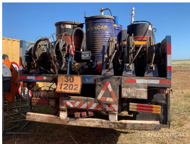
Foto 12.1-16, P04. Cantera, camión surtidor de Macromil SA, no cuenta con bandejas estancas para trasiego de combustible y lubricantes.