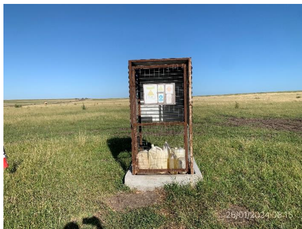
Foto 12.1-6, P03. Obrador. Recipientes de combustibles alojados en recinto con envallado impermeable.