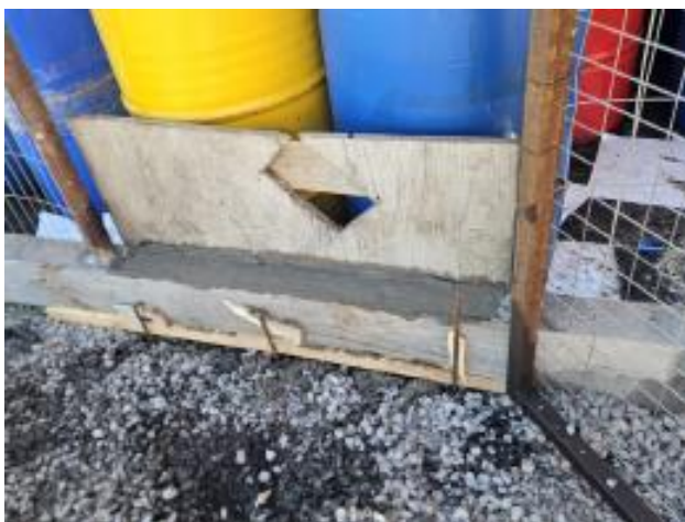
Foto 12.3-1, P03. Obrador. Se recompuso altura del envallado perimetral del recinto donde se alojan tarrinas de hidrocarburos.