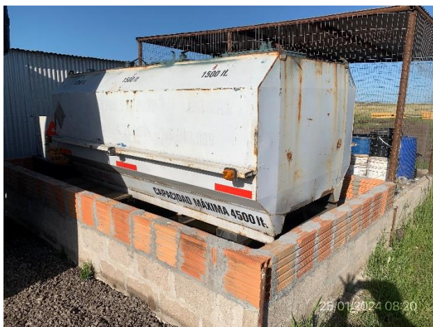
Foto 12.1-7, P03. Obrador. Tanque de combustible alojados en recinto con envallado impermeable.