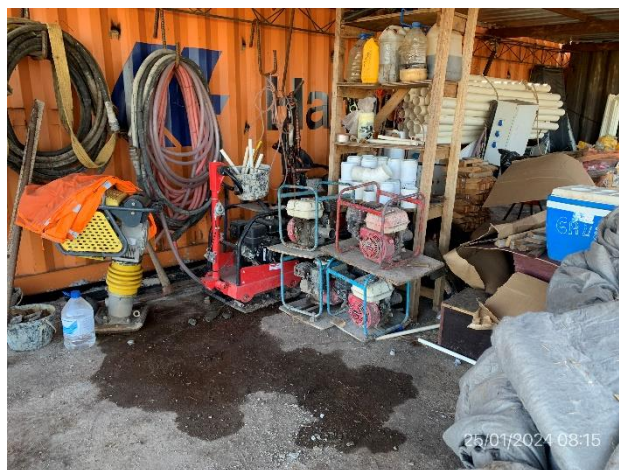
Foto 12.1-4, P03. Obrador, motobombas no están dotadas de bandejas para prevenir derrames.