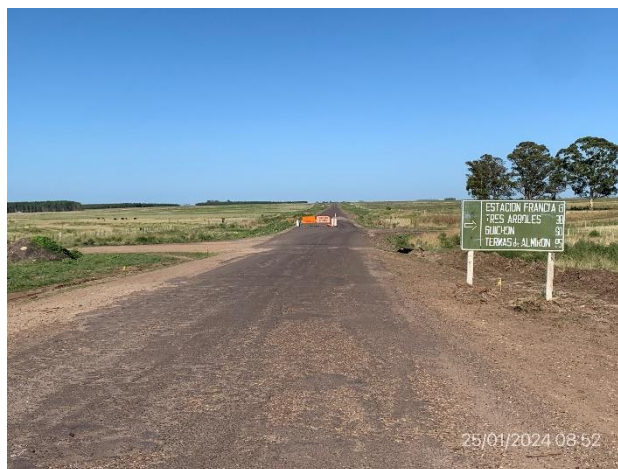
Foto 12.2-6, P01. Inicio de tramo. Ruta 20 progresiva 138K500.