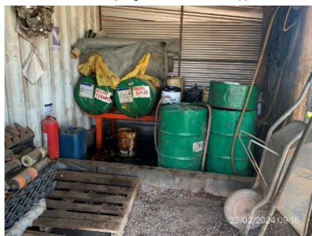
Foto 12.1-3, P05. Obrador. Acopio de lubricantes en local techado.