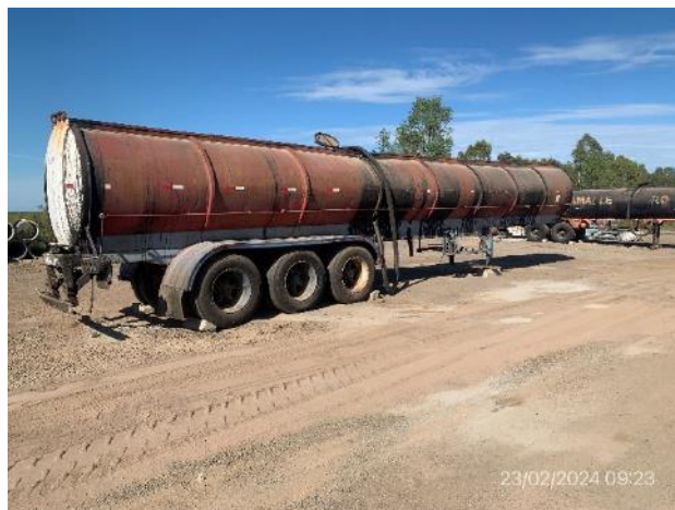
Foto 12.1-8, P05. Obrador, segunda cisterna estacionada en zona inapropiada por no contar con elementos previstos en el PGA para la prevención de derrames.