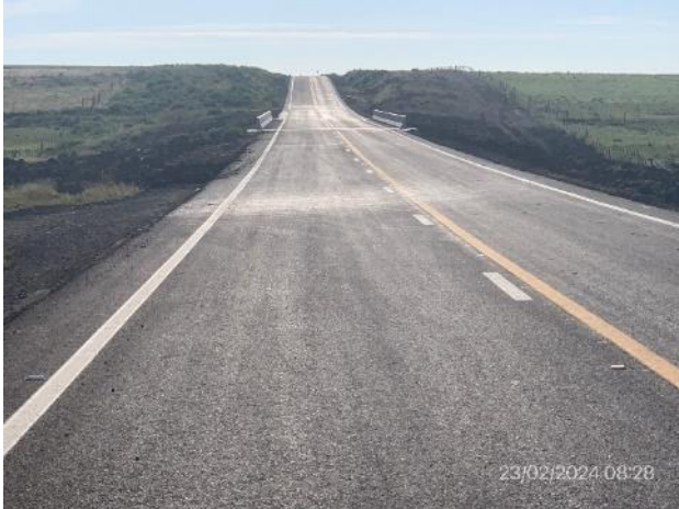
Foto 12.2-1, P01. Inicio de tramo. Ruta 20, Cabecera Este de puente sobre A° Rolón.