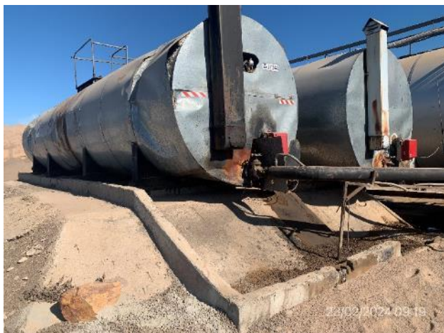
Foto 12.1-5, P05. Planta asfáltica, cisternas fijas elevadas con envolvado perimetral correcto.