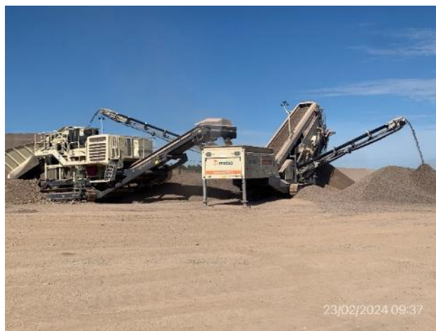
Foto 12.1-12, P06. Cantera de basalto, tirturación de áridos en proceso.