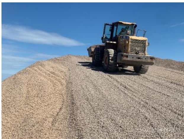
Foto 12.1-11, P06. Cantera de basalto, tareas extractivas finalizadas. Acopio de áridos triturados.