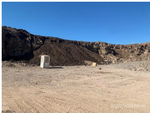
Foto 12.1-10, P06. Cantera de basalto, tareas extractivas finalizadas.