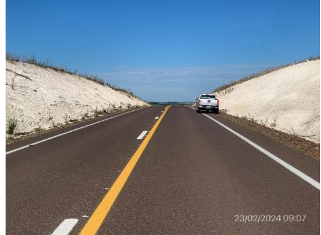
Foto 12.2-2, Ruta 20. Tramo de talud expuesto a erosión por faltante de cubierta vegetal.