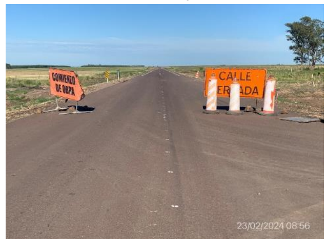
Foto 12.2-6, P02. Fin de tramo. Ruta 20 progresiva 138K560.