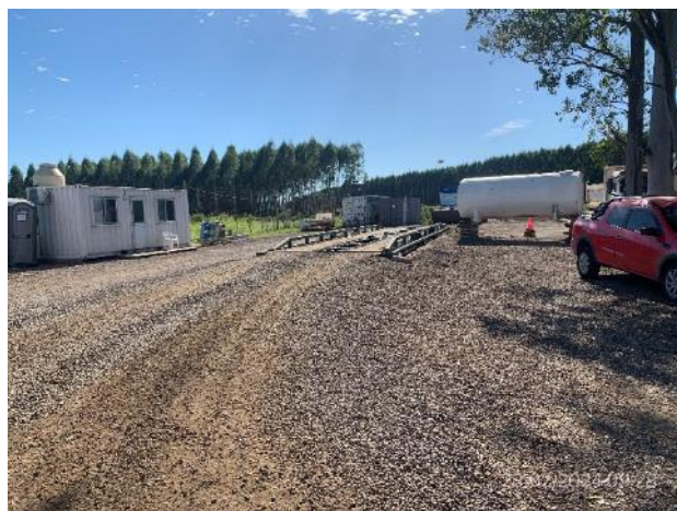
Foto 12.1-2, P05. Obrador, explanada de maniobras en condiciones apropiadas de orden y limpieza.