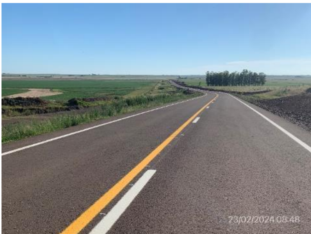
Foto 12.2-3, Ruta 20. Tareas terminadas, nueva carpeta de rodadura ejecutada.