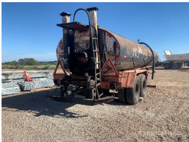
Foto 12.1-7, P05. Obrador, cisterna estacionada en zona inapropiada por no contar con elementos previstos en el PGA para la prevención de derrames.