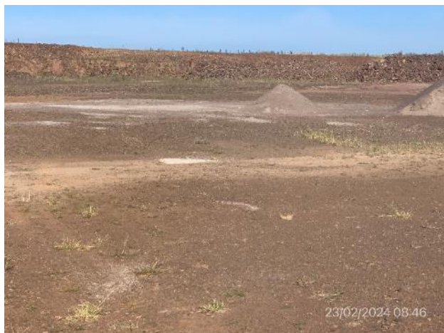
Foto 12.2-7, P04. Cantera de Tosca. padrón N°6551 de la 10ª Sección Catastral de Rio Negro, "Los Mimbres". Ruta 20, progresiva 136K800 a (-).