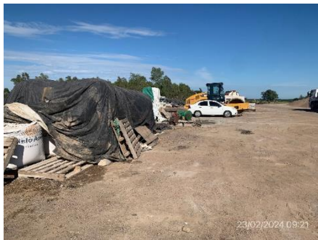
Foto 12.1-6, P05. Obrador, segunda explanada de acopio y estacionamiento extendida hacia camino vecinal.