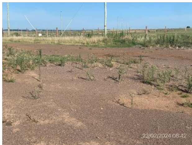
Foto 12.2-10, P03. Obrador secundario desmontado, faja pública de Ruta 20 restituida a DNV - MTOP