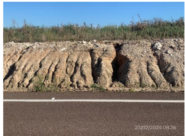
Foto 12.2-4, Ruta 20. Tramo de talud erosionado. No hay cobertura vegetal.