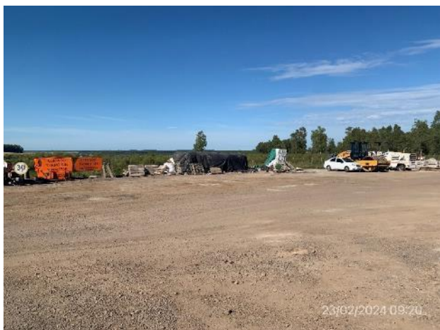
Foto 12.1-1, P05. Obrador y planta asfáltica de Meliter SA. Ruta 20, progresiva 123K600 a (-).