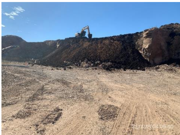
Foto 12.1-9, P06. Cantera de basalto. Padrón N° 4379, 10ª Sección Catastral de Río Negro. Ruta 4 progresiva 284.500 a (+).