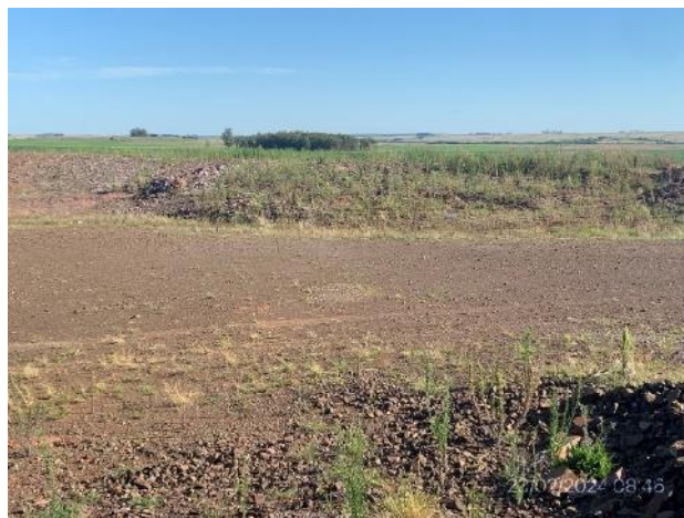
Foto 12.2-8, P04. Cantera de Tosca. Tareas de remediación ambiental ejecutadas, suavizado de taludes completo con cobertura vegetal.