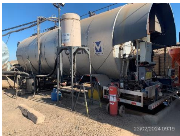
Foto 12.1-4, P05. Planta asfáltica. Envolvado perimetral correcto.