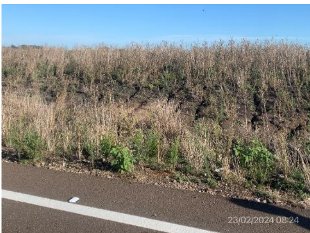
Foto 12.2-5, Ruta 20. Tramo de talud erosionado. Cobertura vegetal incompleta.