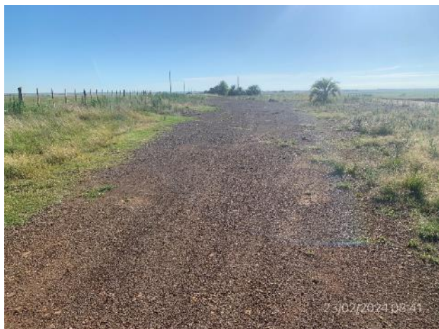
Foto 12.2-9, P03. Obrador secundario desmontado. Faja pública de nuevo trazado de Ruta 20, progresiva 136K800 a (-).