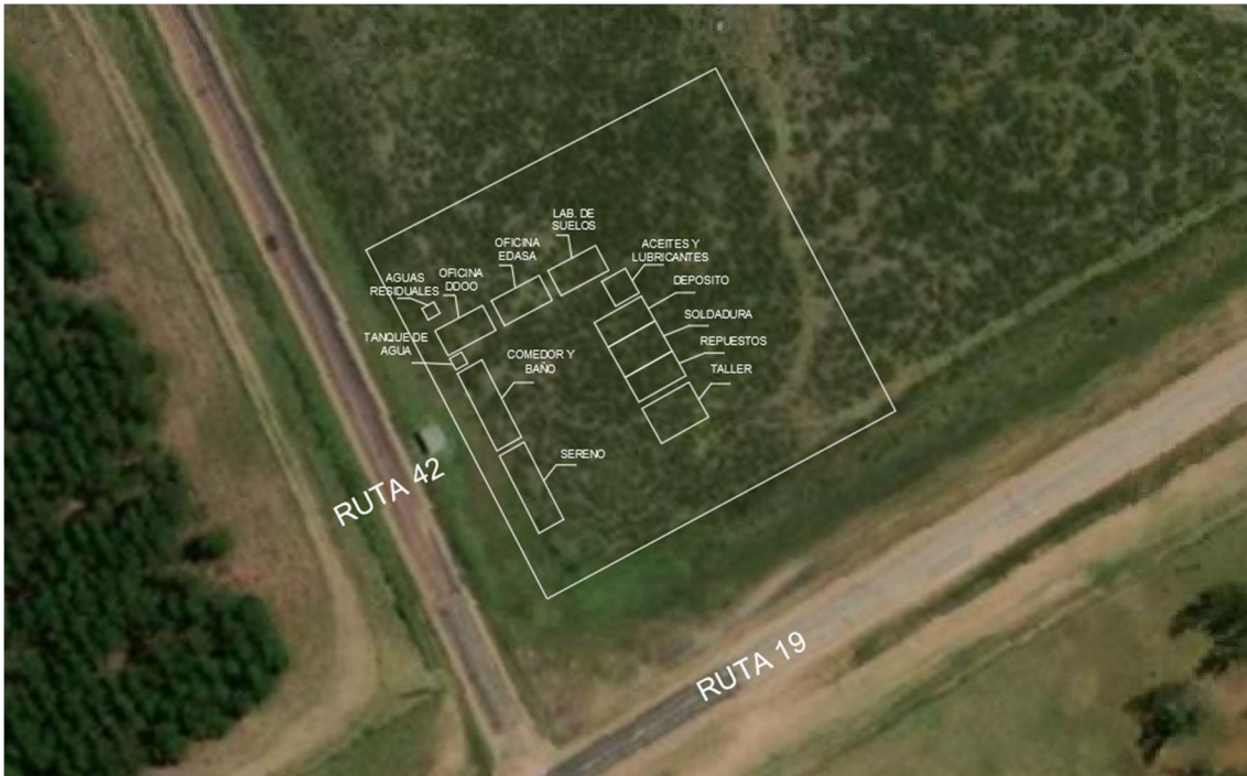
Plano de distribución del obrador

La descarga de los baños en el campamento, se hace a través de una empresa barométrica, contratada para tal fin.