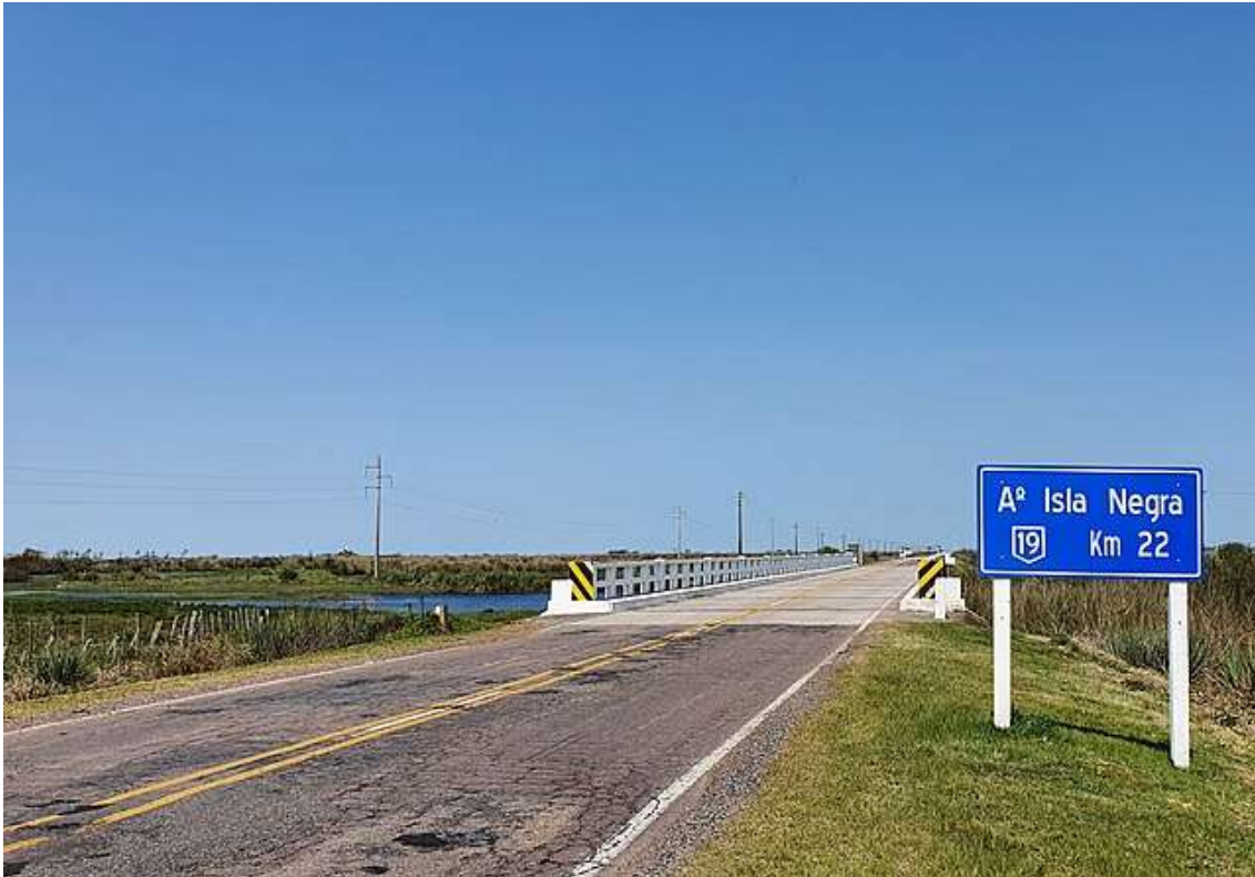
Ruta 19, tramo: Ruta 14 – Ruta 6

En el subtramo Ruta 14 - 9k600 se ejecutará una obra de recargo con 15 cm de material granular, posterior reciclado del material en 20 cm de profundidad con la adición de cemento portland para formar una base cementada en sitio. Como rodadura se tenderán 7 cm de carpeta asfáltica en un ancho de 8,40 mts. Esto implica una modificación al contrato original adecuando tareas y longitudes de tramos a mantener sin sobrepasar el monto contratado originalmente.