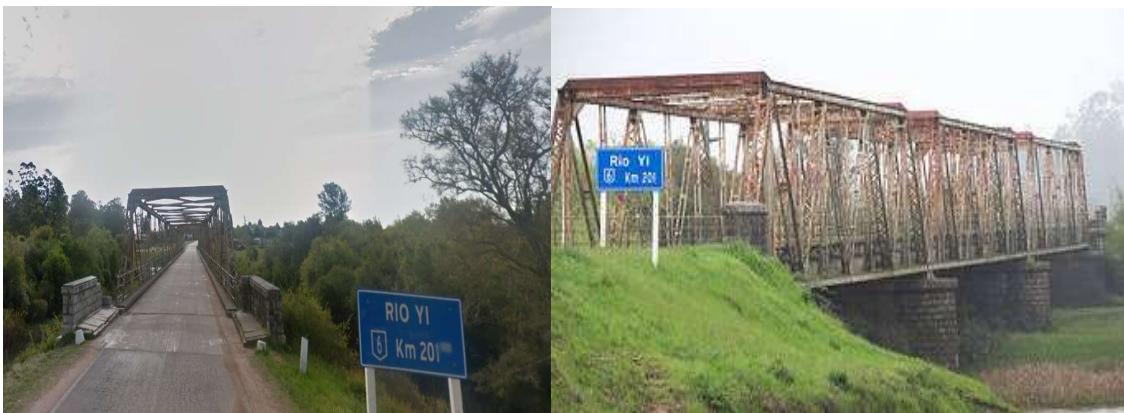
Puente sobre Rio Yi en Sarandí del Yi

Es una estructura reticulada metálica de 135 mts de largo con calzada de mezcla asfáltica de 5,50 mts de ancho. Está compuesto por 3 tramos de 45mts de luz simplemente apoyados