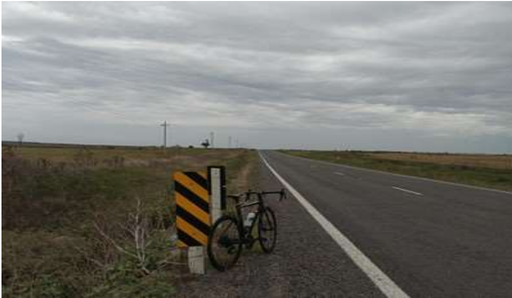
Ruta 6, tramo: Sarandí del Yi – Casa Sainz