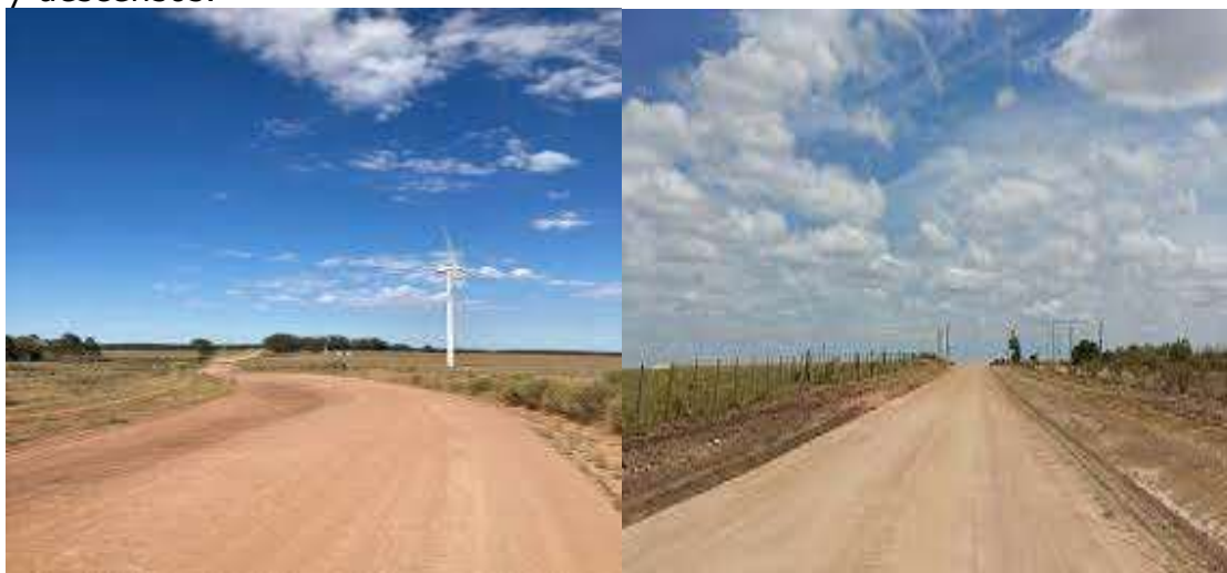
Ruta 19, tramo: Ruta 6 – Cerro Chato

En este tramo el pavimento de la calzada actual es material granular natural sin banquetas diferenciadas. Es un tramo sinuoso y con constantes ascensos y descensos.