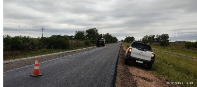
Foto 12.6-1 Frente de Obra.