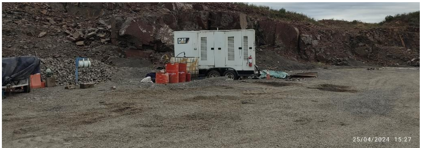
Foto 12.5-1 Vistas Cantera Padrón 1126 e instalaciones.