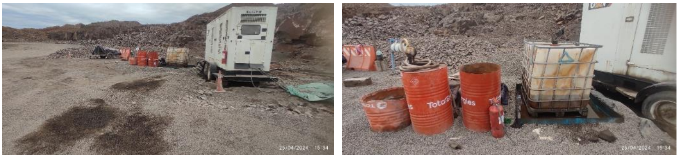
Foto 12.2-1 Derrames de hidrocarburos en instalaciones de Cantera Padrón 1126.