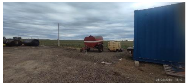
Foto 12.4-1 Obrador.