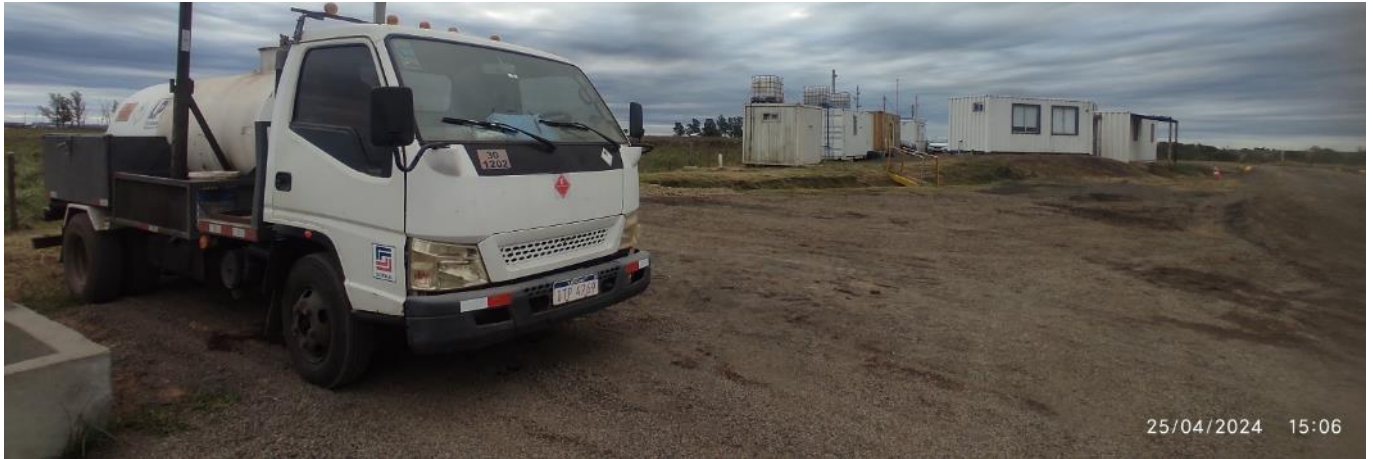
Foto 12.1-1 Derrames de hidrocarburos.