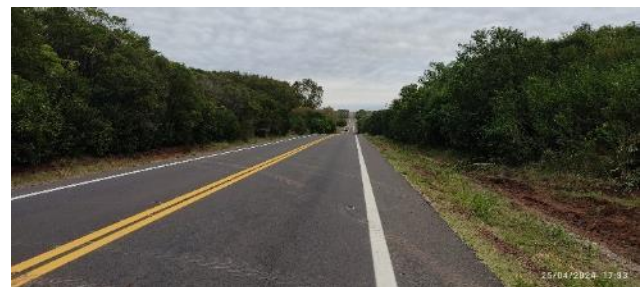
Foto 12.6-2 Tramo de obra terminado.