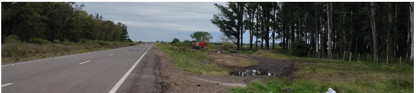
Foto 12.3-1 Faja sin cubierta vegetal.