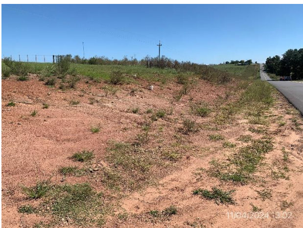
Foto 12.1-5, P06. Ruta 26 progresiva 356K000 a (+). Contratalud de faja pública erosionado.