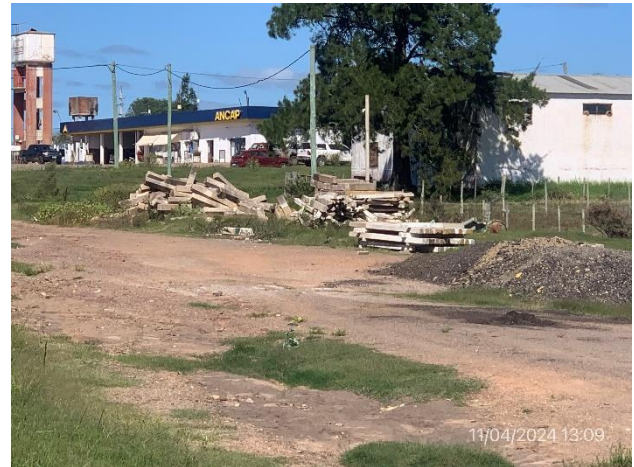
Foto 12.1-8, P07. Ruta 26 progresiva 355K000 a (+), acopio de ROCs en faja pública.