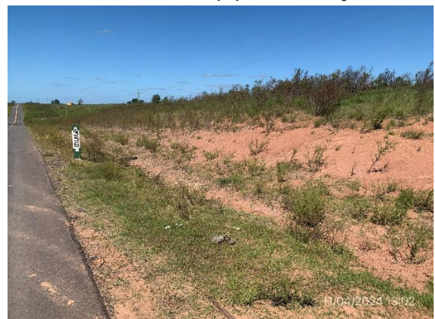
Foto 12.1-6, P06. Ruta 26 progresiva 356K000 a (+). Contratalud de faja pública sin adecuado tapiz vegetal.