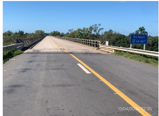
Foto 12.1-10, P02. Ruta 26 progresiva 369K000, Paso Aguiar. Acceso Oeste a puente sobre el Río Negro.