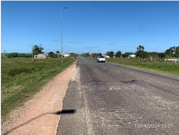
Foto 12.1-1, P01. Inicio de tramo, Ruta 26 progresiva 348K100. Localidad de Caraguatá.