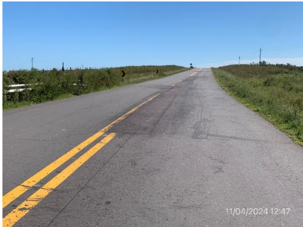
Foto 12.1-3. Obras de rehabilitación terminadas en Ruta 26, bacheos en mezcla asfáltica ejecutados.