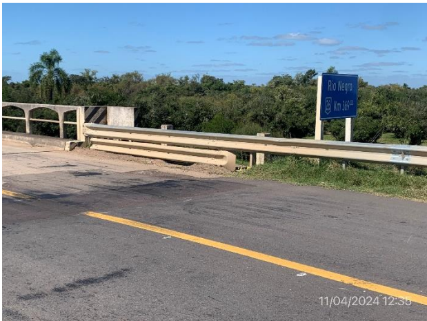
Foto 12.1-9, P02. Fin de tramo, Ruta 26 progresiva 369K000.