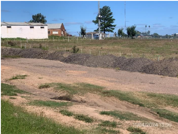
Foto 12.1-7, P07. Ruta 26 progresiva 355K000 a (+), acopio de RAP en faja pública.