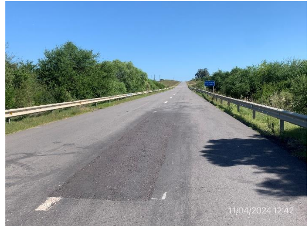
Foto 12.1-2. Obras de rehabilitación terminadas en Ruta 26, bacheos en mezcla asfáltica ejecutados