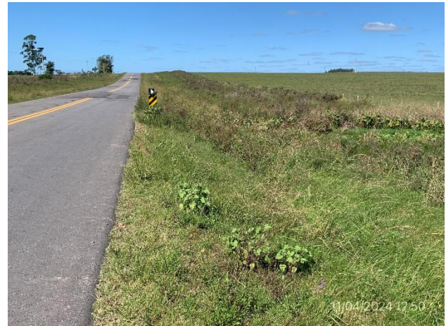
Foto 12.1-4 Faja pública de Ruta 26 en buenas condiciones de drenaje y cobertura vegetal.